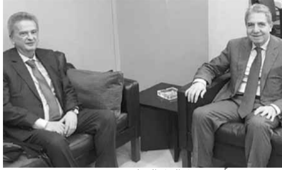
وزني مجتمعاً بمسؤول البنك الدولي

بحث وزير المال غازي وزني مع مدير دائرة المشرق في البنك الدولي ساروج كومار جاه في مواضيع مختلفة، منها دعم البنك لبنان في مكافحة «كورونا»، ومسألة تمويل التجارة، وآلية استعمال مبلغ الـ ٤٠ مليون دولار الذي وضعه البنك في تصرف الحكومة لآسّر الأكثر فقراً.