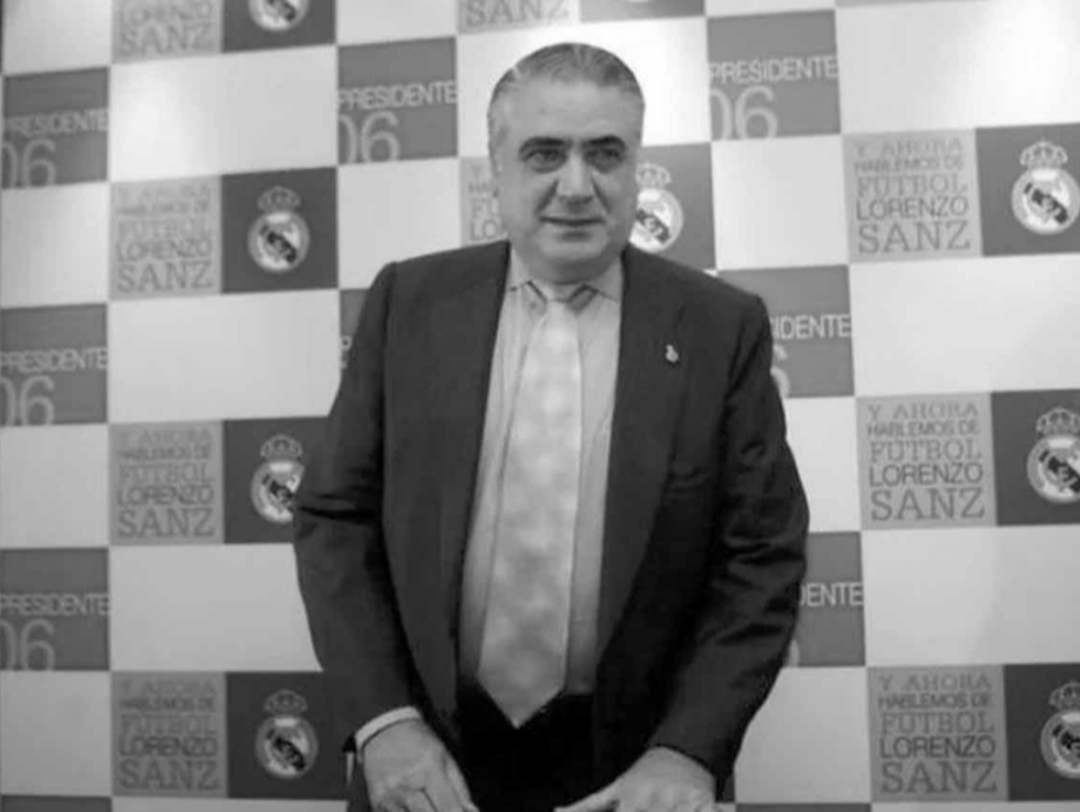
رئيس نادي ريال مدريد السابق لورنزو سانز

لم يميز فيروس كورونا المستجد بين كبير وصغير في عالم الرياضة، فبعدما فرض شللاً شبه كامل على البطولات والأحداث وأدى الى إرجاء بعضها والغاء آخر، طال الأفراد حاصدا إصابات في صفوف لاعبين ومسؤولين بصرف النظر عن عمرهم.