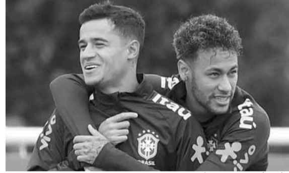
فيليب كوتينييو ونيمار

إلى باريس سان جيرمان أو إنتر ميلان. وكانت العديد من التقارير زعمت أن كوتينييو قد يكون جزءاً من صفقة تبادلية يعود خلالها مواطنه نيمار داسيلفا، نجم باريس، إلى «كامب نو».