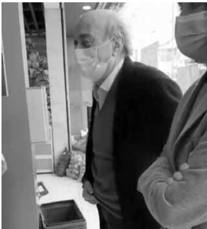
خلال جولة جنبلاط

الجمع بين الإثنين مع القليل من المرونة، ومن ثم الإتكال على القدر وعلى الأقل القيام بأقصى إجراءات الحذر والحماية والبحث عن طرق لتخفيف إنتشار المرض إذا استطعنا».