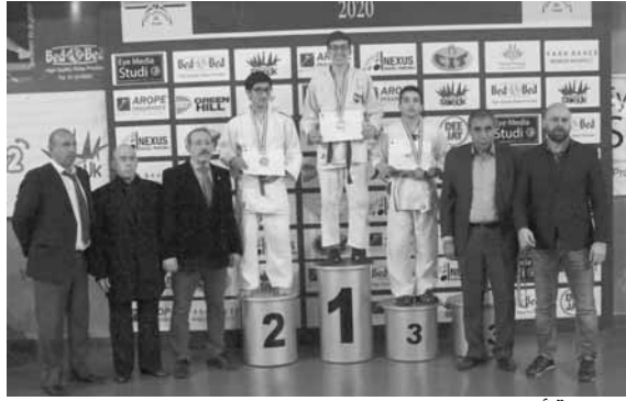
... وفترة أخرى