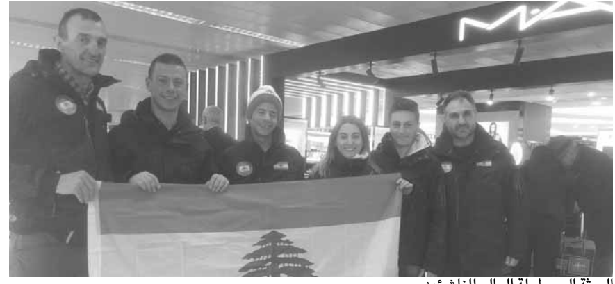
البعثة الى بطولة العالم للناشئين

غادرت بعثة الاتحاد اللبناني للترتج على الثلج بيروت فجر أمس الخميس متوجهة الى المانيا للمشاركة في بطولة العالم للناشئين في ترتج العمق.