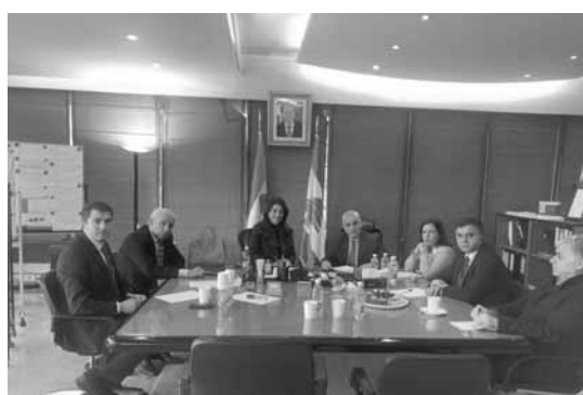
شريم مجتمعاً مع رئيس وأعضاء هيئة الصندوق

بدأت الوزارة الإنصال مباشرة بأصحاب هذه العقارات لإجراء الكشوفات اللازمة وتأمين المستندات، ونهار الإثنين المقبل سنعقد في السراي الحكومي مؤتمراً صحافياً نعلن خلاله عن خطوات عملية وملموسة ستقوم بها الوزارة».