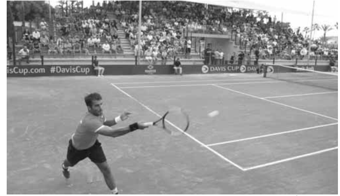
لقطة من أحد لقاءات لبنان واوزباكستان في ايلول الفائت

سيخوض لبنان مواجهة هامة ضد تايلاندا ضمن مسابقة كأس ديفيس بالتانس سيتحدد على أثرها الفريق الذي سيبقى في مصاف المجموعة الآسيوية - الأوقيانية الأولى والفريق الذي سيهبط الى المجموعة الآسيوية - الأوقيانية الثانية.