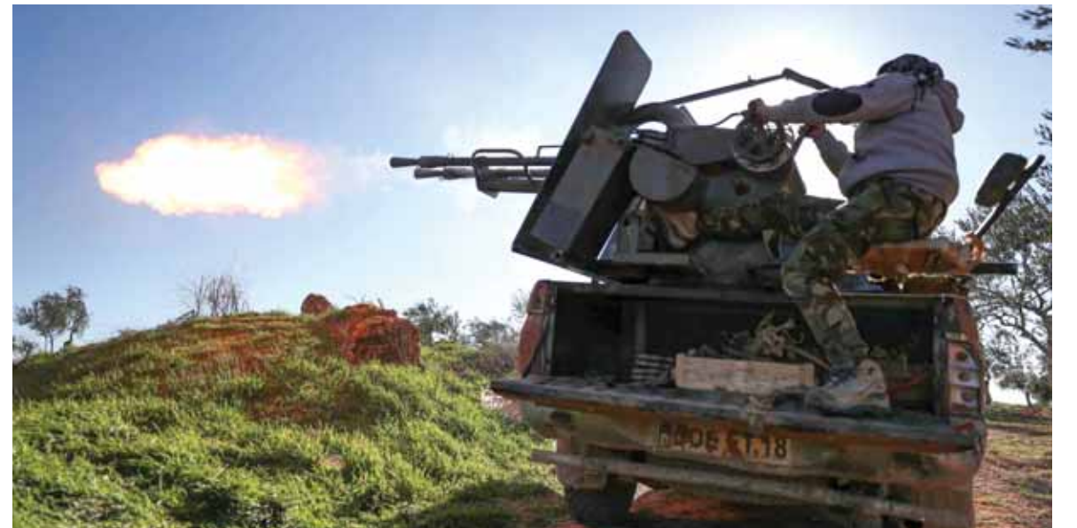
المعارك في ادلب

يوصل الجيش السوري عملياته العسكرية عند مثلث الحدود الإدارية لأرياف محافظات ادلب واللاذقية وحماة. في حماة تابعت وحدات من الجيش السوري تقدمها على محور «جبل شحشو» انطلاقاً من شمال النقطة التركية التي طوقها بالكامل في منطقة «شير مغار»، وسيطرت على ٣ بلدات جديدة بعد معارك ضارية مع المجموعات المسلحة، وفي مقدمتها تنظيم «الجبهة الوطنية للتحرير»، المدرج على لوائح رواتب الجيش التركي. وسيطرت وحدات الإقتحام في الجيش السوري على بلدات «الدقماق» و«القاهرة» و«الزقوم» بريف حماة الشمالي الغربي بعد تطهيرها من مسلحي التنظيم وحلفائه في تنظيمي «أنصار التوحيد»، و«جبهة النصرة»، وقتل وإصابة العشرات منهم. ومع التقدم الجديد، بات الجيش السوري على الأبواب الشرقية لبلدة «قسطون» الاستراتيجية والمعقل البارز لتنظيم «أنصار التوحيد»، وهذه البلدة تشكل الجبهة الجنوبية لإمارة الصينيين التركستان في سوريا. ويشكل التركستان الصينيون أبرز مقاتلي ما يسمى