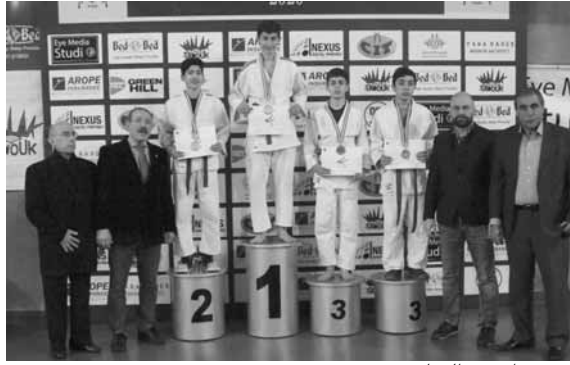
تتويج إحدى الفئات