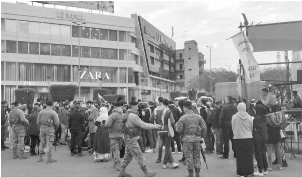
... وفي صيدا