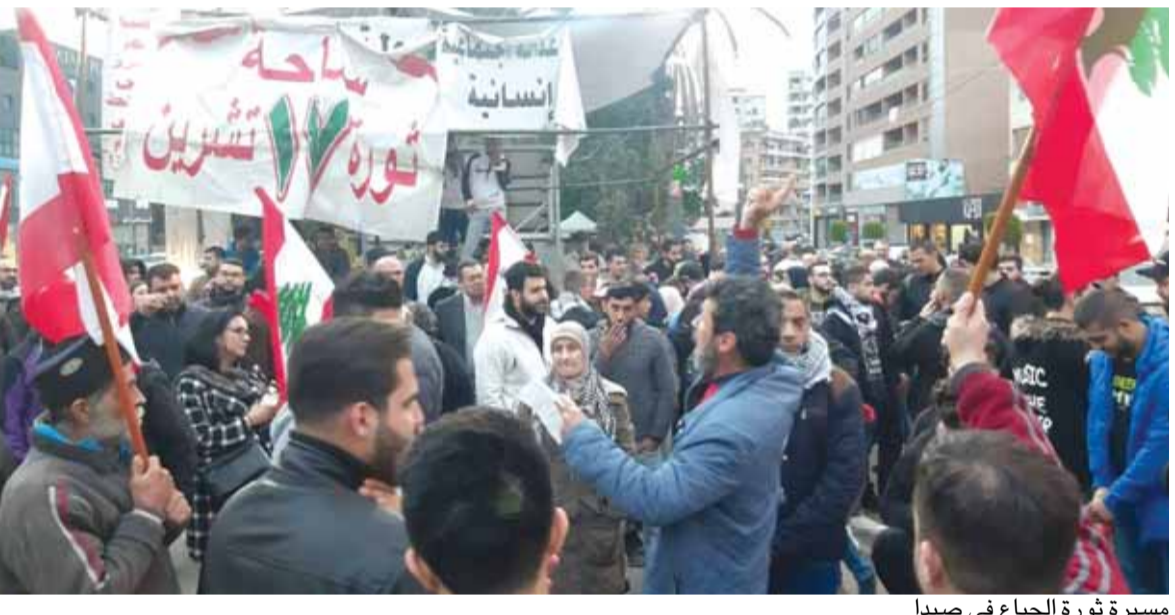
مسيرة ثورة الجيع في صيدا

إلى عدم دفع إستحقاقات ديونها مما سيُسبب فضيحة كبيرة تضرب مصداقية لبنان وسيكون تصنيقه تحت الصفر كبلد غير صالح للاستثمار. توجهات الحكومة هذه أنت بناء على صدى الشارع ونصائح القوى السياسية التي تخشى أن يتم دفع المستحقات مما سيؤجج الشارع أكثر نظراً إلى أن سياسيين وأصحاب نفوذ هربوا أموالهم إلى الخارج والحكومة لم تفعل شيئاً لاستردادهم. سكوت مدو عن الفساد والفاستين ولا عقاب إلا للشعب المسكين الذي يئن تحت ظلم طبقة سياسية تعيث بمالية الدولة منذ أكثر من ثلاثة عقود. فشل الحكومات السابقة في القيام بإصلاحات أضرت بشكل كبير باقتصاد لبنان وقطاعه المصرفي، ولولا تدابير مصرف لبنان لخرجت كل الودائع من لبنان التي كانت تبلغ ١٨٢ مليار دولار. أما الآن فقد أصبحت ١٥٠ مليار دولار خلال ثلاثة أشهر! ولولا تدابير حاكم مصرف لبنان لانتهدت ودائع لبنان في شهر واحد وربما في أسبوع واحد. في هذا الوقت تترى الدول المجاورة بلبنان مثال قبرص وتركيا واليونان ومصر