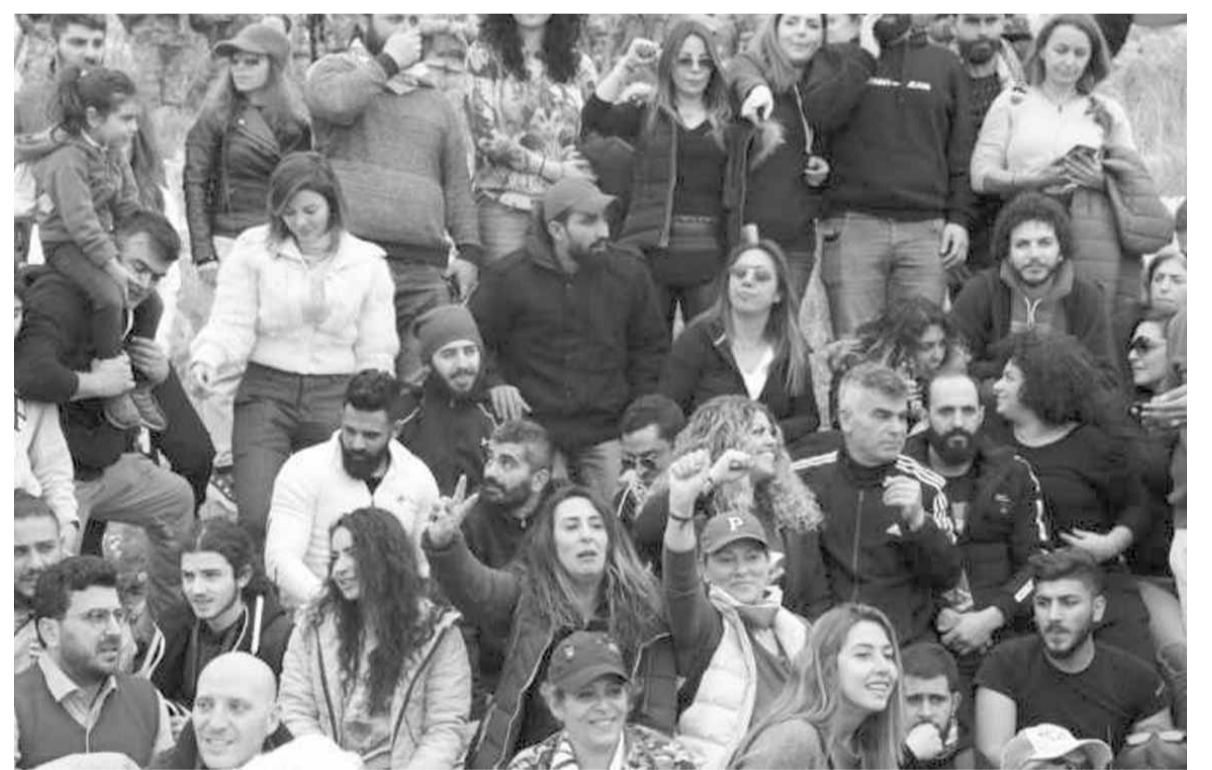
المسيرة الاحتجاجية من نهر الكلب

في بيان، أنه للمرة الثانية يُصدر التيار الوطني الحر بياناً في شأن الحملة عليه من بعض من يدعون الحرص على الآثار والبيئة لأن يبدو أن الحقيقة لم تردعهم عن الاستمرار في حملة ممنهجة تستهدفه كما في كل مرة.