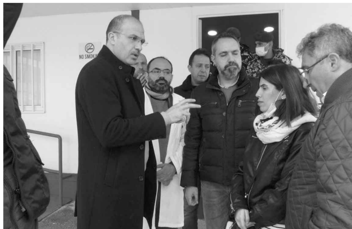
حسن يتفقد مكتب «الصحة» على الحدود مع سوريا

كما أكد ان «عرسال خالية من أي إصابة بفيروس كورونا، وعلى من أعلن هذا الخبر أن يبادر إلى التوضيح وتقديم الاعتذار من المواطنين، لأن هذا الإعلان أدى إلى حال هلع في البلدة والجوار».