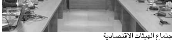
اجتماع الهيئات الاقتصادية

وعرض نحاس المراحل التي قطعتها اللجنة النيابية المكلفة بدرس المشروع، شارحاً الكثير من النقاط الأساسية التي يركز عليها النظام الجديد، ومنها: الأشخاص الذين يشملهم النظام، الاشتراكات وكيفية توزيعها، المعاش التقاعدي، تمويل النظام، وتشكيل لجنة لاستثمار الأموال.