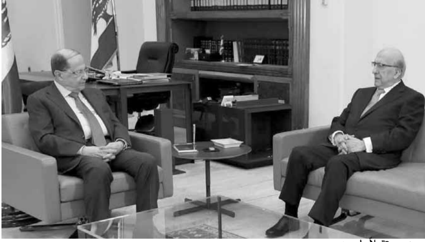
عون مستقبلاً طريبه

مماثلة، مركزاً خصوصاً على الدعوة إلى تجنب المسارات القضائية في هذه الحالات وولوج مسار التفاوض مع الدائنين بدلاً من المسار القضائي، لأن لخلاف على مقدار السندات ولا على مواعيد استحقاقها، بل يمكن طلب إرجاء دفعها بسبب الظروف المالية من خلال التفاوض على تأجيل الاستحقاق وليس على أي شيء آخر، وهذا الأمر طبيعي في القضايا المالية.