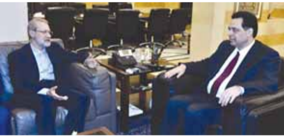
دياب مستقبلاً لاريجاني

مرارا، وتم تحديد موعدها بعدما نالت الحكومة الثقة، خصوصاً ان التجربة مع الرياض غير مشجعة فهي اتخذت القرار باحتجاز رئيس الحكومة السابق سعد الحريري بعد لقائه في بيروت مستشار المرشد الإيراني علي ولايتي... وفي انتظار رد الفعل الخليجي، تأتي هذه الزيارة الإيرانية في وقت ارتفع منسوب التهديد الإسرائيلي للساحة اللبنانية مجدداً، وقد حظيت تصريحات وزير الأمن الإسرائيلي نفتالي