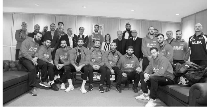
كبار الحضور مع البعثة