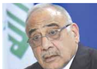
رئيس وزراء العراق عبد المهدي

دفاع جوي قوية هي باتريوت «سين تون» القادرة على اسقاط صواريخ تقصف القواعد الأميركية إضافة الى انها مخصصة لقص أي هدف جوي يهاجم القواعد، وقد اتخذ القرار مارك اسبر بعد أن وردت معلومات بأن هناك طائرات «درون» أي طائرات من دون طيار تحمل صواريخ ومنفجرات ويمكن توجيهها نحو القواعد الأميركية، كما ان منظومة «باتريوت» «سين تون» قادرة على اسقاط أي طائرة تهاجم القواعد من مسافة ٢٠٠ كلم.