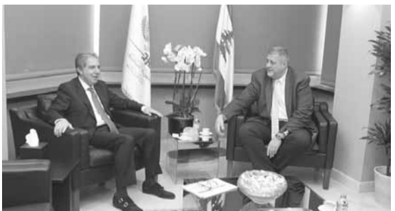
وزني خلال اجتماعاته

عقد وزير المالية الدكتور غازي وزني امس سلسلة من اللقاءات الدبلوماسية مع عدد من سفراء الدول الأوروبية والأجنبية للبحث في تطور الأوضاع المالية التي فرضتها الظروف الراهنة.