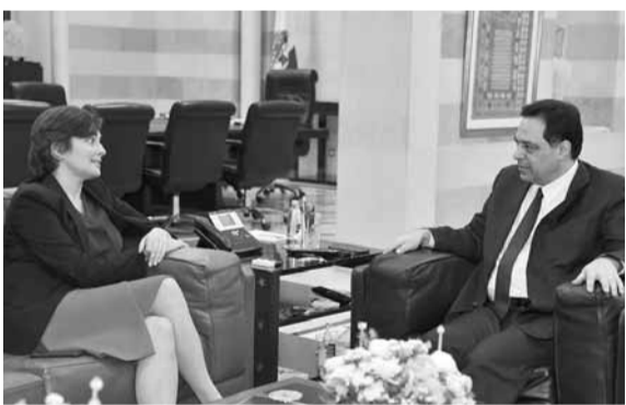
دياب مع سفيرة كندا (الدايتي ونهرا)

استقبل رئيس الوزراء الدكتور حسان دياب، امس في السراي، سفيرة أستراليا في لبنان ربيكا غريندلي التي قالت: «سررت بلقاء الرئيس دياب وهنأته بنيل الحكومة الثقة، وتمنيت له الصعوبة التي يجب عليه اتخاذها». ثم استقبل سفير إسبانيا خوسيه ماريا فري، الذي قال