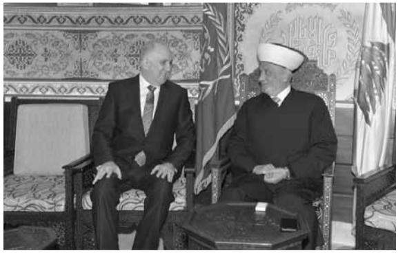
فهمي مجتمعاً مع دريان