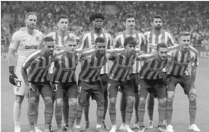
فريق أتلتيكو مدريد

ويسجل الفريق الفرنسي حضوره في دور الستة عشر للموسم الثامن على التوالي إلا أنه لم ينجح بالعبور إلى ربع النهائي في المواسم الثلاثة المنصرمة، في حين أن دورتموند تمكن من عبور دور الستة عشر مرة واحدة فقط في آخر خمسة مواسم له في دوري الأبطال وكانت في موسم ٢٠١٦-٢٠١٧ تحت قيادة توخل بالذات.