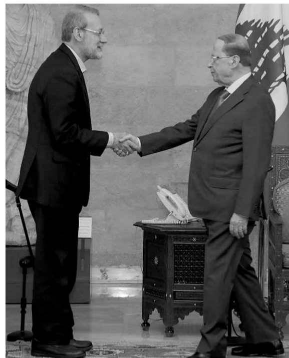
عون مستقبلاً لاريجاني (الدايتي ونهرا)

وتطرق لاريجاني إلى ازمات لبنان، لافتاً إلى استعداد بلاده للمساعدة، وقال: «لبنان يعاني حالياً من مشكلة في القطاع الكهربائي وبإمكان لبنان الاستفادة من تقديمات إيران لحل المشكلة وكذلك في مجال الأدوية»، مشيراً إلى أن «الطرف الوحيد الذي يريد حل المشاكل اللبنانية هو الشعب اللبناني».