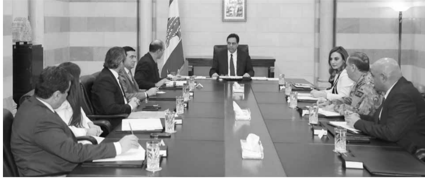
دياب يترأس الاجتماع

اللجنة الوزارية المختصة لترصد مكافحة وباء الكورونا اجتماعها برئاسة الرئيس دياب والوزراء المعنيين والادارات المختصة كافة، وتم التاكيد على عدم وجود اي حالة «كورونا» حتى تاريخه، وان الاجراءات المتخذة على الموانئ البرية والبحرية والجوية مطابقة لتعليمات منظمة الصحة العالمية، ومع اصرار الرئيس دياب على متابعة الموضوع والبقاء على أهبة الاستعداد للوقاية والتشدد ببعض الاجراءات على الموانئ ذات الصلة.