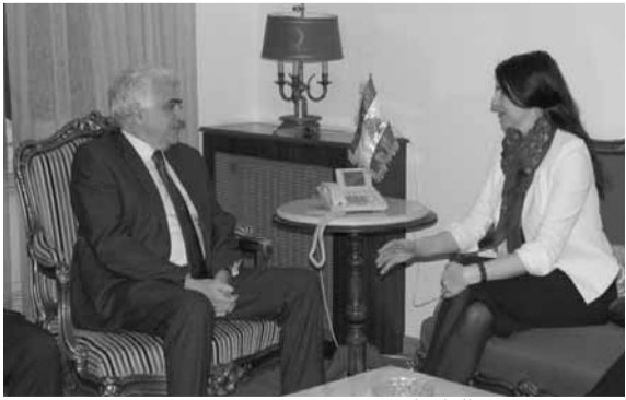
حتى مع سفيرة الدانمارك

استقبل وزير الخارجية والمغتربين الدكتور ناصيف حني، سفيرة الدانمارك ميريت بوهر التي أعلنت بعد اللقاء «أن البحث تناول العلاقات الثنائية بين بلدنا وسبل تعميق التعاون لا سيما في القطاعات المهمة كالطاقة المتجددة وتطوير الإنتاج الزراعي». ولفتت الى «أن الدانمارك من أكبر الدول المانحة للبنان