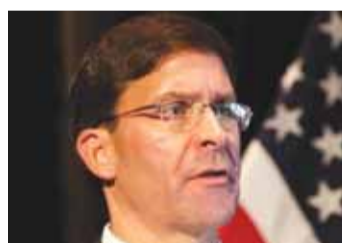
وزير الدفاع الأميركي مارك اسبر