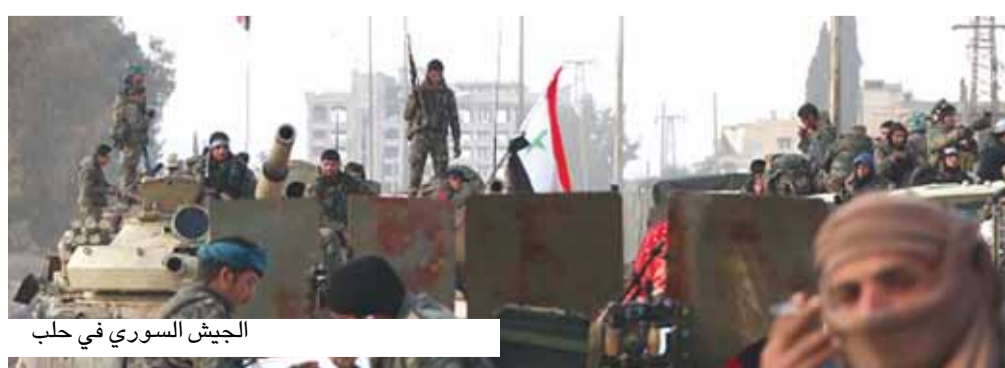
الجيش السوري في حلب

أعلن وزير النقل السوري علي حمود، أمس، عن عودة تشغيل مطار حلب الدولي. وقال حمود إن أول رحلة جوية من دمشق إلى حلب ستكون يوم الأربعاء المقبل، مشيراً إلى أن برمجة الرحلات من حلب إلى القاهرة ودمشق ستتم خلال الأيام المقبلة. كما أعلن الجيش السوري مدينة حلب مدينة خالية من الإرهاب وأمنة.