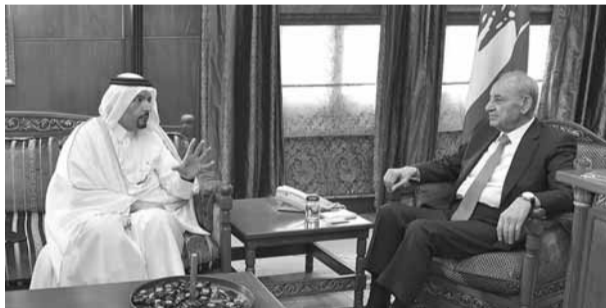
بري مجتمعاً مع سفير قطر (حسن ابراهيم)