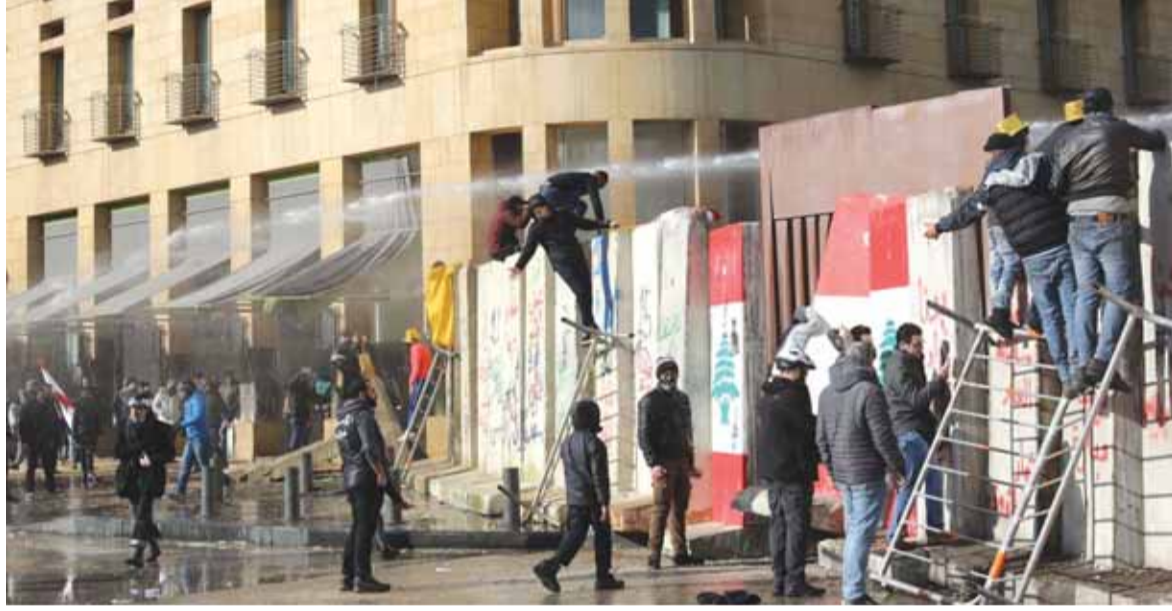
مواجهات بين المتظاهرين والقوى الامنية