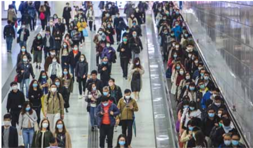
طراقات الصين كما بدت امس

قال الرئيس الصيني، شي جين بينغ، امس، إن أعمال الوقاية والسيطرة على فيروس كورونا الجديد تحقق نتائج إيجابية. ونقلت وسائل إعلام صينية عن الرئيس قوله «الصين ستنتصر في المعركة ضد