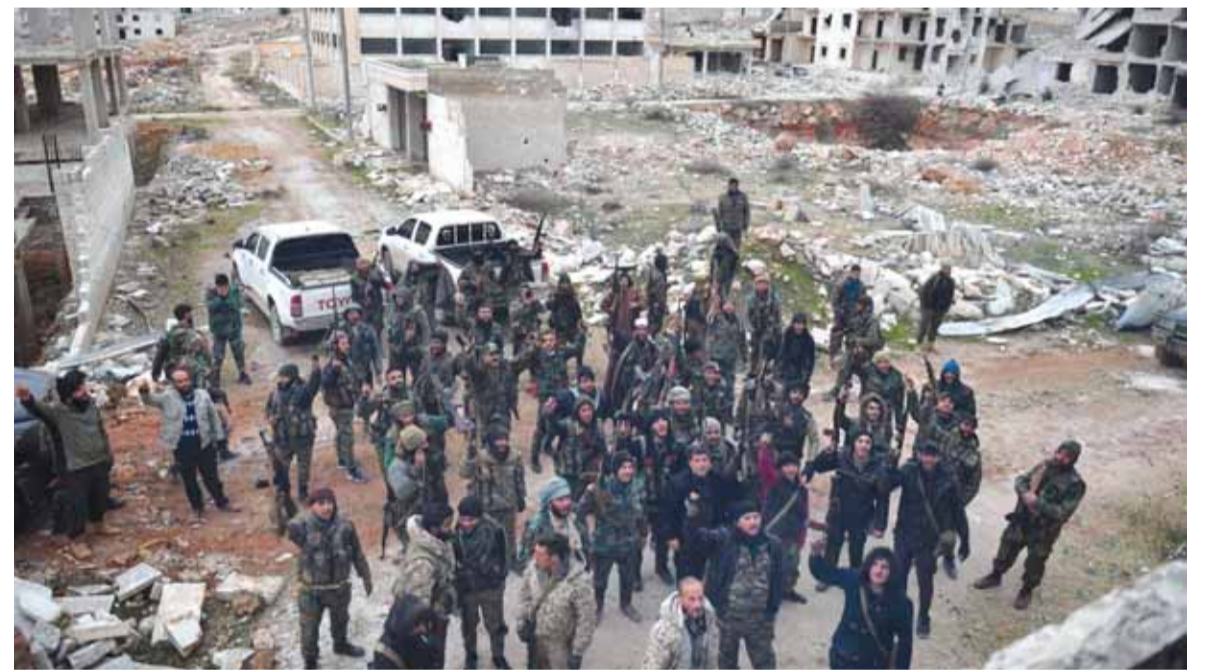
الجيش السوري يسيطر على المزيد من المناطق في ريف ادلب

وقال مصدر رسمي في وزارة الخارجية: «النظام التركي يستمر في عدوانه على سيادة وحرمة أراضي الجمهورية العربية السورية وذلك من خلال نشر المزيد من قواته في إدلب وريفها وريف حلب واستهداف المناطق المأهولة بالسكان وبعض النقاط العسكرية، وذلك في محاولة لإقناذ أدواته من