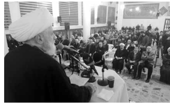
قاسم يتحدث من بعلبك

وحتى أصدقاء أميركا لهم مشاكل معها، والغدة السرطانية إسرائيل قائمة بسبب أميركا. أميركا تشارك الشعوب لتسلبهم خيراتهم ولا تعطيتهم شيئاً، لم تعط أميركا وعداً وصدقت به، وتوقع معاهدات وتخالفها من بدايتها إلى نهايتها، كما حصل بالاتفاق النووي، كل ذلك من موقع التسلط والاستئثار.