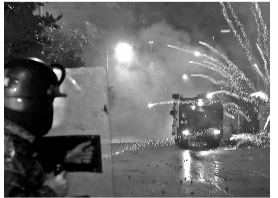
آلية لقوى الامن تتعرض للإعتداء بالمفرقات النارية

وعززت القوى الامنية من تواجدتها وتدابيرها الامنية في وسط بيروت ومحيطها، واستحدثت حواجز عدة دقت عبرها بالمركبات المتجهة إلى وسط المدينة، وقد اضافت بعض الحواجز العازلة على مداخل المجلس النيابي كالألواح الخشبية الطلية بالشحم لمنع المتظاهرين من تسلسلها تحسبا لأي مواجهة أو تصعيد خلال الإعتصام في المنطقة.