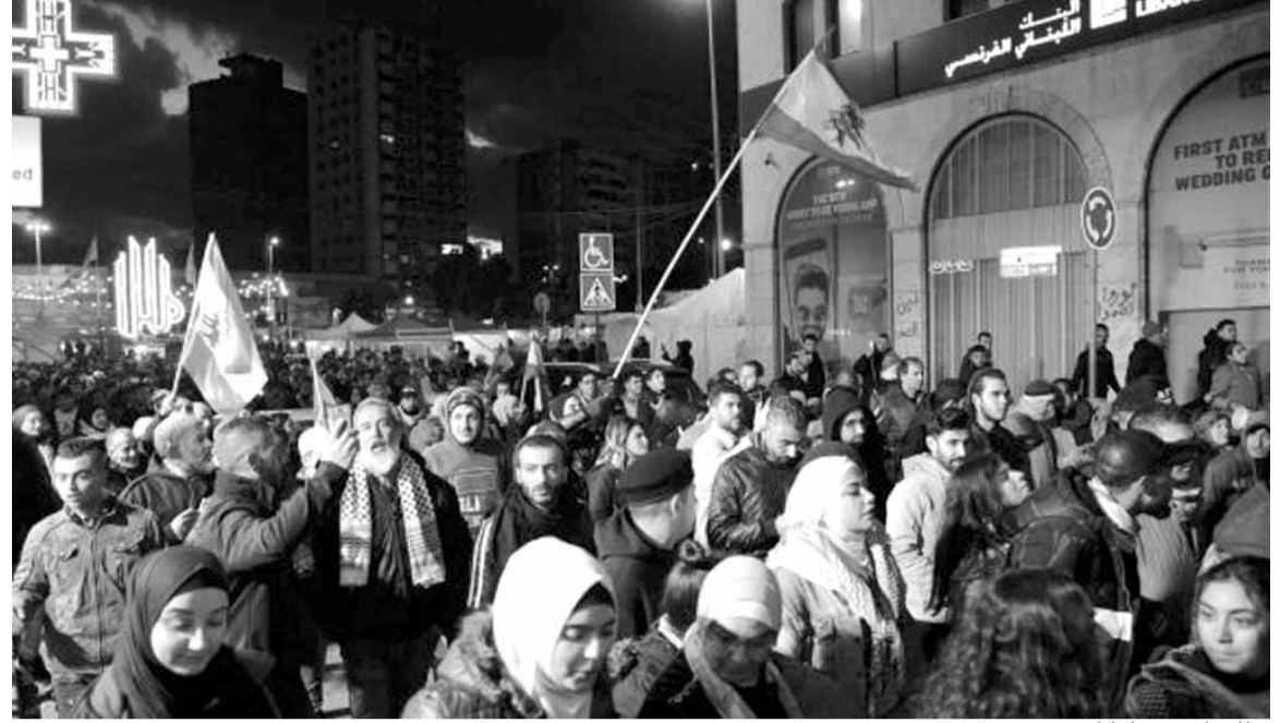
تظاهرات في طرابلس

لفت المكتب الإعلامي لوزير الاتصالات طلال حواط، في بيان له، «الى وجود حسابات وهمية تتحل صفة الوزير وتقوم بنشر أخبار وتصريحات مزيفة لا اساس لها..» وأكد أن «الوزير لا يملك سوى حسابه على موقع تويتر، وعليه أي خبر لا يصدر من الحساب الرسمي للوزير أو الوزارة عار من الصحة..»