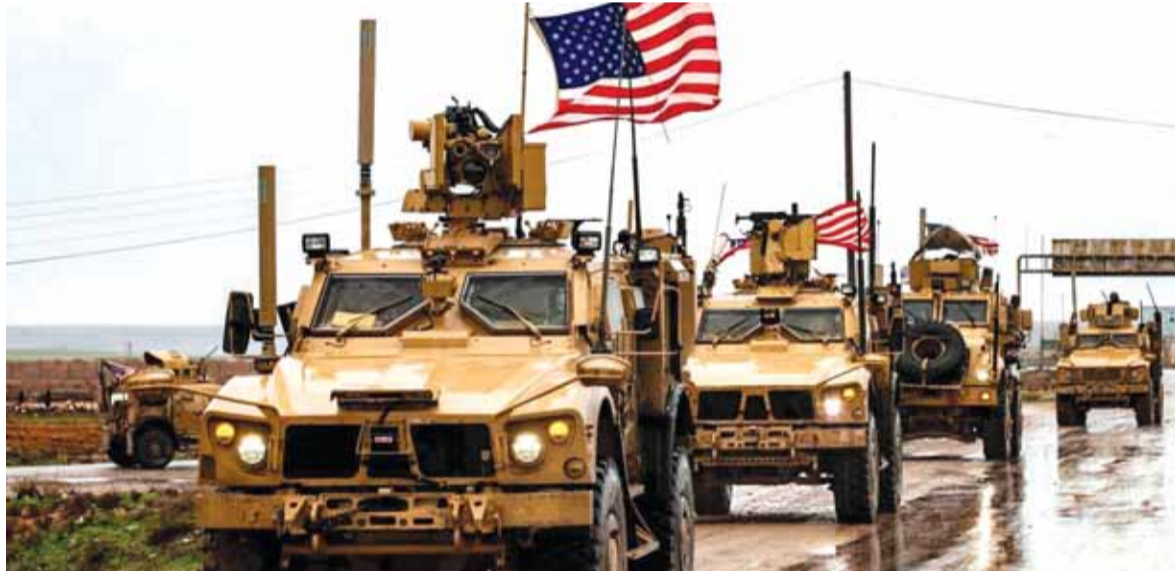
قوات اميركية تتقدم باتجاه الطريق الدولي M4

إشارة الى ان هذه المعابر تم فتحها في ١٢ كانون الثاني الحالي لتمكين المدنيين من مغادرة أراضي سيطرة المسلحين في المنطقة، لكن استئناف الأعمال القتالية بوتيرة متصاعدة أدى إلى إغلاقها.