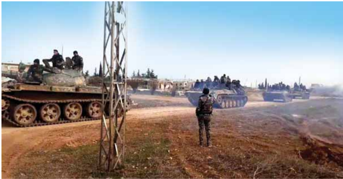
الجيش السوري يسيطر على قرى جنوب ادلب

أحرز الجيش السوري، أمس، تقدماً ميدانياً جديداً جنوب ادلب حيث سيطر على قريتين وبات على بعد أقل من نصف كيلومتر من معرة النعمان، أكبر معقل «جبهة النصرة» في المنطقة. وأفادت وكالة «سانا» السورية الرسمية بان وحدات من الجيش السوري طهرت بلدة تلمنس جنوب منطقة ادلب لخفض التصعيد من الإرهابيين، ولاحتق فلولهم باتجاه وادي الضيف وقرية معر شمشة. من جانبه، ذكر مصدر