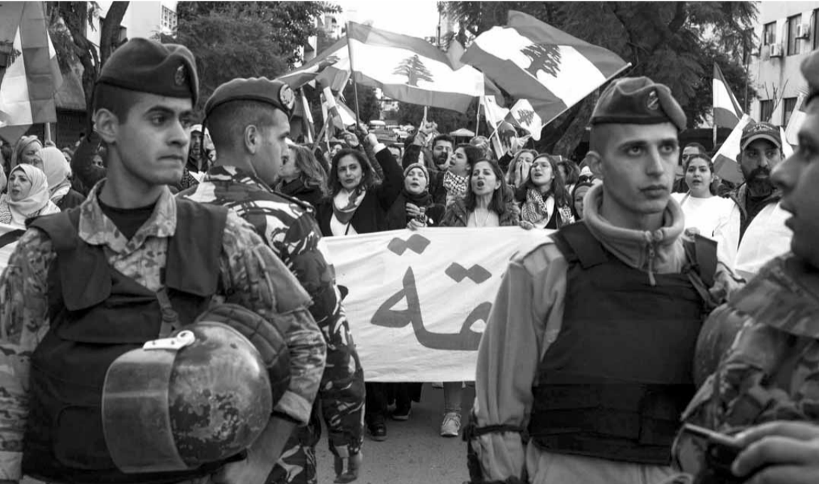
القوى الأمنية تراكب التظاهرات في بيروت

له تداعياته وانعكاساته على الساحة اللبنانية في ظل الشبه من خلال التطورات السياسية والأمنية بين البلدين، مع فارق أن هنالك أحداث وقتلى وجرحى يسقطون في العراق، لذا، يرتقب ومن خلال الأجواء المتأثية من أكثر من طرف سياسي، أن تنشط المعالجات لضبط الساحة السياسية والتي انطلقت من خلال لقاءات أمنية لبعض الأجهزة وكبار المسؤولين اللبنانيين وبتوجيهات من السلطة السياسية بغية السيطرة على الشارع وعدم تفلته وخروجه عن السيطرة، ولكن في موازاة ذلك، فإن قرار المنتفضين لمواجهة السلطة لا يؤشر إلى أي استكاثرة أو تراجع، بل أنهم وبحسب مصادرهم يتحضرون لسلسلة خطوات وأهداف سيقوم بها الناشطون في قطاعات ومرافق الدولة، وربما أكثر من ذلك، مع استمرار حراك الشارع، خصوصاً بعد عمليات القمع والإعتداءات التي تعرضوا لها، بالمقابل هناك صعوبة بدت واضحة من أجل إحداث صدمة إيجابية من قبل هذه الحكومة في الشارع، على اعتبار أن الإنهيار المالي والاقتصادي وتدهور أوضاع الناس اجتماعياً ومعيشياً لن يحل في وقت قريب، بل يحتاج إلى جهود وربما إلى مرحلة تتخطى الأشهر، وهذا ما لم يقبل به الناس المازومون على كافة الأصعدة، وبناء عليه تتوقع المصادر نفسها، وجراء ما يحصل على الأرض، فإن البلد أمام ظروف إستثنائية بالغة الدقة على اعتبار أن كل الاحتمالات واردة في ظل هذه التراكمات الهائلة.