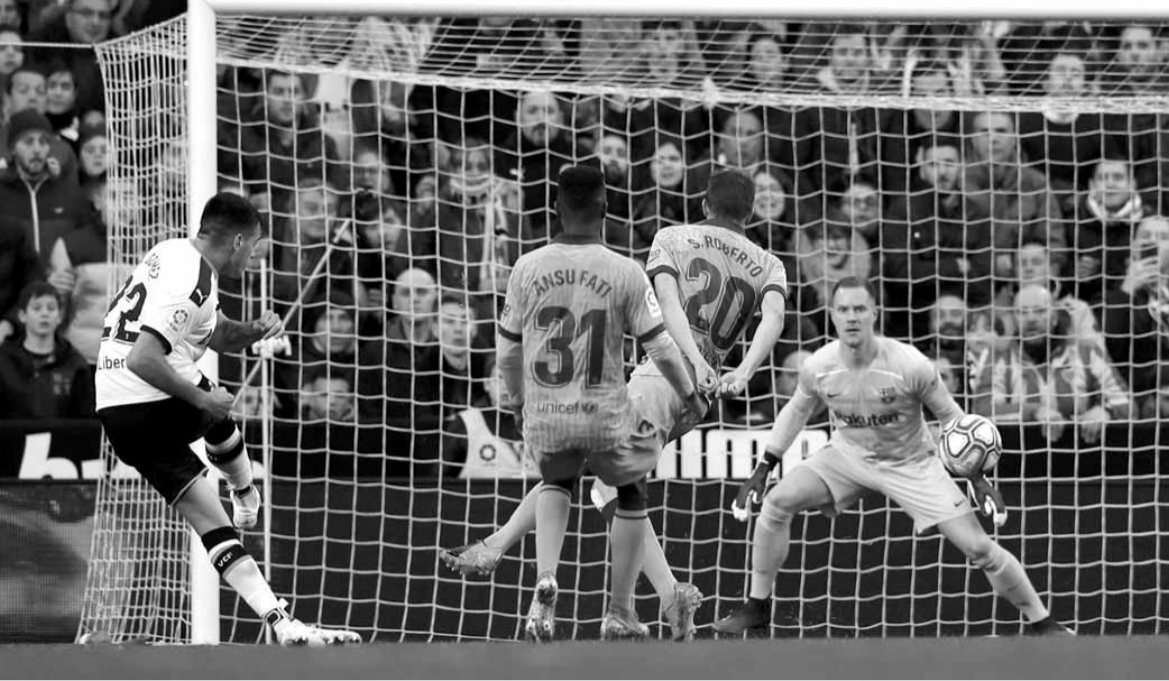
من مباراة فالنسيا وبرشلونة