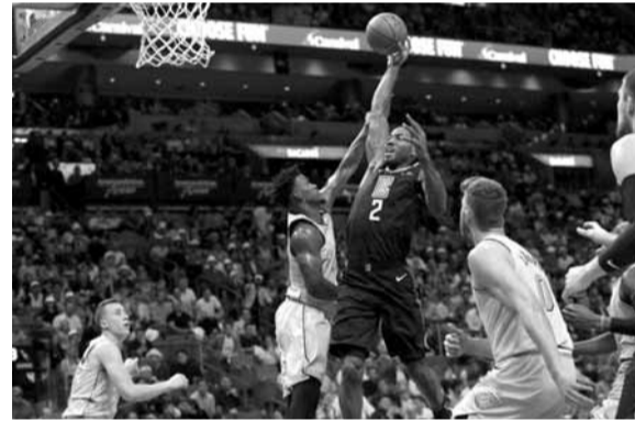
ليونارد في محاولة تسجيل لكليبرز

الأخيرة مع هيوستن روكتس وأحرز ٤٥ نقطة، هي الأعلى له هذا الموسم، ليمنحه الفوز ١٣١-١٢٤ على مستضيفه مينيسوتا تيمبرولفز.