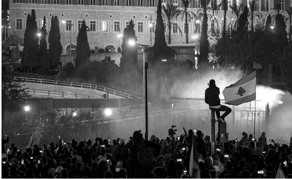
لحظة انطلاق المواجهات في وسط بيروت

لم يمنح المتظاهرون فرصة للحكومة الجديدة وكثيرون منهم لا يعرفون اسماء اعضاء الحكومة من رئيسها الى الوزراء جميعهم وحجبوا الثقة قبل أن تنهى بيانها الوزاري وقبل ان تضع برنامجها وحلولها للامات القائمة في البلاد... براي مراجع سياسية ان المتظاهرين لا يملكون الثقافة السياسية الكافية لحجب الثقة الشعبية او منحها ولبسوا في موقع التقرير او الوعي السياسي... ولذلك لدى مراجع متعددة ان هناك قوى سياسية تقف في الخلف وتحرك الشارع مستغلة حجم الغضب الشعبي والوجع والفقر لدى الفئات الشعبية لا سيما استغلال حرمات المناطق الشمالية خاصة في عكار والمثنية والضنية وطرابلس... وليس بعيدا عن الكواليس