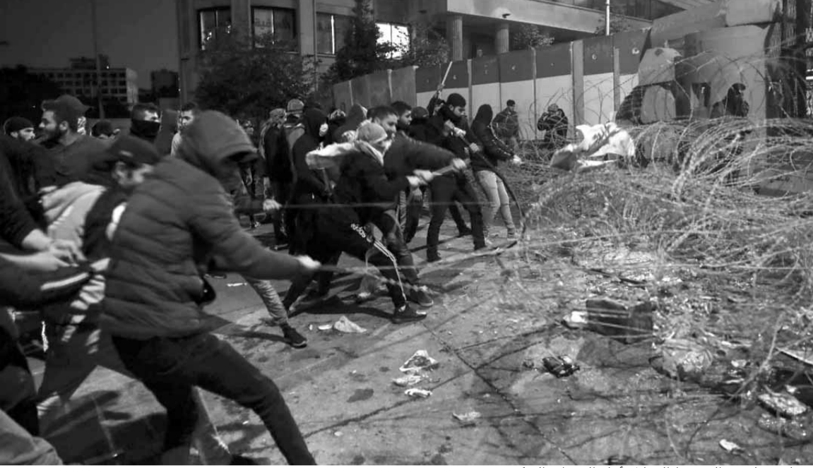
شبان يقتلعون الشريط الشائك أمام السراي الحكومي

نفسه فقد كشف سفراء اوروبيين لبعض المسؤولين الذين التقوهم، أن دولهم لن تقدم أية مساعدات للدولة اللبنانية وان كانت هذه المساعدات ضرورية من اجل الاستقرار المالي والاقتصادي، ومن هنا فإن الحكومة الحالية قد تكون حكومة التحضير لاستحقاقات مقبلة دستورية واصلاحية، مع العلم بأن اجماعاً قد تحقق على أن وجود الحكومة هو افضل من الفراغ.