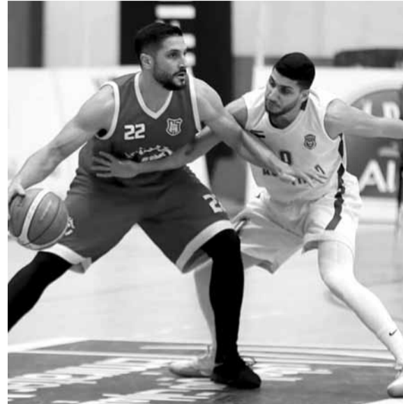
من لقاء الرياضي اللبناني والاتحاد السكندري المصري

الرياضي ٣٢ نقطة مع ه متابعات و ٢٢ تمريرات حاسمة و اضاف دواين جاكسون ٢٢ نقطة مع ٦ نقاط (٥٩-٩٨)، الأربعاء (٩١-٧١، ٨٢-٨١، ٢٢-٨٢ و ٦٢-٦٢) في اطار منافسات المجموعة الاولى لبطولة دبي الدولية.