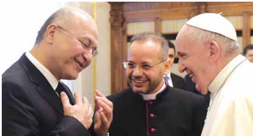
البابا مع صالح

وأفادت مراسلة «سبوتنيك»، بأن قوات مكافحة الشغب اقتحمت ساحة الخلائي، وأقدمت على إحراق خيم الاعتصام في بداية نفق التحرير، وسط العاصمة بغداد، وقالت أن «قوات مكافحة الشغب، اقتحمت نفق التحرير، من جهة ساحة الخلائي، بتفريق المتظاهرين باستخدام الرصاص الحي،