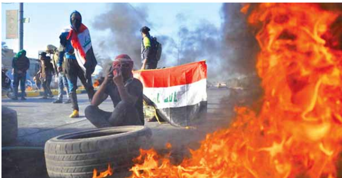
المتظاهرون يحرقون الدواب

قتل عدد من الأشخاص في صفوف المتظاهرين، أمس السبت، خلال اشتباكات مع قوات الأمن في العاصمة بغداد ومحافظه ذي قار العراقية.