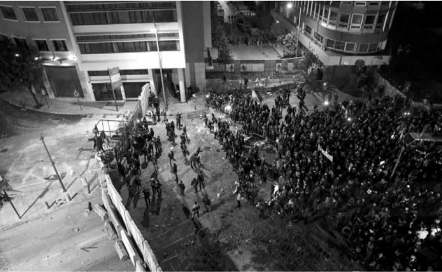
مواجهات في محيط السراي الحكومي

أيضاً بديلاً عن عملية إقفال مجلس النواب من قبل المنتفضين أنفسهم يجب السعي لفتحه لآقرار القوانين تقوّل الاوساط، وبالتالي فك حصاره وكذلك الأمر بالنسبة للحكومة، فلعبية الشارع تحتاج لقادة بتفاوت وولفس طويل، وليس اللفوضى، والوقائع تبشر بها خصوصاً ما حصل بالأوساط في الشارع بشكل فاضح، فيما الدولة تعي في العلن والسر أن ما ينادي به الحراك هو نفسه ما يتمتم به كل أهل السياسة جميعاً والاعتراف بالخطأ وعدم التكابر هو الوحيد والممر الإلزامي لنجاة لبنان، وتشير الاوساط الى ان الوقت يمضي ضد كل لبنان شعباً ومؤسسات، والحرب الاقتصادية هي حرب ذات مضمون سياسي، ولنكن لبنانيين أولاً شعباً وسلطة.