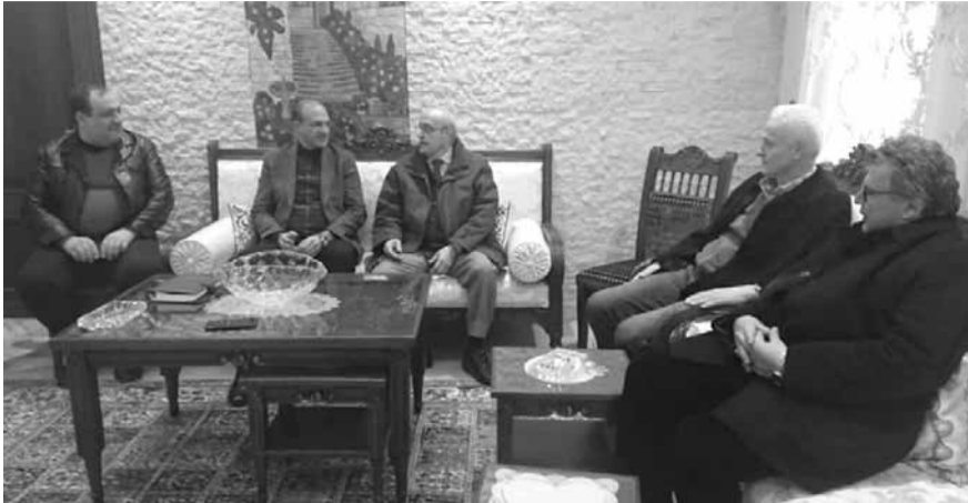
حسن مع وفد نقابة الاطباء

القضاء الذي كان غنيا بالمواضيع الصحية والنقابية ذات الاهتمام المشترك». واستقبل وزير الصحة العامة الدكتور محمد حسن في دارته في بعلبك، وقد «مندی بعلبك الإعلامي»، في حضور رئيس «الهيئة الوطنية الصحية الاجتماعية» النائب السابق اسماعيل سكرية. وشدد حسن على «دور وسائل الإعلام في تصويب الأداء ونشر الوعي بين المواطنين، فالإعلام مرآة الرأي العام، وتلعب الصحافة الاستقصائية دور الرقيب والمساهم في كشف مكامن الفساد وتفعيل الشفافية في الأداء العام».