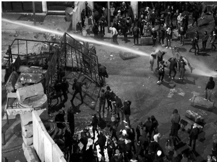
كر وفر بين قوى الامن والمتظاهرين قرب السراي الحكومي