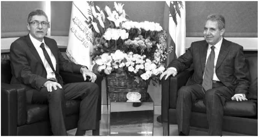
وزني مستقبلاً جدد

البيان الآتي: «تداول بعض وسائل الإعلام خبراً مفاده أن وزير المال غازي وزني أرسل إلى مجلس النواب فذلقة جديدة لموازنة عام ٢٠٢٠ تحضيراً للجلسات المناقشة. يهم المكتب الإعلامي للوزير وزني أن ينفي هذا الخبر جملة وتفصيلاً، ويتمنى على وسائل الإعلام التأكد من الأخبار قبل نشرها».