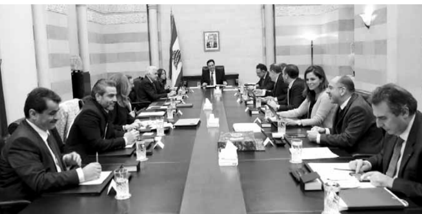
دياب يترأس الاجتماع الثالث للجنة الوزارية المكلفة صياغة البيان الوزاري

أضافت: «نحن الان في طور وضع المسودة الاولى للبيان الوزاري والتي تتعلق بعدة مواضيع اقتصادية وغيرها، وهي من المؤكد أنها من اولويات عمل الحكومة، وتباعاً سنستكمل مناقشة مختلف البنود، ولكننا في طور إنجاز المسودة الاولى». وعمّا اذا كان بيان الحكومة سيختلف عن بيانات الحكومات السابقة في المواضيع السياسية الشائكة، أشارت الى أننا