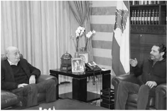
جنبلات يزور الحريري

أشار رئيس الحزب التقدمي الاشتراكي النائب السابق وليد جنبلاط بعد لقائه رئيس حكومة تصريف الأعمال سعد الحريري مساء أمس في «بيت الوسط»، الى انه «علينا التفكير بهدوء بعيداً عن الانفعال والعواطف، ونعود فيه الى الماضي الذي كنا وسنبقى في هذا البيت، ونحن على مشارف ١٤ شباط نتذكر ذلك اليوم الأسود، واليوم