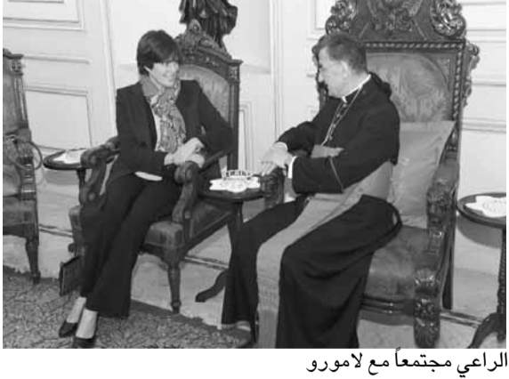
الراعي مجتمعاً مع لامورو

استقبل الطيريك الكنديانيل مار بشارطة بطرس الراعي، بعد ظهر أمس، في الصرح الطيريك في بكركي، سفيرة كندا في لبنان ايمانويل لامورو، التي قالت بعد اللقاء: «عرضت مع غبطته للأوضاع العامة في البلاد ونفت غبطته صحة ما تم تداوله عن أن كندا تعتمد برنامجاً خاصاً لهجرة المسيحيين من لبنان، واكدت له ان كندا لم تغيّر سياستها المتعلقة بموضوع الهجرة».