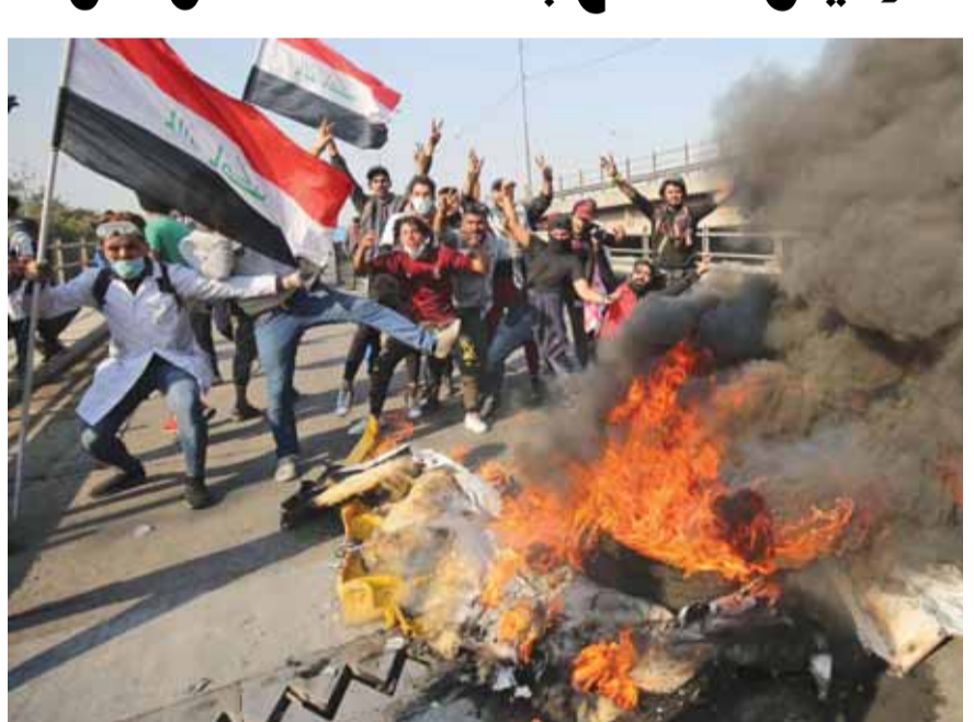
احتجاجات في العراق

قتل متظاهران اثنان، واصيب ٥٠ في عمليات كرفر مع قوات الأمن من أجل قطع الطرق في بغداد، مع انتهاء المهلة التي حددها للسلطات لتنفيذ إصلاحات بطالبون بها منذ أكثر من ثلاثة أشهر. وكانت قوات الأمن قد طاردت المتظاهرين في الشوارع التجارية القريب من ساحة التظاهر وسط المدينة، خلال محاولتهم إغلاق الشارع وشوارع أخرى في المدينة. وتمكن المتظاهرين، بالرغم من ذلك من إغلاق شارع الأندلس الذي يتقاطع مع الشارع التجاري، وسط انتشار كثيف للقوات الامنية التي أطلقت النار على المتظاهرين. كما قتل عنصري أمن إثر دهس سيارة مجهولة لهما خلال المصادمات في تقاطع شارع الأندلس والتجاري. وأعلنت قيادة عمليات بغداد في بيان تلقت «بي بي سي» نسخة منه «فتح كل الطرق في بغداد، التي حاولت المجاميع العنيفة إغلاقها».