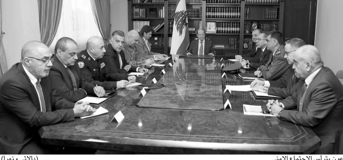
عون يترأس الاجتماع الأمني

مصادر قصر بعبدا افادت بأنه جرى خلال الاجتماع الأمني عرض شامل للتقارير الأمنية والعسكرية التي اعدتها جميع الأجهزة الأمنية