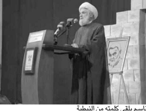
قاسم يلقي كلمته من النبيلة