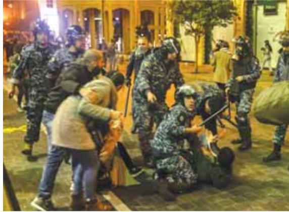
قوى الامن تنهال بالضرب على احد المتظاهرين