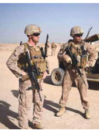
الجيش الاميركي في العراق

الأميركيون لاحقاً أنهم مخطئون». وأضاف موسوي أن طهران تترك أن أسهل عمل بالنسبة للولايات المتحدة الأميركية هو توجيه اتهامات لها. ولفت موسوي إلى أن تقرير الأمين العام للأمم المتحدة بشأن هجوم أرامكو أثبت أنه لم يكن لإيران أي دور فيه، لكن واشنطن وجهت الاتهام لطهران منذ الساعات الأولى... تأمل أن يتقبل الأميركيون العار الذي سيلحق بهم بشأن الهجمات في العراق على