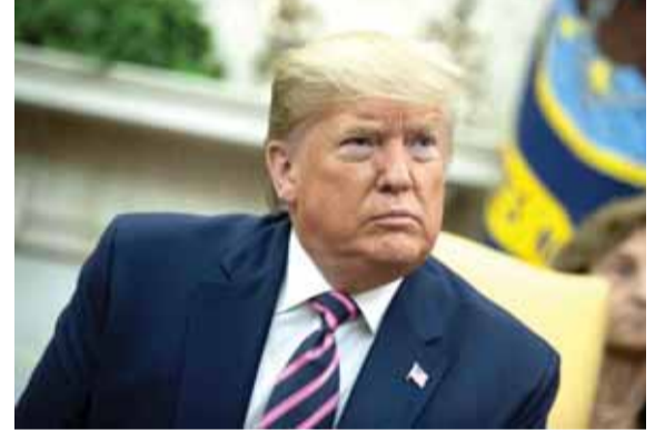
الرئيس الاميركي ترامب

اعتبر الرئيس الأميركي، دونالد ترامب، أن المشرعين الديموقراطيين «يبتذلون» عملية العزل من خلال الحملة التي يشنونها ضده، محذراً إياهم من انتقام الجمهوريين منهم لهذا «الاحتفال» مستقبلاً. وأكد ترامب، في تصريح صحفي أدلى به خلال لقاء مع نظيره من الباراغواي، ماريو عبده بنيتيس، أنه لا يعارض عملية قضائية طويلة الأمد حول عزله، وقال في هذا السياق: «لا أعرض عملية طويلة الأمد لأنني أريد أن أرى المسرب الذي يعد محتالاً، يروق لي سواء العملية الطويلة أو القصيرة». وأضاف ترامب: «كل هذا احتيال ويجب منع حدوث ذلك، لأن هذا الأمر سيؤذي جداً بالنسبة إلى بلدنا. الحديث يدور عن ابتذال عملية العزل». وتابع مهزداً: «أريد أن أقول لكم إنه في يوم ما، سيتولى رئيس ديمقراطي هذا المقعد عندما ستكون الأغلبية في مجلس النواب لدى الجمهوريين، ويبدو لي أنهم سيستذكرون هذه الأحداث». وسادت اللجنة القضائية لمجلس النواب الأميركي، في وقت سابق، على مادتين من لأحة الاتهام بحق سيد البيت الأبيض في إطار التحقيق بشأن مسألة عزله. وتشمل المادة الأولى إساءة استخدام السلطة، بينما تتعلق المادة الثانية بعرقلة تحقيق مجلس النواب. ومن المتوقع أن يتم بعد ذلك طرح هاتين المادتين للتصويت في مجلس النواب بتشكيلته الكاملة، يوم الأربعاء المقبل، ليقرر ما إذا يجب المصادقة على إعلان عزل الرئيس الأميركي. واعتبر الرئيس الأميركي أن الديموقراطيين أطلقوا عملية العزل من أجل الحصول على ميزات سياسية، لكنه شدّد مع ذلك على أن مستوى شعبيته تتجاوز كل الحدود قبيل انتخابات الرئاسة عام ٢٠٢٠.