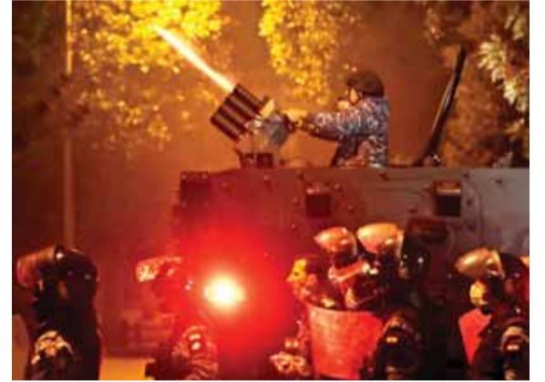
عنصر من قوى مكافحة الشعب يرمي المتظاهرين بقنابل مسيلة للدموع