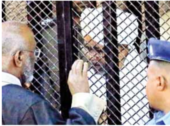
الرئيس المعزول عمر البشير خلف القضبان

أصدرت محكمة جنابات الخرطوم، امس، حكماً بالتحفظ على الرئيس المعزول عمر البشير لمدة عامين في الإصلاح الاجتماعي وبمصادره أمواله. وأوضح القاضي في أثناء التصريح بالحكم أن الحكم بإيداع البشير في الإصلاح الاجتماعي لمدة عامين إلى حين اكتمال البلاغات في مواجهته، لأن الأخير عمره تجاوز السبعين سنة ولا يمكن إيداعه السجن، بحسب القانون السوداني. من جانبها اعتبرت هيئة الدفاع عن البشير أن المحكمة مسيسة وشككت في ظروف المحاكمة. وتعتبر قضية الفساد المالي، التي حكمت فيها المحكمة اليوم واحدة من عدة قضايا أخرى، تتعلق بجرائم في دارفور ومناطق سودانية أخرى. واستمعت المحكمة في العاصمة الخرطوم للشهادات الختامية في القضية، يوم ١٦ تشرين الثاني الماضي، بما في ذلك شهادة المراجع العام للحكومة. وبدأت محاكمة البشير في ١٩ آب الماضي، بعد يومين من توقيع اتفاق تاريخي بين المجلس العسكري وقادة الحركة الاحتجاجية، لتقاسم السلطة خلال الفترة الانتقالية. وبعد الإطاحة به نُقل البشير إلى سجن كوبر الشديد الحراسة في الخرطوم، حيث كان يحتجز في عهده آلاف السجناء السياسيين.