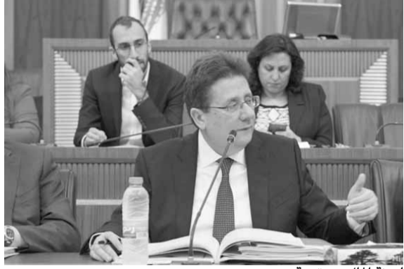
لجنة المال مجتمعة

وقالت الوكالة إن إنتاج أوبك+ ينجم أيضاً لتجاوز الطلب المتوقع على نط المجموعة بمقدار ٧٠٠ ألف برميل يومياً في النصف الأول من العام القادم وبمقدار مليون برميل يومياً في النصف الثاني.