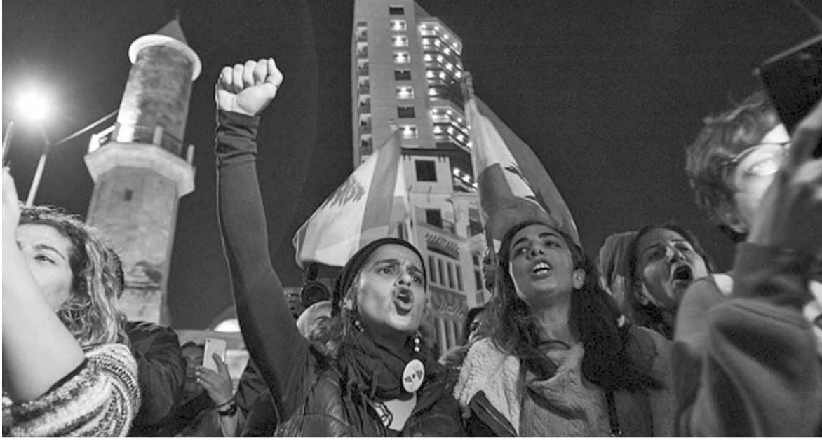
عبر دعم القطاعين الأولي والثانوي.

إن أي محاولة للقيام بإقنطاع من ودائع المودعين، تحرير صرف الليرة، أو إعادة هيكلة الدين العام، تدخل في نطاق الضربة القاضية على المواطن إذا لم يكن هناك من تقييم فعلي لموجودات الدولة والمستحقات عليها وتقدير الحاجة الفعلية للأموال. كذلك نرى أن الترويج لإجراءات موجعة بحق المواطن اللبناني، تدخل في باب التواطؤ على لبنان ومواطنيه.