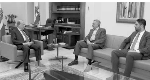
عون مجتمعاً مع أرسلان والغريب

على الصعيد الدبلوماسي، استقبل الرئيس عون سفير اليونان فرنسيسكو فيروس، في زيارة وداعية بمناسبة انتهاء مهمته الدبلوماسية في لبنان. وقد شكر الرئيس عون السفير اليوناني على الجهود التي بذلها خلال وجوده في لبنان لتطوير العلاقات اللبنانية - اليونانية، متمنياً له التوفيق في مهمته الجديدة.