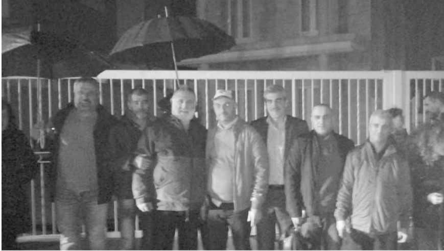
خلال الوقفة التضامنية