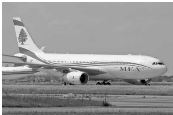
الخسارة ستعكس على العمال

الكثير من حقوقنا، وليعلم الجميع أننا لن نسمح مطلقاً بالرجوع إلى تلك الأيام.