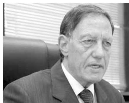
عبد الملك يتحدث

عقدت هيئة الإشراف على الإنتخابات جلسة برئاسة القاضي نديم عبد الملك وحضور أعضائها وأصدرت بيانا اشارت فيه الى ان «بعض الجهات دأبت على استغلال الأوضاع الحالية السائدة في البلاد والتحركت الشعبية لتوجيه أصابع الاتهام إلى هيئة الإشراف على الإنتخابات في محاولة غير بريئة لتسويه سمعتها والإساءة إلى الدور الرقابي الذي تقوم به سواء في الإشراف على الإنتخابات العامة أو الإنتخابات الفرعية مركزة على الإنتخابات الفرعية في صور، وإدراج الإعتمادات المحوطة لها والبالغة ٦٧٠ مليون ليرة، وكانها لتغطية تعويضات أعضاء الهيئة عن هذه الإنتخابات فقط. في حين أنها تتعلق بتغطية كامل النفقات والأعباء منذ تاريخ ٢٠١٨/١١/٦ وتشمل بدل إيجار المكتب الذي تشغله الهيئة عن سنة كاملة، ونفقات الجهاز الإداري ونفقات الأعمال المكتبية والتشغيلية والنثرية وأعمال الصيانة ورواتب الموظفين وإيجار المبنى، بما في ذلك النفقات المترتبة على الإنتخابات الفرعية في طرابلس وصور».