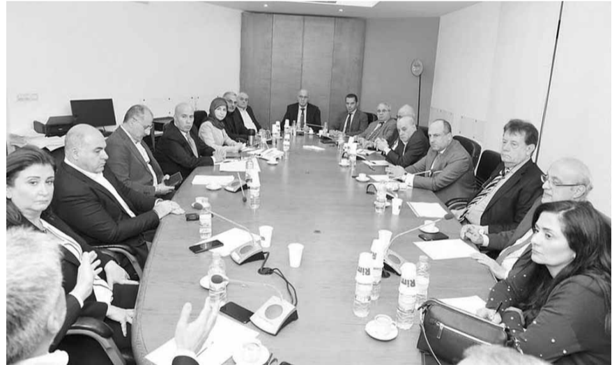
اجتماع لجنة الصحية النيابية

ولماذا لا يستطع حاكم مصرف لبنان ان يأتي؟ قال: «لديه ارتباطات، نحن نريد أموراً سريعة، وليس معنى ذلك انه لا يريد ان يأتي، ربما لديه ارتباطات، نحن نريد ان نذهب اليه هناك لتسريع الامور. واقول ان الامن الصحي اهم من اي امر اخر».