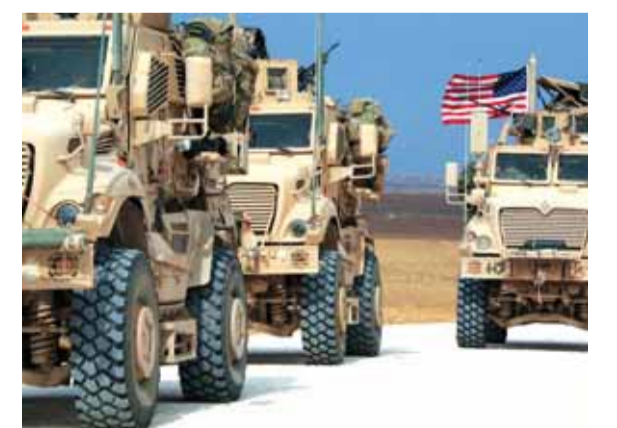
انتشار عسكري للجيش الاميركي في دير الزور

أعلن الرئيس الأميركي، دونالد ترامب، امس، أن الولايات المتحدة وضعت النفط في سوريا تحت سيطرتها وبات بمقدورها التصرف به كما تشاء. وبعد لقاء جمعه مع الأمين العام للناو، ينس ستولتنبرغ، في لندن، على أبواب افتتاح أعمال قمة حلف شمال الأطلسي في العاصمة البريطانية، قال ترامب: «لقد حاول داعش حفظ سيطرته على النفط، أما الآن فاصبحتنا نحن الذين نسيطر عليه