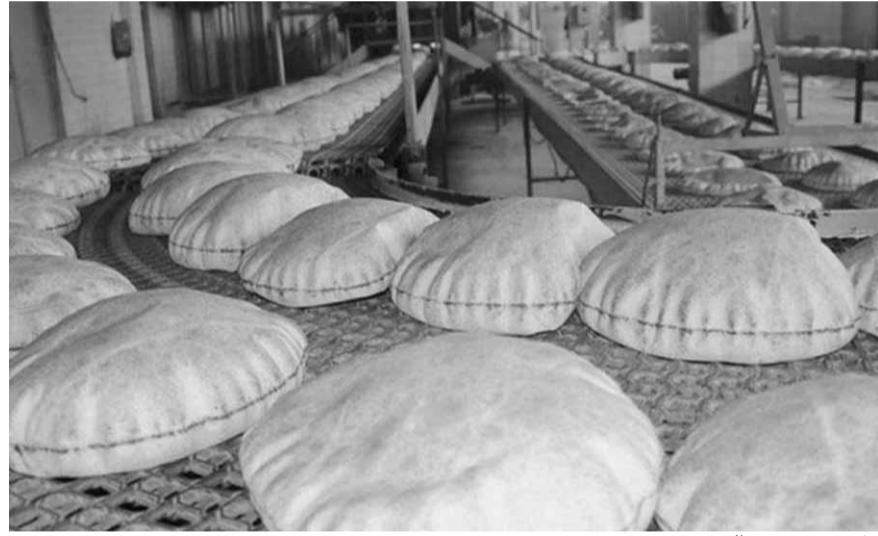
هل يرتفع سعر الرغيف؟

ونفى ابراهيم أن يكون احتجاج أصحاب الأفران بسبب تراجع أرباحهم من دون تكديهم الخسائر، وأكد أن «لو تراجع هامش أرباحنا فقط لكننا صبرنا مدة أطول». علماً أنه تبعاً لدراسة أجرتها مديرية الحبوب بالتعاون مع جهات دولية، تبين أن الأفران تحقق أرباحاً من كل رطل خبز لا تقل عن ٦٥٠