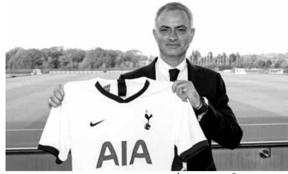
مورينيو مع قميص توتنهام

يحب إشراك اللاعبين الصغار ومساعدة اللاعبين الشباب على التطور.