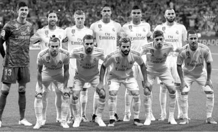
فريق ريال مدريد