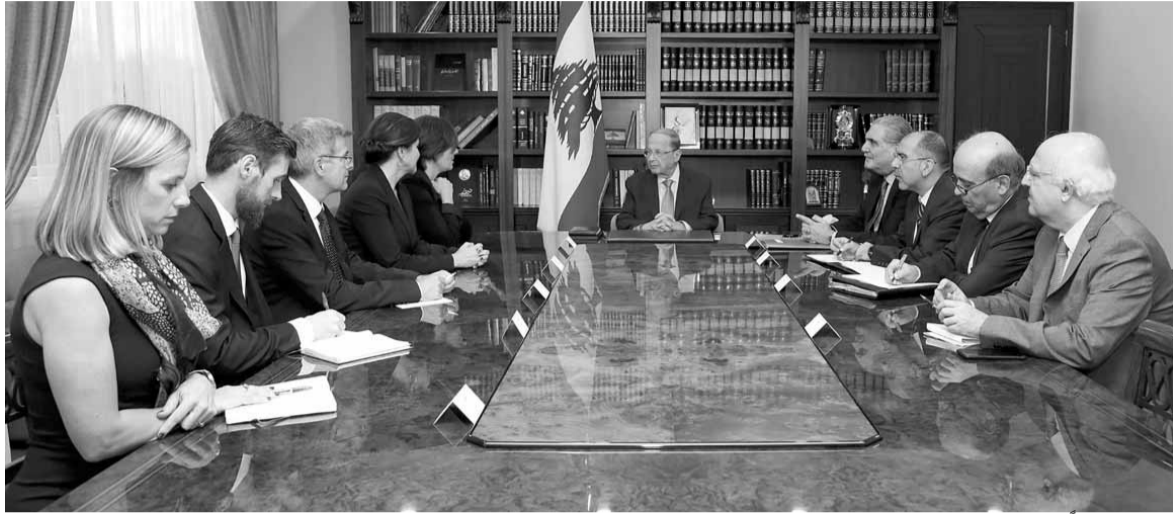
عون مجتمعاً مع سفير كندا والنروج والقائم بأعمال السفارة السويسرية

وفي الإطار نفسه، التقى الرئيس عون وفداً من الهيئات