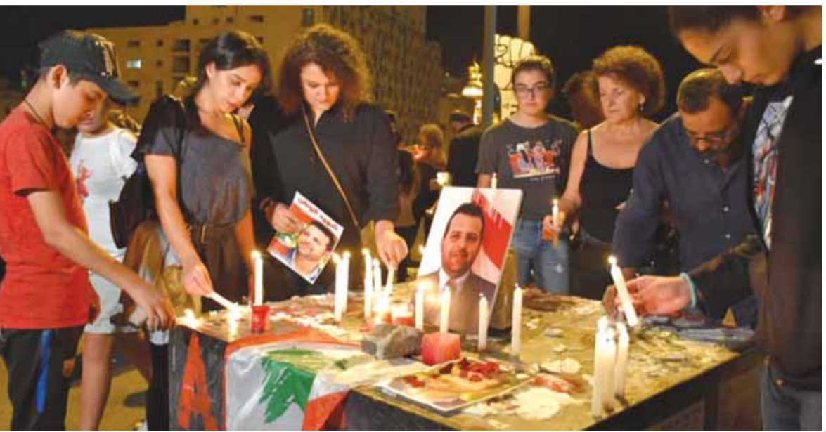
إضاءة الشموع أمام صورة للشهيد علاء أبو فخر في ساحة رياض الصلح