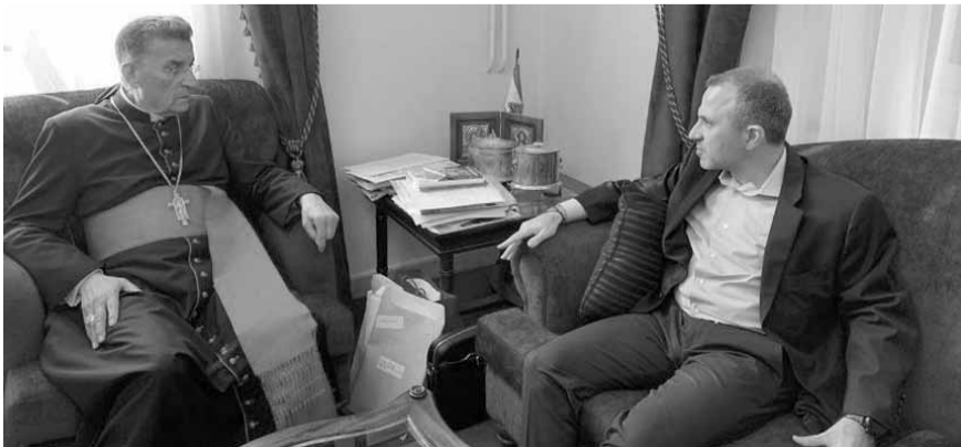
الراعي مجتمعاً مع باسيل

على «تويتري» قائلًا: «الاولوية اليوم لتشكيل حكومة انقاذ ومنع الفكر التخريبي من أخذ البلد الى الصدام. حذار من جدران العزل وتقطيع الأوصال وجر الناس الى الاقتتال. والى التيار الوطني الحر أقول: ممنوع ردة الفعل لأن المؤامرة بدأت تنكشف والناس الطيبون بالحراك وبالبيوت كفيليون بإسقاطها».