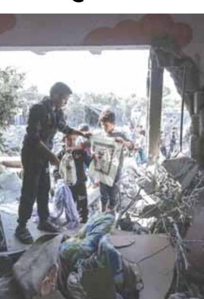
اطفال فلسطينيون يلعبون على انقاض منزلهم

يأتي ذلك بعد استمرار قصف سرايا القدس للمستوطنات والأراضي المحتلة، حيث قصفت تل ابيب والقدس المحتلة بصواريخ «البراق».