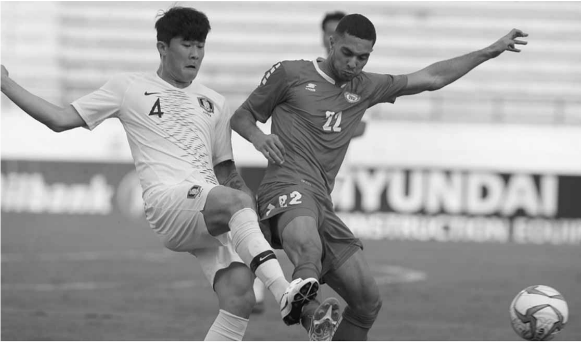
من مباراة لبنان وكوريا الجنوبية