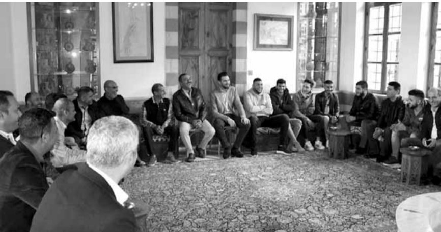
تيمور جنبلاط خلال استقباله الوفود

للحفاظ على الوطن ومن ضمنه منطقة الجبل على وجه الخصوص، وازاء ما يجري في محيطنا من عوامل عدم استقرار لتجنب مخاطر الانزلاق نحو ازمت اصعب. وفي كل الاحوال سنبقى على انحيازنا للمطالب الشعبية الملحة، وعلى المتظاهرين في الوقت نفسه ضرورة لتوحيد هذه المطالب واصغاء السلطة لها وتلبيتها».