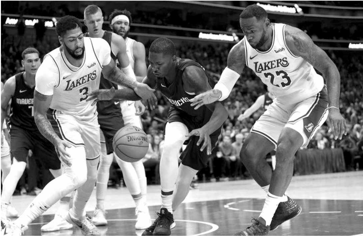
أحد لاعبي دالاس بين لبيرون جيمس وأنطوني ديفيز