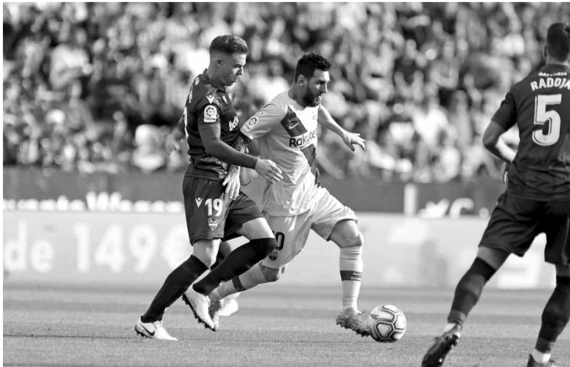
من مباراة ليفانتي وبرشلونة

تعرض برشلونة حامل اللقب لخسارة صامدة ٣-١ أمام مستضيفه ليفانتي في دوري الدرجة الأولى الإسباني لكرة القدم أمس السبت بعد أن أهدر تقدمه واستقبل ثلاثة أهداف في غضون سبع دقائق بالشوط الثاني. وعاد برشلونة للصدارة في الجولة السادسة عندما سحق بلد الوليد ٥-١ بمنتصف الأسبوع وكان في وضع مريح اليوم عندما تقدم ليونيل ميسي بركلة جزاء في الدقيقة ٣٨. وبدأت مشاكل برشلونة عندما خرج لويس سواريز للإصابة بعد الهدف ثم انهار في الشوط الثاني عندما حول ليفانتي أول ثلاث تسديدات له على المرمى إلى أهداف. وتعادل خوسيه كامبانيا في الدقيقة ٦١ بعد هجمة مرتدة سريعة ثم أضاف بورخا مايورال مهاجم ريال مدريد السابق الهدف الثاني في الدقيقة ٦٣ بتسديدة رائعة من خارج منطقة الجزاء. ووسع نيمانيا رادويك الفارق لأصحاب الأرض في الدقيقة ٦٧ بتسديدة مباشرة بعد ركلة حرة. وقلص ميسي الفارق سريعاً ليمنج برشلونة الأمل لكن الغي الهدف لوجود تسلسل على أنطوان جريزمان بعد مراجعة حكم الفيديو.