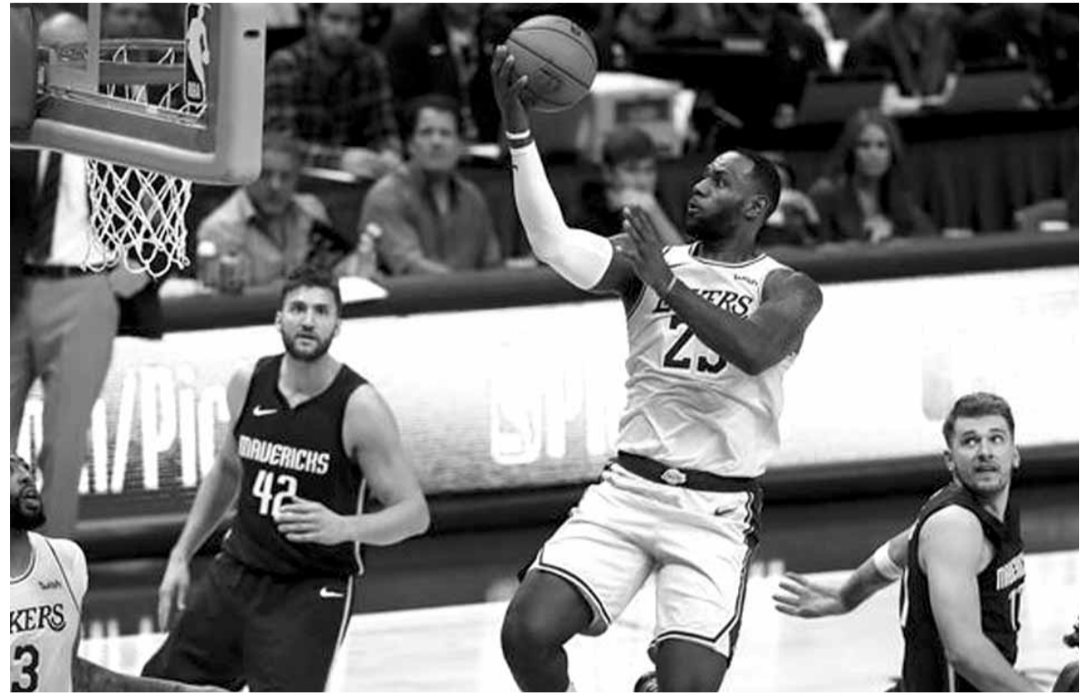
ليبرون جيمس في طريقة نحو سلة دالاس

ضيفه نيويورك نيكس ١٠٤ / ١٠٢ . وبعد أن تلقى الهزيمة في مباراته الأولى بالموسم، حقق سلتيكس الانتصار الرابع على التوالي محتلاً المركز الثالث في مجموعة الغرب، بينما مني نيكس بالهزيمة الخامسة له في الموسم مقابل انتصار واحد. وسجل كيمبا ووكر ٣٣ نقطة لسلتيكس منها ٢٣ نقطة خلال النصف الثاني من المباراة، وأضاف جايسون تاتوم ٢٤ نقطة للفريق. وكان ماركوس موريس أبرز عناصر نيكس خلال المباراة وسجل للفريق ٢٩ نقطة. وفي مباريات أخرى، تغلب ساكرامنتو كينغز على يوتا جاز متصدراً مجموعة الغرب ١٠٢ / ١٠١، وشيكاغو بولز على ديترويت بيستونز ١١٢ / ١٠٦. كما فاز ميلواكي بكس على مضمبه أورلاندو ماجيك ١٢٣ / ٩١ وبروكلين نتس على هيوستون روكيتس ١٢٣ / ١١٦ وإنديانا بيسرز على كليفلاند كافاليرز ١٠٢ / ٩٥.