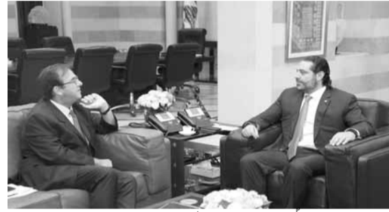
الحريري مجتمعاً مع سفير فرنسا

استقبل رئيس الحكومة سعد الحريري في السراي الحكومي السفير الفرنسي في لبنان برونو فوشيه، في حضور الوزير السابق الدكتور غطاس خوري وعرض معه مجمل التطورات والأوضاع العامة.