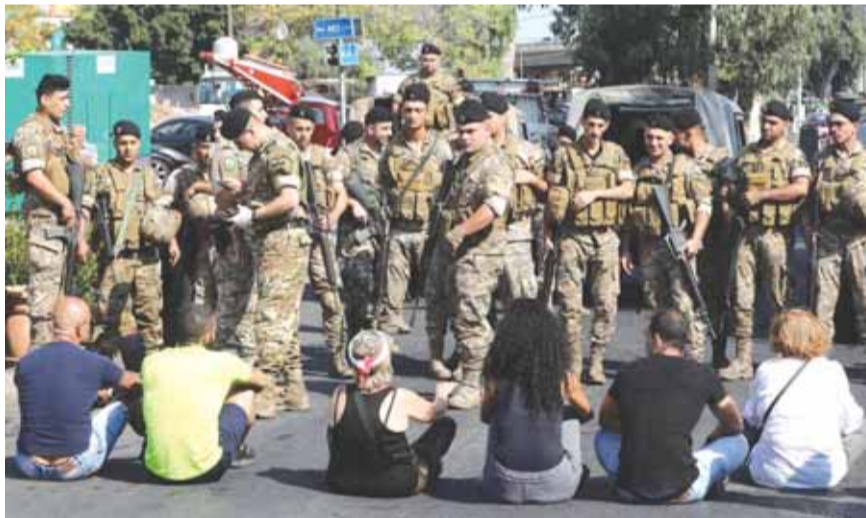
المتظاهرون يفترشون الارض امام المصرف المركزي

يوصل عشرات اللبنانيين احتجاجاتهم امام مصرف لبنان في العاصمة بيروت، مرددين هتافات منددة بالسياسة المالية، فيما استقدمت قوى الأمن تعزيزات الى المكان.