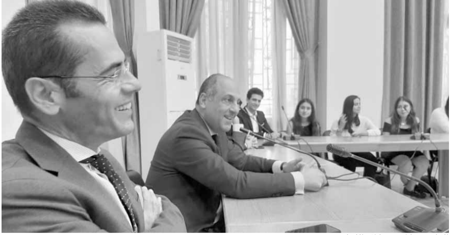
النائب علامه خلال اللقاء

العمل الخيري الذي تقوم به بعض الشركات والمؤسسات والمسؤولية الاجتماعية. وأعطى مآلاً ذلك أن «هناك فقط أربعة مصارف في لبنان لديها أقسام خاصة تعنى بمفهوم المسؤولية الاجتماعية، فيما البقية لا تزال تربطه باقسام التسويق». وأكد «أهمية أن تقوم الهيئات والجمعيات والمؤسسات الاقتصادية اللبنانية ومنها الهيئات الاقتصادية وجمعية الصناعيين والتجار والمؤسسات المصرفية وغيرها وصولاً الى الأفراد كرجال الأعمال بالعمل على تكريس مفهوم المسؤولية الاجتماعية للشركات والمؤسسات ولا أعتبر نشر ثقافته وتأييده بقوته انطلاقاً من أنّ ما هو خير للمجتمع هو حكماً خير للشركات»، مؤكداً أيضاً «العمل والسعي على خطين متوازيين داخل مجلس النواب من أجل صوغ اقتراح قانون لتفعيل المسؤولية الاجتماعية للشركات، وايضاً عبر عضويته في المجلس الاقتصادي والاجتماعي».