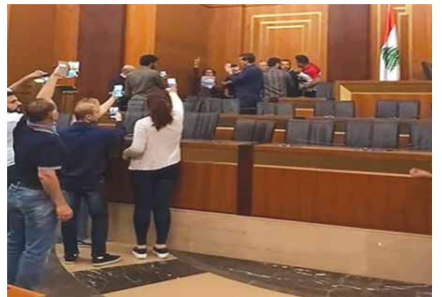
خلال اقتحام مجلس النواب من حزب السبعة