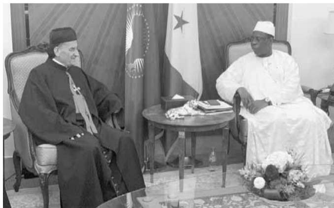
الرئيس السنغالي مستقبلاً البطريك الراعي

توجه البطريك الماروني الكاردينال مار بشارة بطرس الراعي، فور وصوله الى العاصمة السنغالية دكار مساء امس الجمعة الى القصر الجمهوري، حيث التقى رئيس الجمهورية السنغالي ماكي سال، وكان عرض للعلاقات المشتركة والأوضاع العامة.