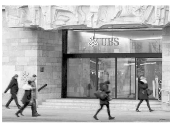
في المائة، وهو مستوى أعلى بكثير من مستويات المجموعات المصرفية الأخرى.