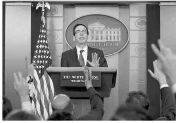
في المائة من ستة مليارات يورو (٦,٦ مليار دولار) من الاتحاد الأوروبي نص عليها الاتفاق.

أكد ستيفن مونتهين، وزير الخزانة الأميركي أمس، أن الرئيس دونالد ترامب فوض مسؤولين أميركيين بصياغة مسودة لعقوبات جديدة كبيرة جداً على تركيا بعد أن شنت هجوماً في شمال شرق سورية، ولكنه أضاف أن تلك العقوبات لن تطبق في الوقت الراهن.