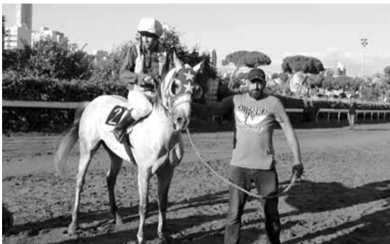
شبل: ان صدقت النيات الحسنة والقيادة العصامية... افوزته مؤكدا.