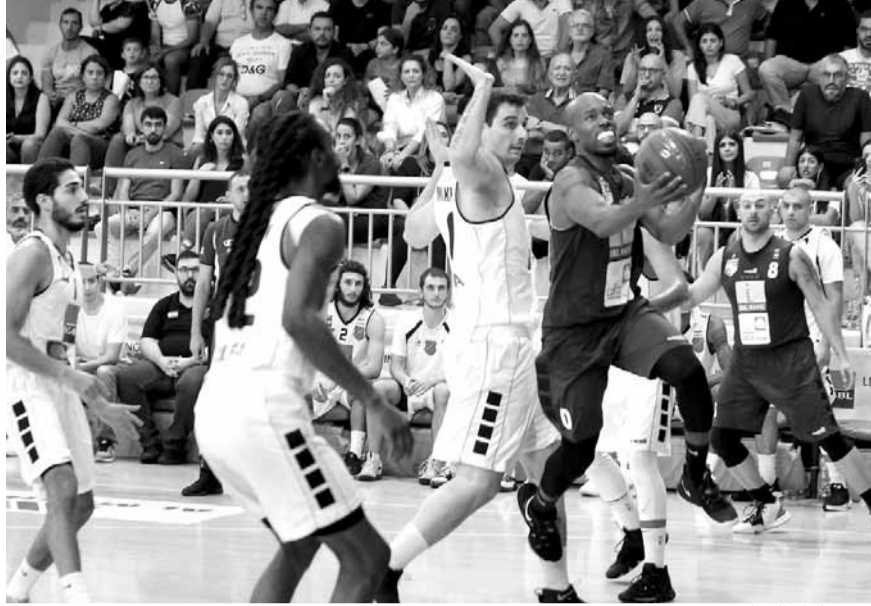
من مباراة الشانفيل وهومنتنم

حقق نادي الشانفيل (ديك المحدي) فوزاً مثيراً على هومنتنم (بيروت) بنتيجة (٩١-٨٩) وبفارق نقطتين على ملعب مزهر في افتتاح المرحلة الثالثة من «دوري الفا» لكرة السلة في المباراة التي جرت عصر أمس السبت.