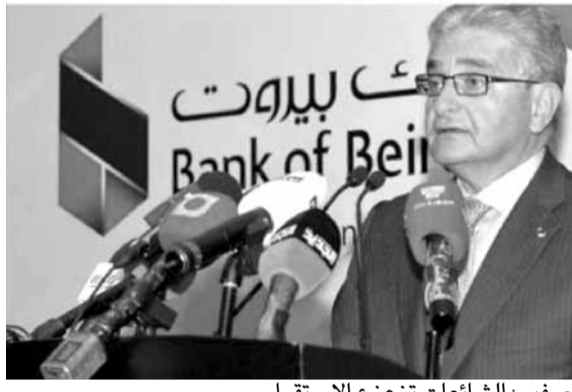
صفيح: الشائعات تززع الاستقرار

أما بخصوص النفايات المنزلية والمكبات العشوائية في الجنوب، قال جريصاتي: «بعدها تواصلنا مع حركة أمل وحزب الله نقول أننا انتقلنا من مرحلة القرار السياسي إلى مرحلة العمل الفعلي على الأرض كي