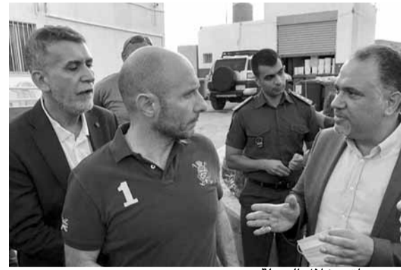
جريصاتي خلال الجولة

نحصول هذه المواقع والمكبات إلى مطامر صحية»، مشيراً الى انه «اتفق أخيراً مع رئيس الحكومة على إدراج موضوع معالجة النفايات والمكبات في برنامج سيدر». وأضاف: «خلال أسبوعين سنزور ألمانيا حيث أبدت الحكومة الألمانية استعدادها مساعدتنا في هذا الموضوع، وبخاصة ان امكاناتنا المادية كدولة لبنانية ضعيفة لذلك سنحاول مع الدول المانحة وفي مقدمها ألمانيا معالجة المكبات العشوائية».