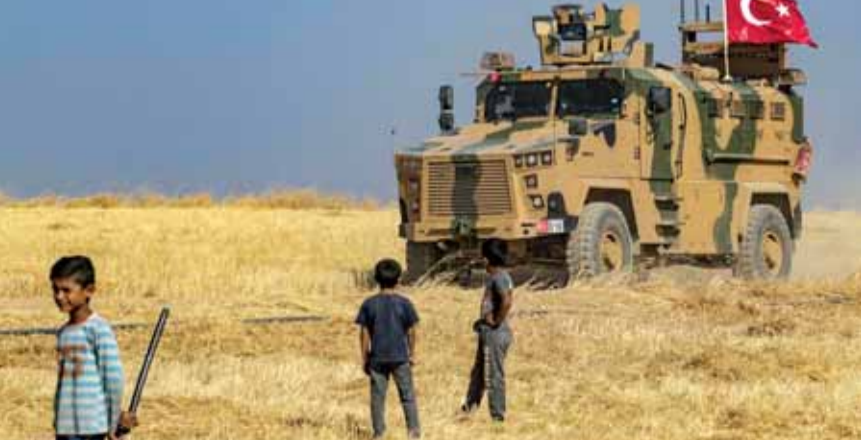
القوات التركية داخل المناطق السورية

حذرت قوات سوريا الديمقراطية «قسد»، التي تسيطر على مناطق واسعة شمال شرقي سوريا، من «حرب شاملة» إن نفذ الرئيس التركي رجب طيب أردوغان تهديده بعملية عسكرية شرقية الفرات في سوريا.