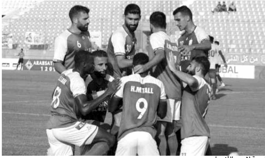
فرحة لاعبي الأنصار

اقتنص الأنصار مريحاً، على حساب الصفاء بنتيجة (٤-١)، في المباراة التي جرت أمس السبت، على ملعب رشيد كرامي في طرابلس، ضمن الجولة الثالثة من منافسات الدوري اللبناني.