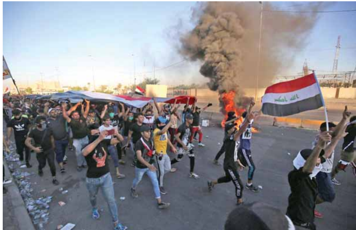
التحركات الشعبية في العراق

وفصائل عراقية تدعم الدولة السورية وتشكل الشريان الحيوي لسوريا مع فتح معبر البوكمال على الحدود السورية العراقية. فهل الازمة في العراق مفتوحة في ظل حجم الفساد الكبير والدور الأميركي والسعودي والإيراني في هذا البلد؟ اما ان الامور تنتهي باستقالة الحكومة واجراء انتخابات جديدة باشراف اممي وهذا امر مستحيل ويفتح الباب للتدخلات الدولية، علماً ان اجراء انتخابات عراقية خضع لنقاشات استمرت لسنوات، كما ان تاليف الحكومة اخذ وقتاً طويلاً. وفي ظل هذه التطورات ايضاً ماذا سيكون موقف المرجعية الدينية وهي الاقوى تأثيراً في العراق وهل تستطيع الحكومة ضبط الاوضاع وهذا امر مستحيل في ظل الفساد والفوضى والبطالة وفقدان الخدمات ومقومات العيش الكريم للشعب العراقي. وقد تواصلت الاحتجاجات رغم كل الاتصالات وارتفع عدد ضحايا امس الى ١٤ قتيلاً و١٠٠ جريح.