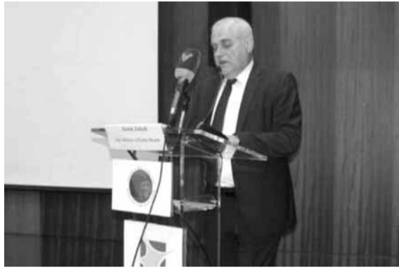
جبق يلقي كلمته خلال المؤتمر الدولي

راهبات المحبة لاني متواضع بمحبة الناس والتخفيف من آلامهم. أهنئكم بهذا المركز واشد على أيديكم وسنكون معا بمسيرة طويلة وساعمل كل ما بوسعي لمستشفيات المتن وأبنائه».