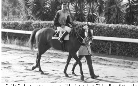
مغانم: نتاجه السابغة تعطيه زخم الفوز بعد عودته من راحة ناعمة.

فانتة: شقراء - فرس جديدة بالميدان - ابوها مجدنا هي - امها: بسوس وليس بمستغرب بان تعمل شي نكبة... او قلنته لكم!