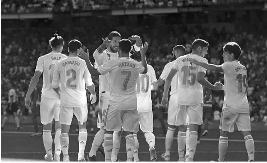
فرحة لاعبي ريال مدريد

فك البلجيكي ادين هازار نحسه مع التسجيل وقاد ريال مدريد إلى فـرملة الانطلاقة الصاروخية لضيفه غرناطة بفوز صعب ٤-٢، أمس السبت في المرحلة الخامسة من الدوري الإسباني لكرة القدم.