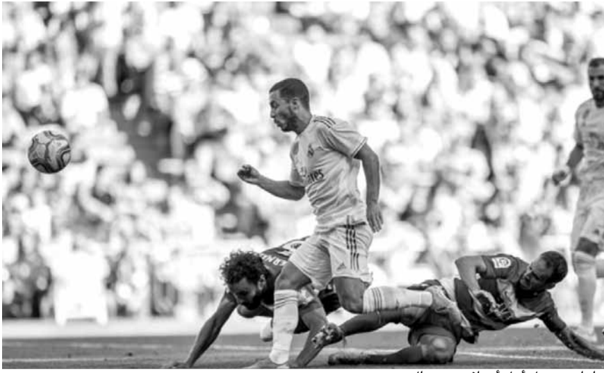
هازار يسجل أول أهدافه مع ريال مدريد