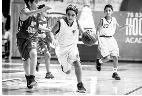
لقطة من إحدى المباريات