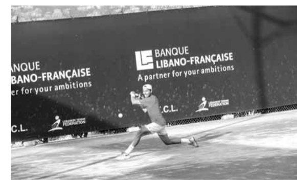
الكرواتي ماتيا بيكوتيتش