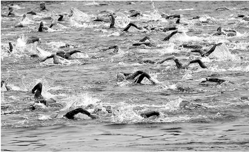
من إحدى مسابقات السباحة ضمن مسابقة الترياتلون

تنظم الاتحاد اللبناني للترياتلون بطولة لبنان غداً الأحد لمختلف الفئات العمرية في منطقة المنارة-النادي العسكري المركزي - بيروت في المسافات التالية: - المسافة السريعة أو السبرنت ٧٥٠٠ م سباحة ٢٠٠، كلم دراجة وهكلم ركض من سن العشرين سنة وما فوق. - مسافة السوبر سبرنت: ٤٠٠٠ م سباحة ١٠ كلم دراجة و ٢,٥ كلم ركض من سن التاسعة عشرة وما دون. وتقام مسابقة السباحة اعتباراً من الساعة السابعة صباحاً في النادي العسكري ويعدها مباشرة ينطلق سباق الدراجات يليه سباق الرض على المسك التالي: الحمام العسكري - عين المريسة - فندق فينيسيا - فندق السان جورج - الحمام العسكري. للراغبين في المشاركة في هذه البطولة الاتصال بالاتحاد اللبناني للترياتلون عبر البريد الإلكتروني التالي: lebanesetriathlon@hotmail.com او الاتصال ٠٧-٢٦٨٢٥٢٨٢