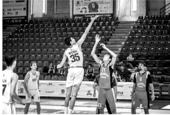
صراع تحت السلة

بدعم من بلدية الجديدة البوشرية - السد وإدارة مجمع ميشال المر الرياضي، انطلقت منافسات النسخة السابعة «لدورة انطوان غريب في كرة السلة للفئات العمرية» من تنظيم «سبورتس مانيا» وتحت إشراف الاتحاد اللبناني لكرة السلة وبمشاركة ٣٠ نادياً وأكثر من ١٢٠٠ لاعباً. وباتت هذه الدورة محطة سنوية لتشجيع كرة السلة اللبنانية وحض الشباب اللبناني أكثر وأكثر على ممارسة الرياضة على حساب كثير من الأوقات التي تصيب مجتمعا.