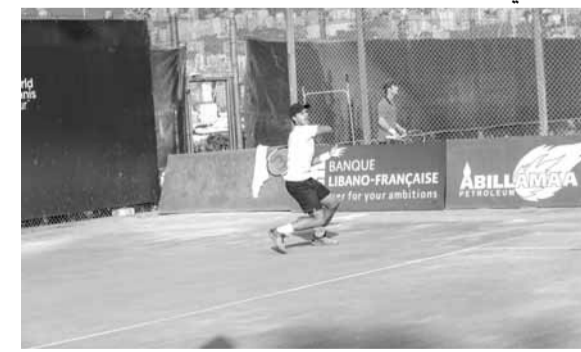
السويدي جوناثان مريدها

انحصر لقب الدورة الدولية الثانية للرجال للتنس التي ينظمها النادي اللبناني للسيارات والسياحة على ملاعبه في الكسليك تحت إشراف الاتحادين الدولي واللبناني للعبة والتي تبلغ جوائزها المالية ٢٥ ألف دولار اميركي بين الفرنسي ماكسيم سزال (المصنف رقم ٣) ومواطنه جوناثان ايسيريك والكرواتي ماتيا بيكوتيتش والسويدي جوناثان مريدها. ولم يصمد في دور الأربعة سوى مصنف واحد بعدما تهاوى المصنفون الواحد تلو الآخر. والبارز أمس الجمعة خروج المغربي آدم موندبر (٥-٧). وافتتحت أمس الجمعة أربع مباريات في إطار الدور ربع النهائي جاءت نتيجتها كالآتي: فاز الكرواتي ماتيا بيكوتيتش على المغربي آدم موندبر (٦-٣) (٦-٧) والسويدي جوناثان مريدها على الليتواني لوريناس غريغيليس (٦-٣) (٦-٦) (٤) والفرنسي ماكسيم سزال (المصنف رقم ٣) على الروسي يان بونداريفسكي (٦-١) (٦-١) والفرنسي جوناثان ايسيريك على مواطنه كليمان تابور (٦-٣) (٥-٧).