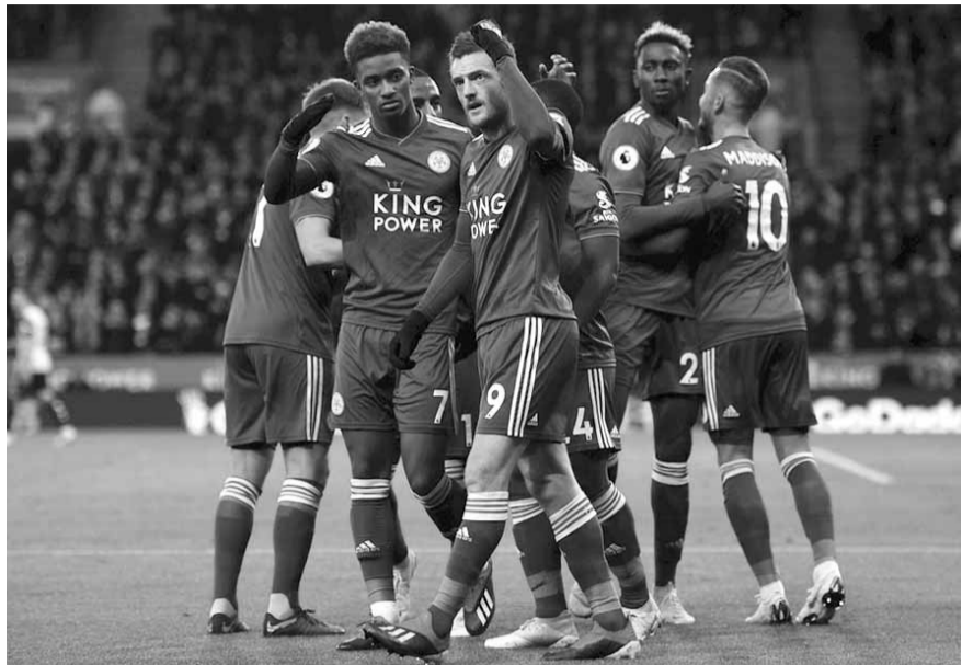
لاعب ليستر سيتي بمواجهة ليفربول اليوم