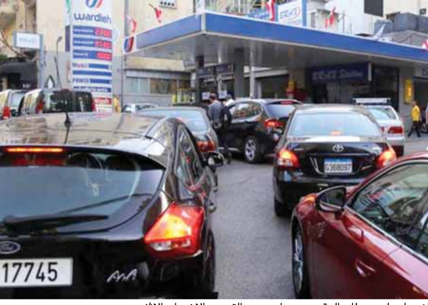
ازدحام على محطات الوقود عصر امس بعد التهديد بالاضراب الاثنين

كتب محمد بلوط يبدو أن الاسبوع المقبل مرشح ان يشهد مرة أخرى عودة الاحتكام الى الشارع والاضراب والتظاهر في ظل مراوحة المساعي لمعالجة فورية تخفف من وطأة أزمة الدولار التي اندلعت في الاسابيع الاخيرة. وحسب المعلومات المتوافرة فان هناك محاولات من ناشطين عبر وسائل التواصل الاجتماعي لاستئناف التحويلات والتظاهر مع مطلع الاسبوع، بينما يحاول البعض تنفيذ اعتصامات وللجوء الى الشارع في الساعات المقبلة. ويتوافق ذلك مع اعلان اصحاب محطات الوقود وموزعي المحروقات الاضراب المفتوح اعتباراً من بعد غد الاثنين اذا لم يحصل تطور ايجابي بشأن مطلبهم المتعلق بشراء هذه المادة بالليرة. وتحدثت معلومات أيضاً عن تلويح بالتحرك السلبي لقطاعات اخرى مثل الافران بسبب أزمة الدولار، واعلنت الهيئات الاقتصادية أيضاً انها سلتجا لخطوات تصعيدية تدريجية محذرة من اللجوء الى فرض ضرائب جديدة، ومؤيدة الاضراب الرمزي للتجار بالتوقف عن العمل لمدة ساعة يوم الخميس في ١٠ الجاري. وبقي سعر صرف الدولار في سوق الصيرفة مرتفعاً عن السعر الرسمي، فيما لوحث نقابة الصيرافة بالتوقف عن العمل احتجاجاً على ملاحقة عدد من الصيرافة، معتبرة انها تعمل وفق القانون وتعاميم مصرف لبنان. في المقابل لم تظهر اشارات ايجابية توجي بمعالجة أو حل هذه الأزمة، فيما اكدت مراجع مسؤولة ان التركيز هو على الاسراع في اقرار الموازنة وإحالتها الى مجلس النواب وكذلك اقرار مشاريع القوانين الاصلاحية التي تعيد الثقة بلبنان وباقتصاده ووضعه المالي. وقال مصدر وزاري ان هناك نقاشاً مستمراً لاقرار الموازنة بسرعة وإحالتها الى المجلس النيابي في الموعد الدستوري اي قبل ١٥ تشرين الاول الجاري. وحول اسباب تأخرها في مجلس الوزراء رغم