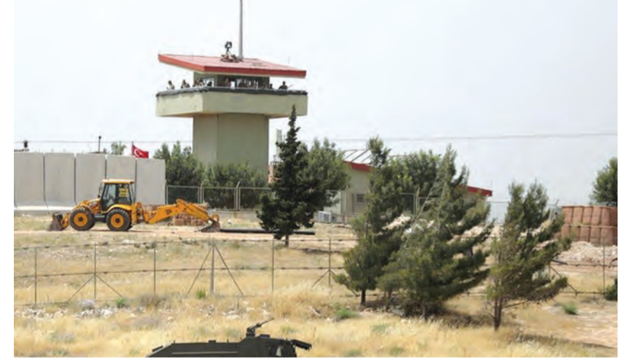
تعزيرات تركية على الحدود السورية

شاحنة الى مسلحي «قوات سوريا الديمقراطية» المدعومة امريكياً، فيما ارسلت تركيا تعزيرات عسكرية جديدة الى الحدود مع سوريا. وكان الجيش السوري تمكن من التقدم