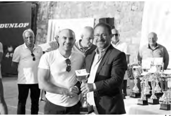
كأس من عبود