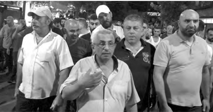
شباب صيدا يزيلون النفايات من الشوارع

عن النية للبدء بجمع النفايات من الشوارع والإحياء صباح الغد، إضافة إلى الإعلان عن إعادة فتح المعمل. وقد عبر الشباب عن عدم الثقة بوعود المسؤولين، وأكدوا على تصميمهم على رفع النفايات هذه الليلة. وقد سار عشرات الشباب من أعضاء التنظيم متوجهين نحو أكوام النفايات المكدسة في الشوارع من أجل إزالتها رفعا للضجر عن الناس.