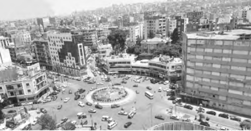
الفرص الاستثمارية في طرابلس

وما علينا إلا الخروج بمشروع استثماري كبير نبتلنا من المحلية والتفوقع الى رحاب العالمية. لا سيما أن لدينا أكبر منظومة استثمارية اقتصادية تمتد على طول واجهة بحرية تنطلق من ميناء طرابلس وتصل الى منطقة القليعات في عكار وتبعد ٦ كيلومترات عن الحدود مع سوريا ونحن نعتبر أنفسنا كجهات متعاونة مجموعة شركاء في أهم إستثمارات على مستوى المنطقة وأصدقائنا الأوروبيين وجيراننا المتوسطيين والعالم الأرحب».