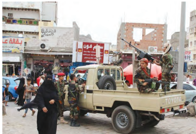
محاصرة منزل وزير الداخلية اليمني