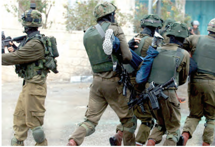
جنود الاحتلال خلال عملية الاعتقال في الضفة

يتحضر ابناء القدس المحتلة والقرى والبلدات الفلسطينية المجاورة ومناطق أخرى للحضور الى المسجد الأقصى صباح اليوم دفاعاً عن المسجد في مواجهة ما يقوم به العدو الاسرائيلي والمستوطنين من استعدادات لاحتحام المسجد اليوم بمناسبة عيد الاضحى، ولذلك اعلنت هيئات اسلامية فلسطينية اغلاق مساجد القدس في اول ايام الاضحى افساحاً في المجال امام المشاركة في حماية الأقصى بمواجهة المستوطنين.