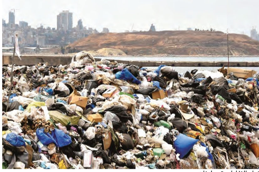
أكوام النفايات تعم لبنان

افتاء زيارة رئيس الحكومة سعد الحريري الى واشنطن ستضغط الإدارة الأميركية على رئيس الوزراء اللبناني الحريري للابتعاد عن دائرة حزب الله سواء حكوميا ام نيابيا ام اداريا، والحريري سيكون له وجهة نظر انه ليس هناك من تنسيق عملي بين رئاسة الحكومة وحزب الله الا وفق العمل الوزاري والرسمي والباري الذي تحتاجه الإدارات اللبنانية الرسمية، وانه لا يمكن تحقيق الاستقرار في لبنان بتصادم رئاسة الحكومة مع حزب الله بل على العكس فان السياسة التي ينتهجها في لبنان وبالتنسيق مع عون ومع بري تؤدي الى تحقيق الاستقرار من خلال اشتراك حزب الله في الوزارة والعمل الإداري والاقتصاد عن كل شيء له علاقة به موقف حزب الله من الصراعات في المنطقة او غيرها.