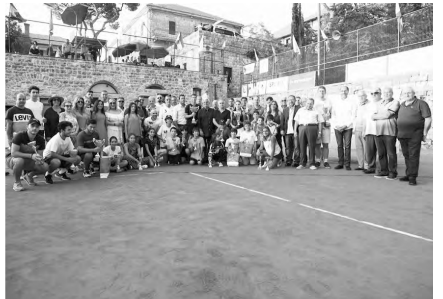
صورة تذكارية لكبار الحضور مع الفائزين والفائزات