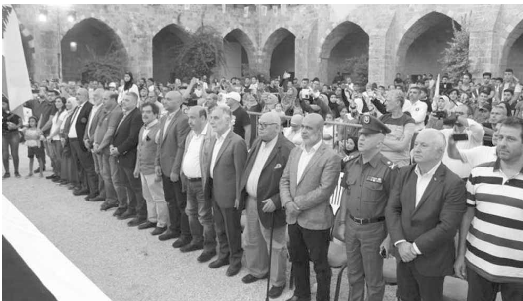
فنيش متقدماً حضور افتتاح البطولة

تقره، وإذا كان هناك من حاجة لتفسير او ايضاح فمجلس الوزراء على استعداد، حسب معرفتي ومعرفه مواقف الكتل، لإزالة هذا اللبس، وبالتالي لا داعي لإستمرار حالة لا الاعتراض ولا القلق ولا التريث، فما كان سابقاً سيستمر ولن يطرأ عليه أي تغيير».