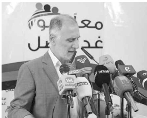
وزير الشباب والرياضة محمد فنيش