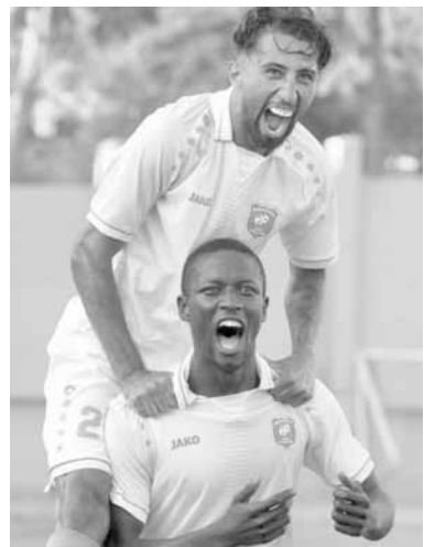
فرحة ساحلية بأحد الأهداف ضد العهد