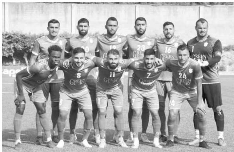
فريق الانصار قبيل مباراته امس