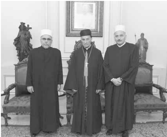
الراعي مع وفد مشيخة العقل

استقبل البطريك الماروني الكاردينال مار بشارة بطرس الراعي في الصرح البطريركي في بكركي قبل ظهر امس، وفداً من مشيخة عقل طائفة الموحدين الدرزيين، ضم: قاضي المذهب الدرزي الشيخ غاندي مكارم ومستشار شيخ العقل الشيخ غسان الحلبي اللذان نقلوا رسالة من شيخ العقل نعيم حسن، وكانت مناسبة تم خلالها التأكيد على الحوار والتواصل بين مكونات المجتمع اللبناني كافة.