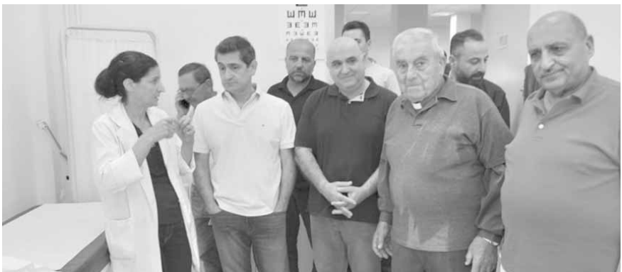
قيومجيان خلال الزيارة

كحراجل، مؤسسات الرعاية كمؤسسات راهبات الصليب والمبرات ودار الرعاية الإسلامية وسواها ساعدت اللبنانيين على تخطي الصعوبات والاستمرار وهي بحاجة لدعم الدولة، مضيفاً أن أرضي طالما أنا وزير الشؤون الاجتماعية وطالما القوات اللبنانية تسلمت هذه الوزارة ان تقفل هذه المؤسسات أبوابها، متمنياً على وزارة المال ورغم الصعوبات المالية، ان نلتزم بتسديد مستحقاتهم في وقتها».