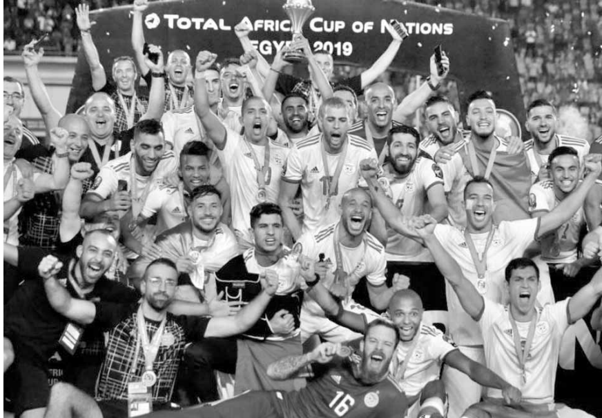
تتويج المنتخب الجزائري زعيما للقرارة الإفريقية

نجم المنتخب الجزائري في فكه شفرة غياب العرب عن منصات التتويج في أمم أفريقيا، منذ فوز منتخب مصر باللقب القاري عام ٢٠١٠، ليعود العرب بعد غياب ٩ سنوات. وفاز المنتخب الجزائري على السنغال بهدف نظيف ليتوج بفناني ألقابه القارية بعد فوزه باللقب الأول عام ١٩٩٠، ليصبح محاربي الصحراء ثاني منتخبات شمال أفريقيا تتوج باللقب بعد منتخب مصر ٧ ألقاب. منتخب مصر كان آخر منتخب عربي توج باللقب عام ٢٠١٠ بانغولا بالفوز على منتخب غانا بهدف نظيف، كما سيطر الفراعة على البطولة القارية في ٢٠٠٦ و٢٠٠٨ و٢٠١٠. وعادت منتخبات شرق وغرب أفريقيا للسيطرة على اللقب بفوز زامبيا بالبطولة عام ٢٠١٢، وبنيجيريا ٢٠١٣، وكوت ديفوار ٢٠١٥، والكاميرون ٢٠١٧. لينتهي المنتخب الجزائري احتكار وتفوق المنتخبات الإفريقية.