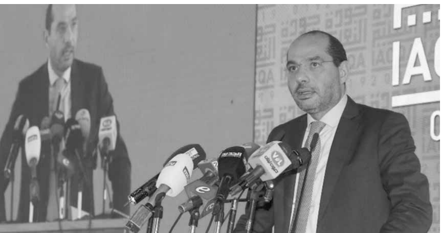
الوزير مراد متحدثاً

أشار وزير الدولة لشؤون التجارة الخارجية حسن مراد، إلى أننا «تلقينا صرخة الناس ولتسمنا وجعهم لهذا لم نعترض على الموازنة، لتسهيل أمورهم لا بسبب الموافقة عليها وفي موازنة العام ٢٠٢٠ سيكون لنا حديث آخر». الوزير مراد وخلال حفل تخرج طلاب الجامعة اللبنانية الدولية بيروت لفت إلى أننا «كسرنا في اللقاء التشاوري الاحتكار لأننا كنا ومازلنا ضد سياسة الإلغاء ونؤمن بالتعاون»، مضيفاً «أن الأوان لوضع الملف الفلسطيني على طاولة الحوار اللبناني - الفلسطيني للخروج بحلول تخدم مصلحة الطرفين من مبدأ العمل معاً ضد الوطن، نحن مع القانون العادل الذي يحترم حقوق الإنسان، ومع قانون يتطور