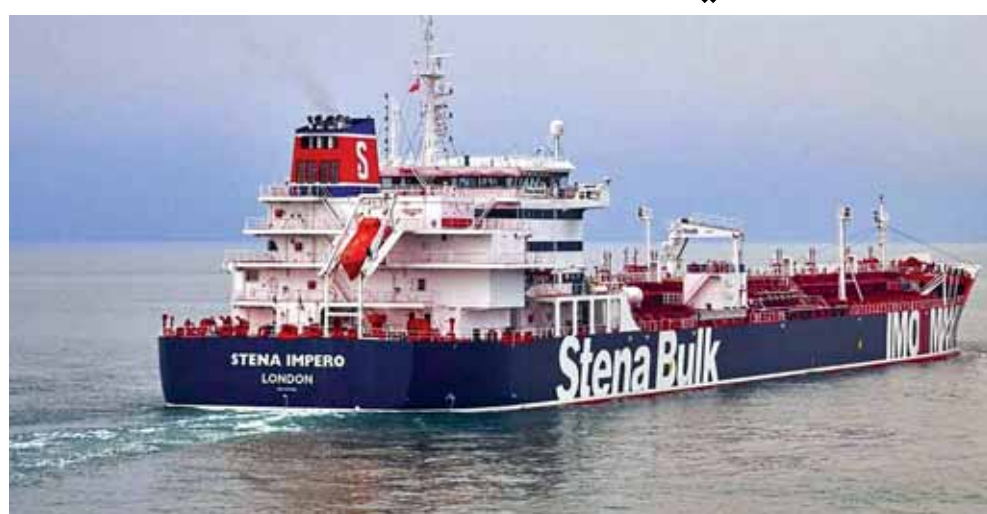
(تفاصيل الخبر الإيراني ص ١١)