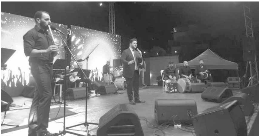
ملحم زين في مهرجانات جسر المدفون

لبنان وتستضيف آلاف السياح يوميًا وعلى مدار السنة. مشاريعنا واهدافنا كبيرة وكثيرة وكل ما نسعى إليه هو تسليط الضوء على هذه المنطقة ورفع اسمها وتحويل جسر المدفون إلى جسر تواصل بين كل المناطق اللبنانية وجسر تلاقي على المحبة والفرح وعلى السلامة بين بعضنا لأن لقيامته للبنان بالاحوار وتقبل الآخر».