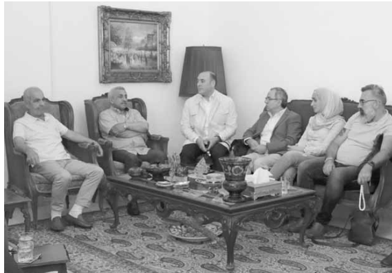
سعد مستقبلاً الوفد

وأكد «أن كل هذه المحاولات ستفشل في إحداث التفرقة بين الشعبين اللبناني والفلسطيني اللذين يجمعهما روابط الدم والانتماء للأمة العربية، ووقوفه إلى جانب الشعب الفلسطيني وقضيته المحقة حتى تحقيق عودته إلى أرضه».