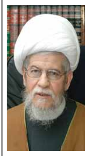
سماحة العلامة الشيخ عفيف النابلسي

كل الأحداث في المنطقة تشي بأن هناك إرادة أميركية إسرائيلية تتوافق معها بعض الأنظمة العربية للضغط على الشعب الفلسطيني لتصفية قضيتة. لقد نحتت التطورات الهائلة التي بدأت عام ٢٠١٠ في العالم العربي في محاصرة الشعب الفلسطيني والتأثير عليه ليقبل بالشرط