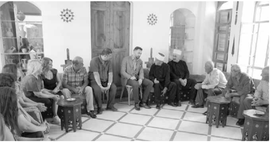
جنبلاط مع زواره في المختارة

التقى رئيس «اللقاء الديمقراطي» النائب تيمور جنبلاط، في إطار استقباله في قصر المختارة أمس، عدداً من الوفود الشعبية والأهلية والاجتماعية والبلدية، عرضت معه جملة من القضايا المتصلة بواقع المناطق وبلدياتها على الصعيد الإنمائي والحياتية والخدمات العامة، إضافة إلى الخطوات الآتية التي تعزز السياحة في منطقة الجبل، وتقدمها رجال دين وفاعليات قرى ومجالس بلدية واختيارية، في حضور وزير الصناعة وائل أبو فاعور والنائب فيصل الصايغ وهادي أبو الحسن ومستشار النائب جنبلاط حسام حرب. وفي هذا السياق، التقى وفداً كبيراً من العائلات المسيحية في بلدة الفريديس، ومثله وفد من بلدة البيرة، الحرف، ووفد من حزب «القوات اللبنانية» - مركز بيت الدين قدم له دعوة إلى حضور العشاء السنوي برعاية رئيس الحزب سمير جعجع في ١٤ آب المقبل في حديقة مطراية بيت الدين للموازية لمناسبة عيد السيدة. والتقى وفداً ضم المؤرخ الفرنسي جان بيار فيلو والمصور عمار عبدربه وعدداً من الفاعليات في معرض الصور «سوريا قبل واثناء الحرب»، الذي يقام ضمن