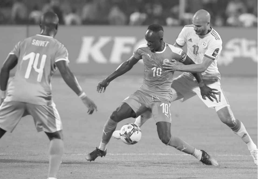
لقطة من المباراة النهائية