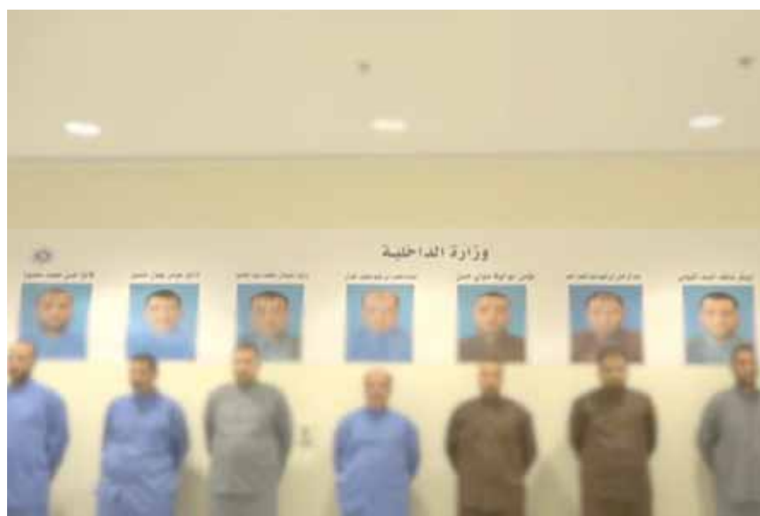
أعضاء خلية الإخوان المسلمين المعتقلين في الكويت

قالت صحيفة كويتية، نقلاً عن مصادر أمنية مطلعة أن جهاز أمن الدولة يصعد استدعاء شخصيات دينية وأصحاب شركات على صلة بالمتهمين الألمانية في قضية الخلية الإخوانية المصرية. وذكرت المصادر لصحيفة «القبس» أن نحو ٣٠٠ مصري ينتمون إلى جماعة «الإخوان المسلمون» غادروا الكويت خلال الفترة الماضية إلى تركيا وأستراليا وبريطانيا ودولة عربية خشية ملاحقتهم من قبل الإنتربول المصري، كونهم