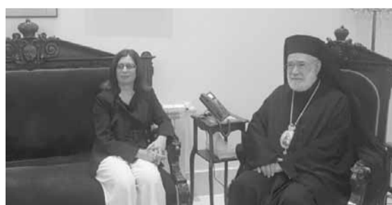
سفيرة قبرص تزور عودة

استقبل متروبوليت بيروت وتوابعها للروم الأرثوذكس المطران الياس عودة، سفيرة قبرص في لبنان كريستينا رافتي في زيارة وداعية بسبب انتهاء مهمتها في لبنان. وشكرت رافتي المطران عودة على محبته ومساعدته لها طيلة فترة خدمتها في لبنان.