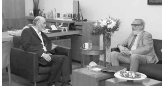
جعجع مستقبلاً السفير البلجيكي

التقى رئيس حزب القوات اللبنانية سمير جعجع، في مراب، سفير بلجيكا هوبير كورمان، في حضور رئيس جهاز العلاقات الخارجية في الحزب إيلي الهندي وروجيه راجح، وكانت الزيارة مناسبة للتعرف والبحث في التطورات السياسية في لبنان والمنطقة، فضلاً عن ملف النازحين السوريين في لبنان.