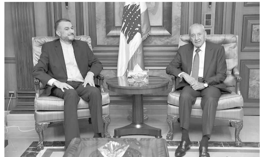
بري مستقبلاً عبد اللهيان

استقبل رئيس مجلس النواب نبيه بري في ساحة النجمة مساعد رئيس مجلس الشورى الإيراني حسين امير عبد اللهيان بحضور سفير الجمهورية الإسلامية الإيرانية في بيروت محمد جلال فيروزنيا. بعد اللقاء، قال عبد اللهيان: «كانت لنا جولة محادثات جيدة وبناءة مع رئيس مجلس النواب اللبناني واتينا الى هنا لنؤكد مرة ثانية ان ايران تدعم وبكل قوة ابناء الشعب اللبناني والجيش والمقاومة والحكومة، وننتقل الى تطور العلاقات بين البلدين وعلى أعلى المستويات وتؤكد