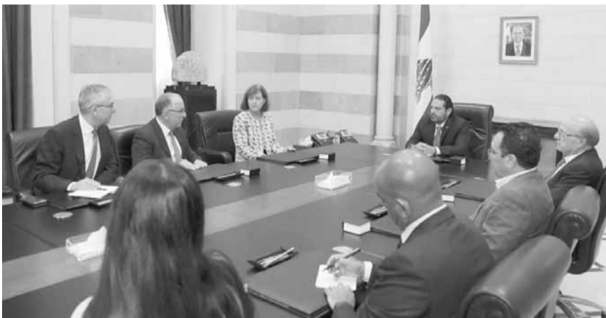
الحريري مع السفيرة الأميركية وأعضاء الوفد

وانشاء محطات جديدة تعمل على انواع مختلفة من الوقود بما فيها من الغاز والوقود السائل».