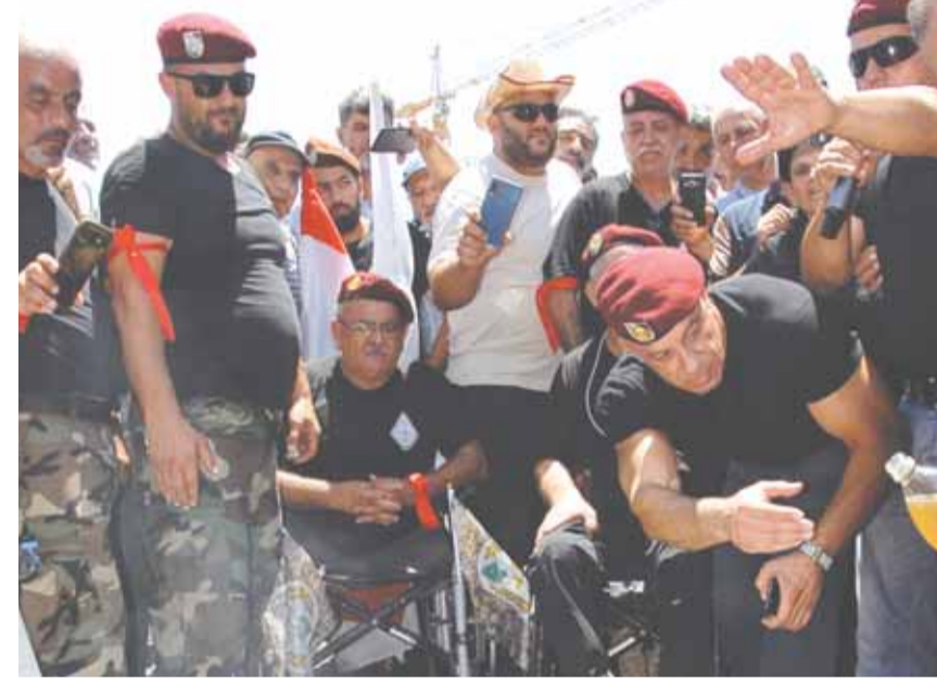
خيمة العسكريين المتقاعدين وبينهم ما زالوا جرحى