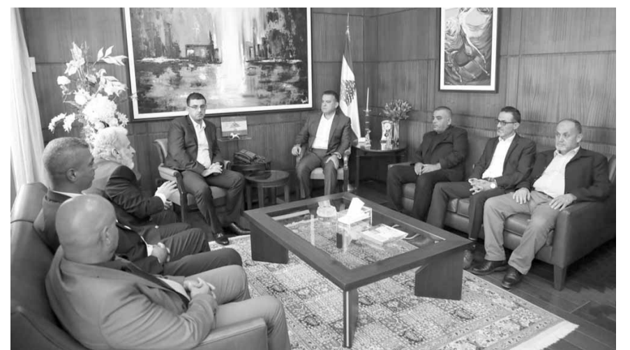
اللواء ابراهيم مع الوفد الفلسطيني

تم التقي اللواء ابراهيم وفداً من التجار الفلسطينيين في الجنوب الذين عرضوا له إنعكاسات قرارات وزارة العمل المتعلقة بتطبيق قانون العمل على اليد العاملة الأجنبية على أعمالهم.