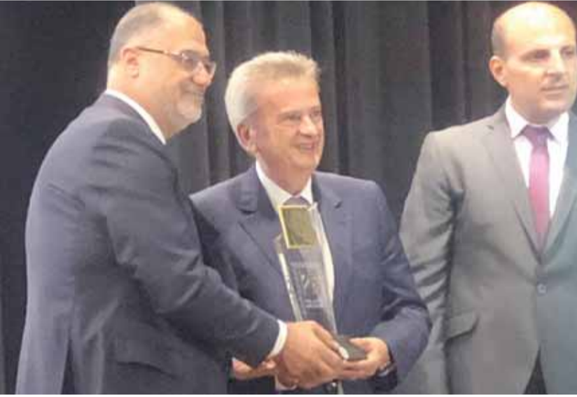
دفع تكريمي للحاكم رياض سلامة

في دردشة على «الواقف» وقبيل ترؤسه احتفال تكريم الموظفين المتقاعدين في مصرف لبنان في المعهد العالي للأعمال في كليمنصو تحدث حاكم مصرف لبنان رياض سلامة حول الأوضاع المالية والنقدية وما يتم تداوله في هذا الإطار. وقال سلامة هناك بدائل عديدة للإكتتاب بـ ١٪ بأدوات مالية أخرى سنتوصل إليها لتحقيق الوفر وجدد التأكيد على استقرار الليرة معتقداً أنه لا توجد حركة تحاويل من الليرة في الأسواق.