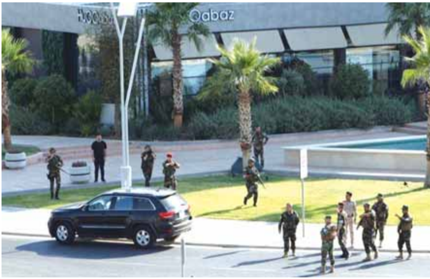
مكان مقتل الدبلوماسي التركي

أكدت الخارجية التركية مقتل موظف بقنصليتها في إربيل ناربيل. وأضافت الخارجية في بيانها بحسب وكالة أنباء الأناضول «التركية»: نواصل اتصالاتنا مع السلطات العراقية والمسؤولين المحليين للتحقيق على منغذي الهجوم. وأفادت معلومات، أوردتها شبكة «رووداو» الكردية، عن مقتل ٣ أشخاص في إطلاق نار، مشيرة إلى أن نائب القنصل العام التركي وأنذرين