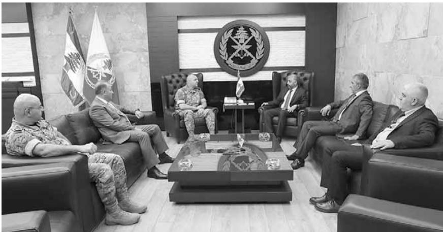
العماد عون مع لجنة مهرجان القاع

استقبل قائد الجيش العماد جوزاف عون في مكتبه في اليرزة، وفداً من لجنة مهرجانات القاع ٢٠١٩، وجرى