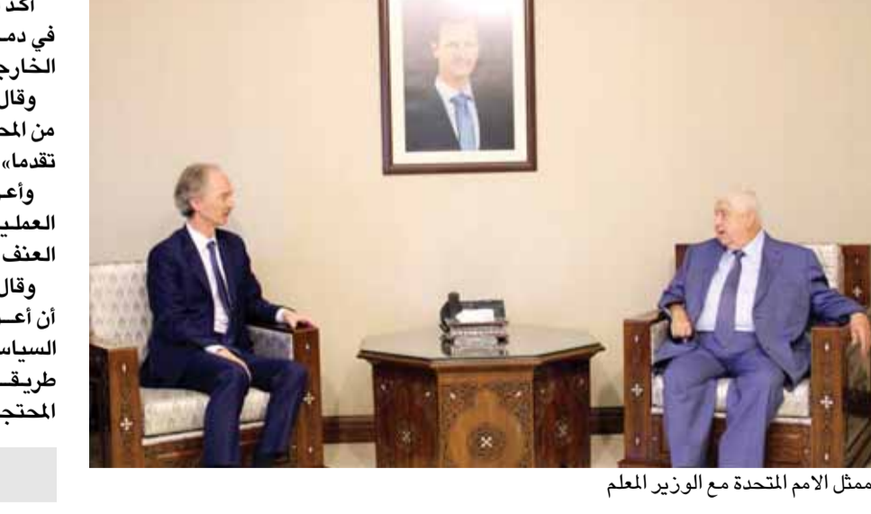
ممثل الامم المتحدة مع الوزير المعلم

أكد المبعوث الأممي إلى سوريا، غير بيدرسون، أنه أجرى في دمشق مباحثات وصفها بـ«الجيدة جداً» مع وزير الخارجية السوري، وليد المعلم. وقال بيدرسون، في تصريحات للصحافيين، «لقد انتهت من المحادثات مع المعلم وكانت جيدة جداً وأعتقد أننا احرزنا تقدماً»، لافتاً إلى أنهما سيعقدان اجتماعاً آخر. وأعرب بيدرسون، لدى وصوله لدمشق، عن أمله في دفع العملية السياسية خلال زيارته لدمشق، بالإضافة إلى إنهاء العنف في ادلب. وقال بيدرسون، في تغريدة على «تويتر» الثلاثاء، «يسرني أن أعود إلى دمشق، ونأمل أن نتكمن من دفع العملية السياسية إلى الأمام مع اللجنة الدستورية، ونتمكن من إيجاد طريقة لإنهاء العنف في ادلب، ومواصلة العمل على المحتجزين والمختطفين والمفقودين».