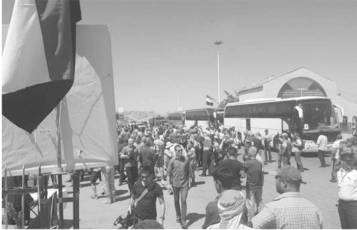
العناوين بالتواصل الرسمي مع دمشق.

ويوضح المصدر السياسي ان البعض في لبنان لا زال يحاول التهرب من مقتضيات عودة النازحين، أما من خلال التشكيك بالمسعى الروسي لاعادتهم ولو ان فيها مصلحة مباشرة للجانب الروسي، وأما من خلال القاء تهمه العرقلة على الحكومة السورية، على الرغم من تاكيد ليس فقط المسؤولين السوريين لرغبتهم في عودة النازحين بل في تاكيد كل حلفاء دمشق انهم سمعوا كلاماً واضحاً من القيادة السورية بدءاً من الرئيس بشار الاسد بالاستعداد والعمل للقيام بكل ما هو ممكن لاعادة النازحين وهو الأمر الذي كان أكد عليه الأمين العام لحزب الله السيد حسن نصر الله، في وقت تاكد عبر السنوات الماضية ان الفريق الداخلي الذي يعرقل عودة النازحين يتكأ على الرفض الأميركي والإممي لهذه العودة تحت مبررات وأهية لا تخدم المصلحة اللبنانية في حين ان كثيرا من هؤلاء ومعهم كثير من المنظمات المحلية والدولية المهتمة بقضية النازحين يجمعون الفوات جراً ما يحصل من «مسمرات» في التعويضات المالية والخدمات الاجتماعية التي تقدم للنازحين.