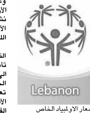
شعار الأولمبياد الخاص

ينظم الأولمبياد الخاص اللبناني برعاية وزير الصحة العامة الدكتور جميل جبيق، وبدعم من مؤسسة غوليزانو، «المؤتمر الأول للمجتمعات الصحية» على مدى ثلاثة أيام متتالية اعتباراً من السبت ٢٢ الجاري في «جمعية رعاية اليتيم» - صيدا، وسيكون بإشراف الأولمبياد الخاص الدولي لمنطقة الشرق الأوسط وشمال أفريقيا. وبرنامج المجتمعات الصحية انشئ من قبل مؤسسة غوليزانو، والذي يسعى للتركيز على أهمية تمتع لاعبي الأولمبياد الخاص بصحة جيدة تمكنهم من تحقيق الأفضل دائما على جميع المستويات، كما ويؤمن لهم فرصة متساوية للحصول على رعاية صحية عالية الجودة وتوعية صحية لازمة، هو نموذج عن البرنامج الصحي للأولمبياد الخاص لمعالجة الفروقات الصحية الحادة التي يعاني منها الأشخاص ذوي الإعاقات الفكرية عن طريق إيجاد حلول محلية مشتركة فورية وطويلة الأمد، بالإضافة إلى ذلك، فإن برنامج المجتمعات الصحية يعمل على رفع مستوى نوعية الرعاية الصحية ونشر الواقية والتوعية من أجل تحسين الحالة الصحية لذوي الإعاقات الفكرية. بدأ العمل على برنامج المجتمعات الصحية في الأولمبياد الخاص اللبناني منذ عام تقريبا وتم تطبيقه في فرع الجنوب، صيدا تحديدا كدراسة أولية