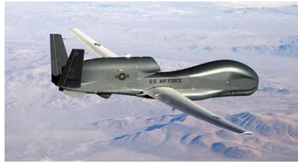
طائرة اميركية مسيرة من دون طيار

عقد الرئيس الاميركي ترامب اجتماعاً ضمّ وزير الدفاع الاميركي بالوكالة شنبان ووزير الدفاع المرشح اسبر الذي هو من مشاة البحرية الاميركية ومن الفرقة ١٠١ المتميزة وهو رفيق وزير الخارجية الاميركي بومبيو في المعهد الاميركي العسكري «وست بوينت» وتم استدعاء قائد السلاح الجو الاميركي في الشرق الاوسط وفي الاقليم من ايران كما تم استدعاء قائد البحرية الاميركية ونقلت القائدين الاميركيين طائرة من الاقليم الى واشنطن، كما حضر الاجتماع ضباط وجنرالات من وزارة الدفاع الاميركية ولم يتسرب اي شيء الى وسائل الاعلام الاميركية حول الاجتماع ولم تشر اي معلومة عن اجتماع عسكري برئاسة الرئيس ترامب لكن بعد الاجتماع استدعى الرئيس الاميركي قادة الكونغرس ورئيسة مجلس الكونغرس الاميركي بيلوسي وهي من