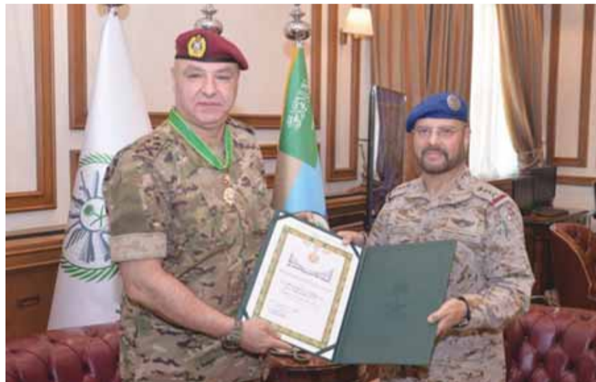
قائد الجيش يتسلم وسام الملك عبد العزيز