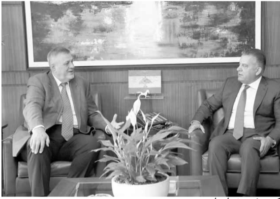
كوبيش عند ابراهيم

زار المنسق الخاص للامم المتحدة في لبنان يان كوبيش، رئيس مجلس النواب نبيه بري قبل ظهر امس في عين التينة، وعرض معه للاوضاع الراهنة.