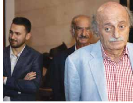
انهم أدوات لقوى لا تؤمن بالميثاق والتنوع وفلسفتها اساساً الإلغاء».

بدأ على مؤتمر البلديات للتيار الوطني الحر ■ قال جنبلاط: «هل هو مؤتمر للبلديات للتحدث عن الانماء المتوازن وازمة النفايات القادمة مجدداً ام هو