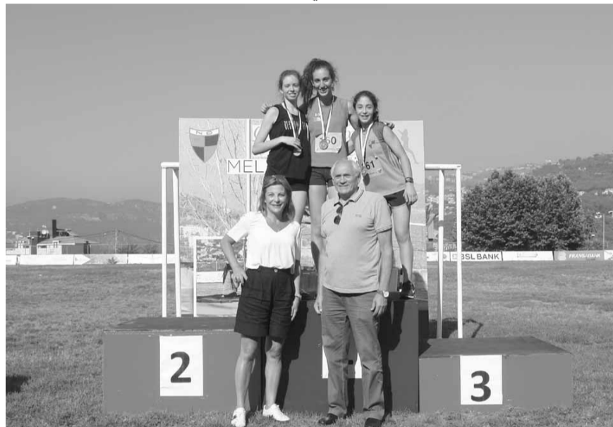
والدة ميلاني تتوج أبطال إحدى المسابقات