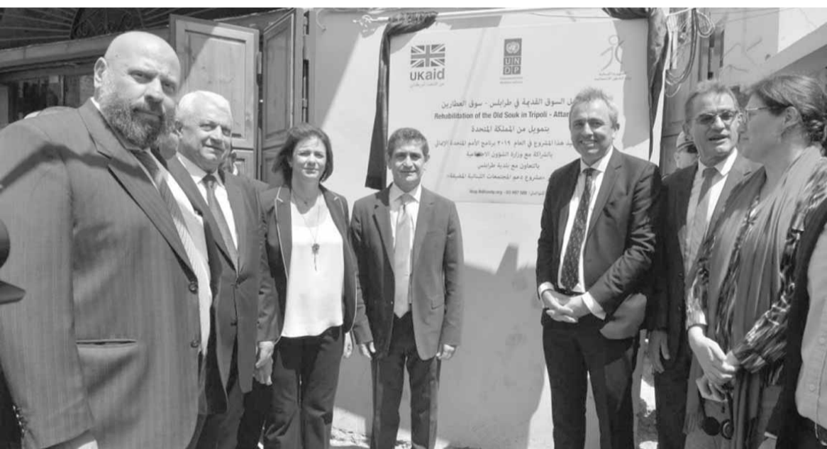
وفد الإتحاد الأوروبي يجول في طرابلس

فهل يستطيع اللقاء النيابي الموسع ايجاد الحلول لهذه الازمات والملفات؟؟... ينتظر الطرابلسيون ما ستسفر عنه المذكرة الطرابلسية التي ستسلم الى الرئيس الحريري في لقاء سيعقده نواب طرابلس معه الاسبوع المقبل، على ان يحصلوا منه على التزام بتنفيذ المطالب وفق جدول زمني محدد ولذلك اكتفى النواب ببيان مقتضب لان العبرة في التنفيذ.