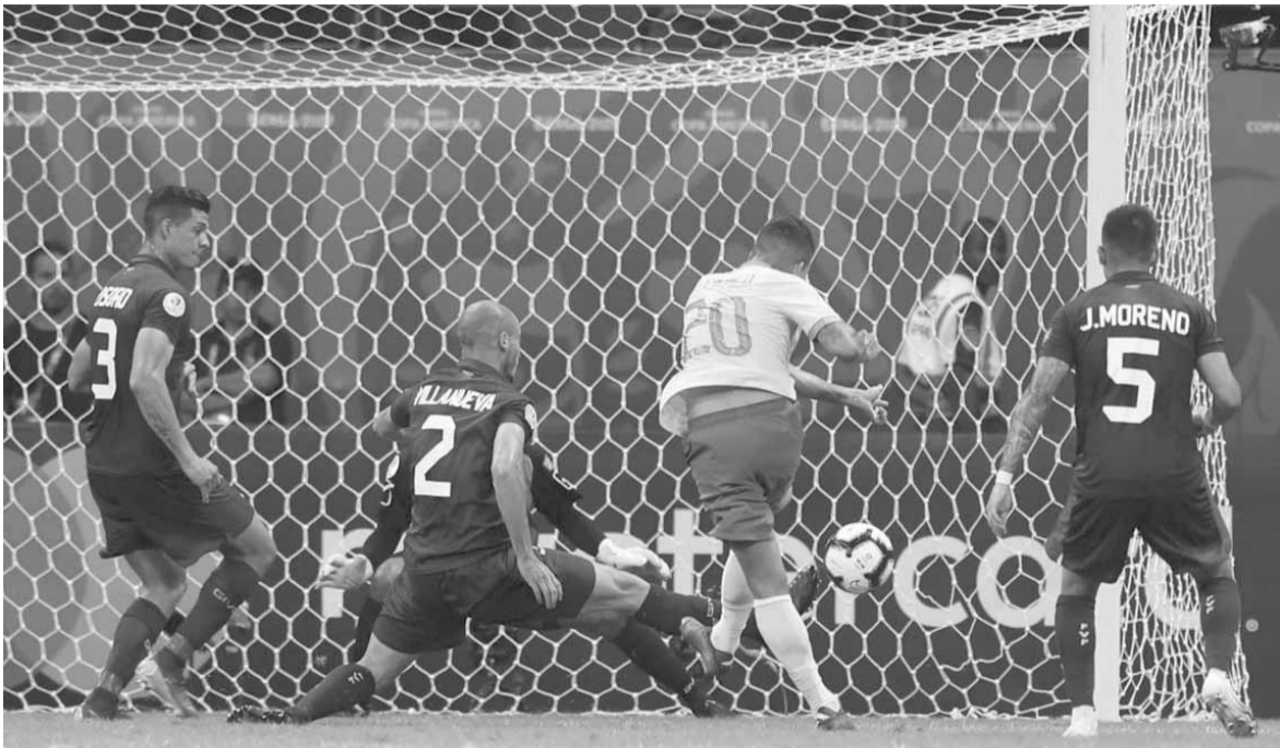
هدف برازيلي ملغى

وإذا ما سارت الأمور بشكل طبيعي، من المنتظر أن يعتمد رويدا على نفس التشكيل الذي اعتمده في مواجهته «الساموراي».