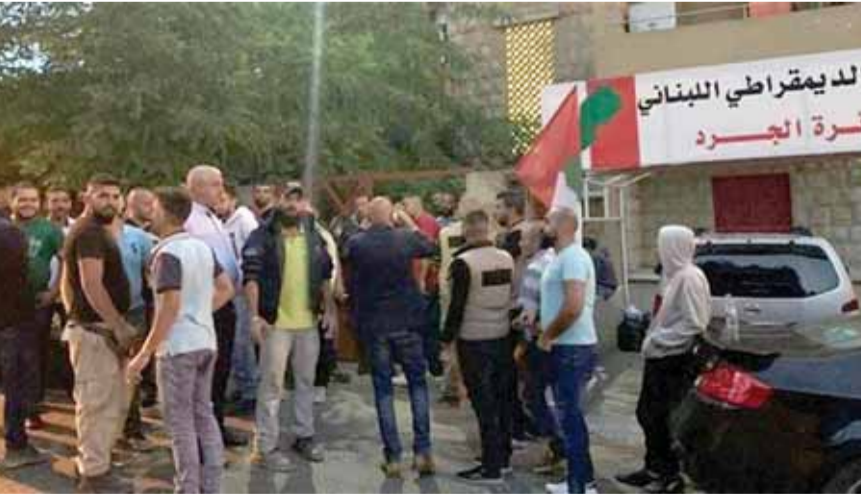
مناصرو الديموقراطي يقطعون طريق المديرج