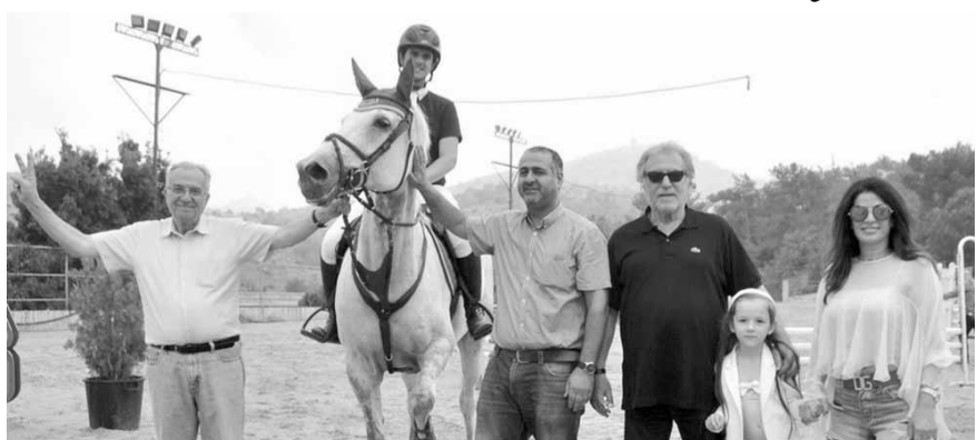
توزيع أحد الأبطال