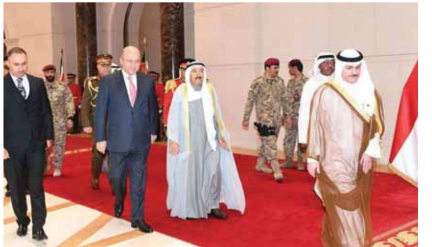
الرئيس العراقي مستقبلا امير الكويت

وصف رئيس الوزراء العراقي عادل عبد المهدي، زيارة امير الكويت الشيخ صباح الاحمد الجابر الصباح المقررة إلى بغداد بالمهمة وليس للبلدين فحسب بل للإقليم بأسره. وقال عبد المهدي في مؤتمر صحفي، «إن العلاقات العراقية الكويتية، اليوم في أفضل حالاتها، وقد شهدت العديد من الزيارات المتبادلة بين كبار المسؤولين في البلدين، والتي ستتوج بزيارة الشيخ صباح الاحمد الصباح». وأكد عبد المهدي أن زيارة امير الكويت إلى بغداد في هذه الظروف تعد «مؤشرا مهما» على تنامي العلاقات بين البلدين. وذكر عبد المهدي أن الزيارة ستشهد اجتماعات مشتركة وصفها بـ«الغنية جدا»، مؤكدا أن «الطرفين سيعززان ما تم الاتفاق عليه بين الحكومتين في المرحلة الماضية والعمل على