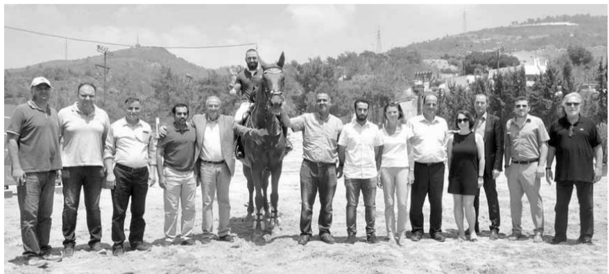
كبار الحضور مع الفائزين والفائزات

واستطرد: «دخلو فرناندينيو؟ إنه كان بمثابة محطة أخرى لبناء اللعب، كما أن كاسيميرو، حصل على إندثار في المباراة».