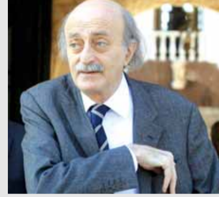
تجاهل النائب فيصل كرامي ولا اللقاء التشاوري السني كذلك لا يمكن للوزير جبران

باسيل تجاهل حزب الكتائب والقوات والمردة ولا يمكن للرئيس الحريري والوزير جبران باسيل تجاهل الوزير جنبلاط والوزير طلال ارسلان وحتى الوزير ونام وهاب وكل واحد نسبة لشعبيته وواقعه. هكذا يكون الميثاق الوطني الحقيقي، اما ما نشهده فهو حصار للوزير وليد جنبلاط وسيؤدي الى نقض الميثاق الوطني اللبناني وخاصة وأن الوزير جنبلاط الذي تنازل عن وزير في الحكومة، قد يذهب اذا تم تجاهل واقعه وقوته الشعبية ان ينسحب من الحكومة وعندها لا تستطيع الحكومة الاستمرار بغياب تمثيل الجبل وخاصة اكبر قوة فيها وهو الوزير وليد جنبلاط.