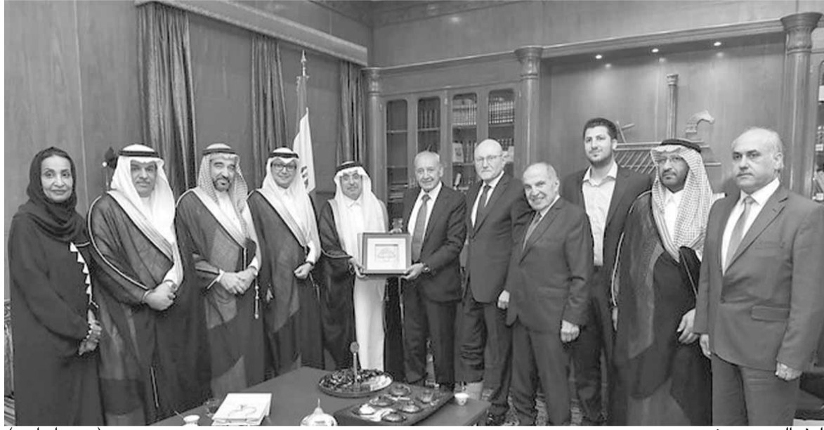
الوفد السعودي عند بري (حسن ابراهيم)

وزار الوفد السعودي الرئيس بري في عين التينة وجري عرضاً للتطورات الراهنة