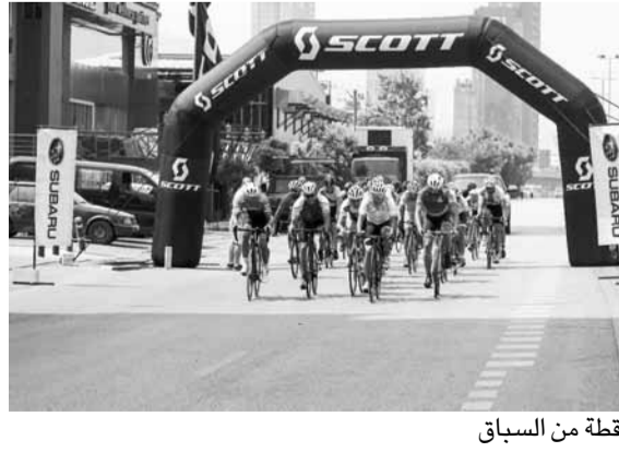
لقطة من السباق

للدرجات كافة الهواة ولاعبي الجمعيات الى المشاركة في بطولة لبنان للطريق ضد الساعة يوم الأحد الواقع في ٣٠ حزيران الجاري في منطقة النهر - بيروت.