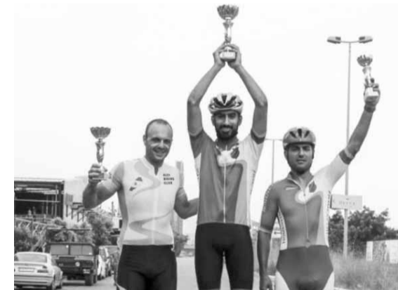
الإبطال على منصة التتويج

انشورانس للتأمين وشركة سكوت للدراجات لمساهمتها في إنجاح السباق وفق أعلى معايير الجودة والأمان و٣٠ حزيران الجاري في منطقة النهر - بيروت.