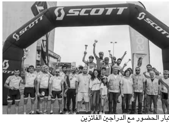
كبار الحضور مع الدراجين الفائزين