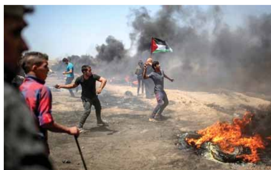
المواجهات اليومية مع جيش الاحتلال

افادت وسائل إعلام فلسطينية بأن فصائل غزة استهدفت قوة عسكرية اسرائيلية خاصة أثناء وجودها داخل القطاع.