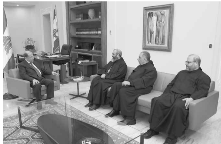
عون مجتمعاً مع الهاشم ونعمة ومكرزل (الدايتي ونهرا)

أكد رئيس الجمهورية العماد ميشال عون ان «لبنان جاهز لمنح جنسيته لكل من يرغب باستعادتها من ابناؤه المحترمين كي تبقى شهادة اسم ابائهم واحفادهم على جذورهم»، معتبراً ان «لبنان بحاجة اليوم لدعم ابناؤه في دول الانتشار ليتمكن من مواجهة الظروف والتحديات التي يمر بها على مختلف الاصعدة، وهو مصمم على المضي قدماً في المحافظة على الامن والاستقرار ليبقي قلبه انظار مواطنيه في الداخل كما في دول الانتشار».