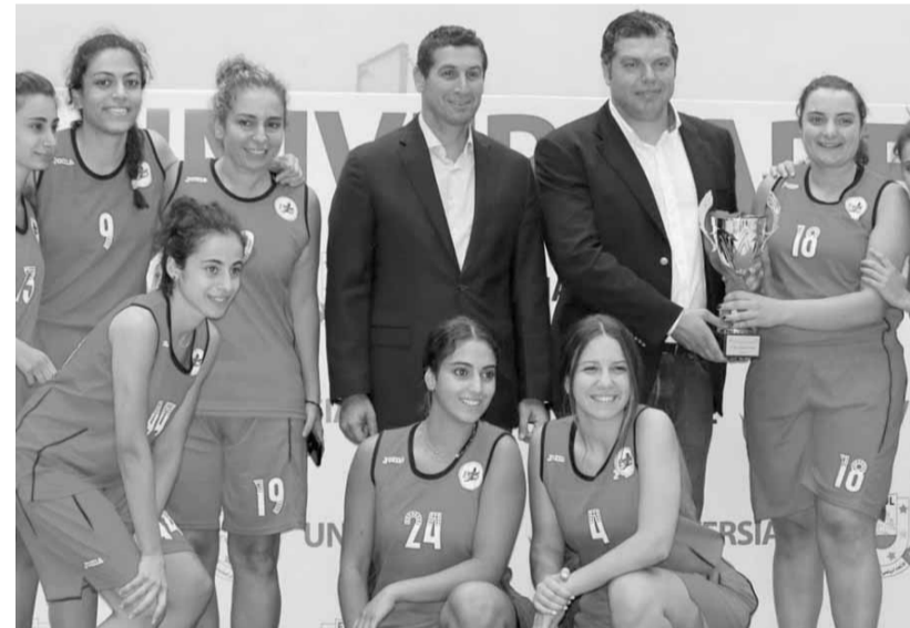
لحدو يتوج أحد الفرق الفائزة