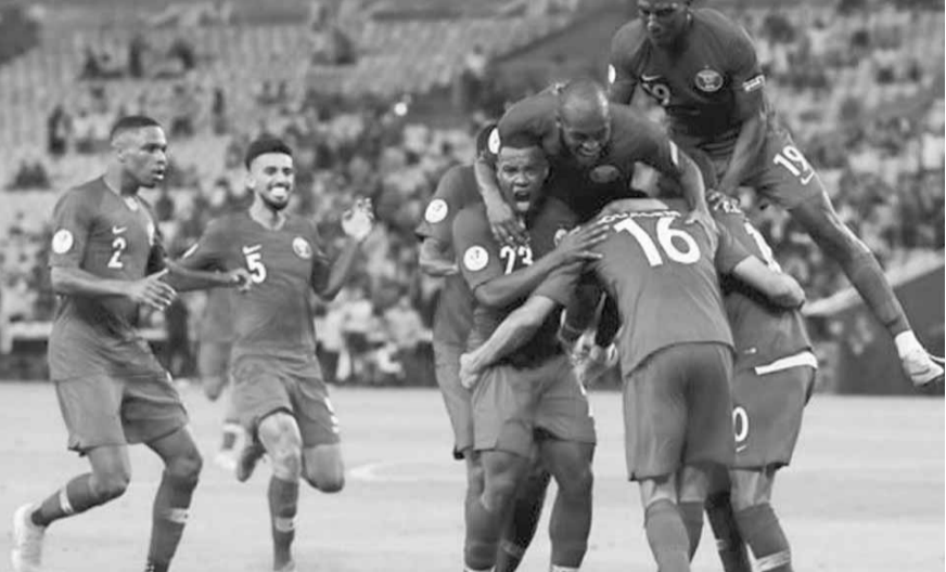
لاعبو قطر يحتفلون بهدف التعادل