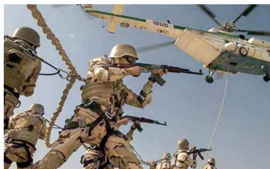
تدريبات الجيش الايراني

أكد رئيس الأركان الإيراني، محمد باقري، أن بلاده ستعلن عن إغلاق مضيق هرمز في حال ازادت ذلك، مجدداً في بحر عمان.