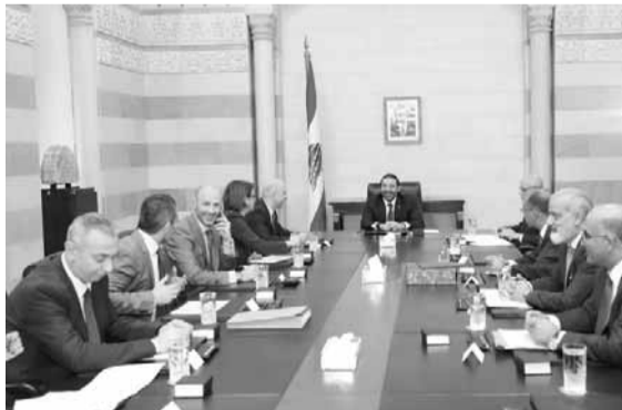
الحريري مترشاً الاجتماع

ترأس رئيس مجلس الوزراء سعد الحريري، ظهر امس في السراي الحكومي، اجتماعاً للجنة الوزارية المكلفة دراسة موضوع الكسارات، حضره نائب رئيس الحكومة غسان حاصباني والوزراء ريا الحسن، يوسف فينانوس، فادي جريساتي والامين العام لمجلس الوزراء محمود مكية.