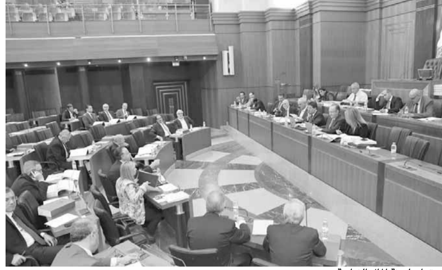
اجتماع لجنة المال النيابية

ورداً على سؤال عن موقف «حزب الله» من رسم الـ ٢٪ على استيراد البضائع، قال كنعان: «هناك آراء متنوعة حوله، وما يطرحه الزملاء في «حزب الله» إلى جانب نواب آخرين، هو وضع رسم نوعي. وأنا لا أريد استتياق الأمور طالما أن المادة لا تزال خاضعة للنقاش. ولا سيما أن هذه المادة تؤمن ما يصل إلى ٥٠٠ مليار ليرة إيرادات وتحصي الصناعة اللبنانية».