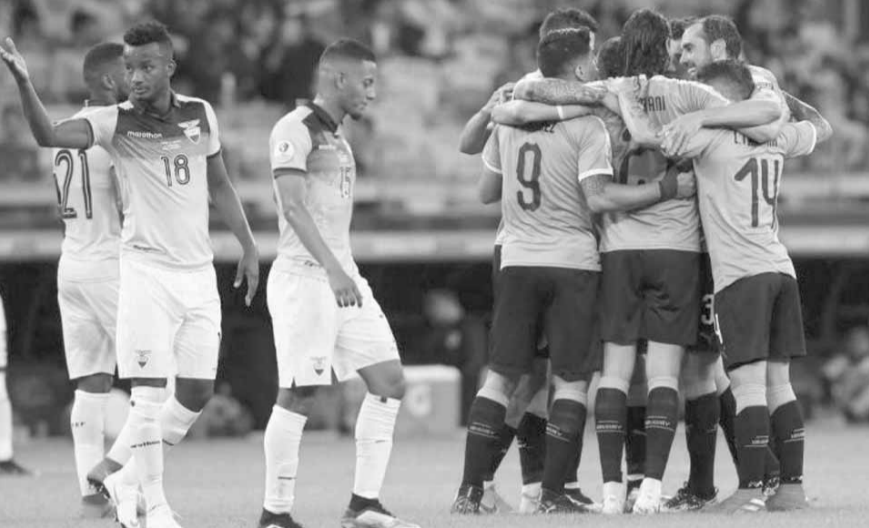
فرحة لاعبي الأوروغواي وخيبة لاعبي الاكوادور

كشर المنتخب الأوروغواياني عن أنيابه بفوز ساحق على نظيره الإكوادوري ٤-٤ صفر في بيلو أوريزونتي في افتتاح الجولة الأولى لمنافسات المجموعة الثالثة ضمن كوبا أميركا لكرة القدم التي تستضيفها البرازيل.