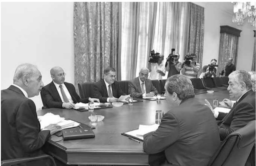
بري يترأس اجتماع هيئة مكتب المجلس النيابي (حسن ابراهيم)

ترأس رئيس مجلس النواب نبيه بري بعد ظهر امس، في عين التينة، اجتماع هيئة مكتب المجلس، بحضور نائب الرئيس ايلي الفرزلي وعون، سمير الجسر واغوب بقرادونيان، الأمين العام للمجلس عدنان ضاهر والمدير العام محمد موسى. وبعد الاجتماع، صرح الفرزلي: «تقرر في اجتماع هيئة مكتب المجلس، برئاسة الرئيس بري، عقد جلسة نيابية تشريعية في نهاية هذا الشهر يحدد موعدها في ما بعد، وتتناول مشاريع واقتراحات القوانين الواردة على جدول الاعمال الى جانب