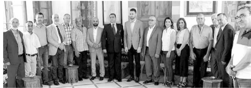
جنبلاط مع الوفود

رابطة آل محمود الباروك. واستقبل جنبلاط وفداً روحياً واكاديمياً إيطاليا برئاسة عميد كلية الحق الكنسي في الفاتيكان وكليات القديس يوحنا اللاتيرانوم التابعة لقيادة البيايا فرنسيس المونسنيور أوروبا، يرافقه عميد الكلية في لبنان الأب ابلي رعد والدكتور غرازيلا ابراهيم وكاهن رعية كنيسة سيدة الدر في المختارة الأب عبد ابو راشد، جال في اقسام القصر ومكتبته، ووقدا اجنبا فرنسا استطاع كذلك قصر المختارة بالتقى وفداً من فرع الحزب التقدمي الاشتراكي من بلدة مرستي، ووقدا من مكتب منظمة الشباب التقدمي في الشوف، ووقدا من عائلة الحاج شحانة في شحيم ومن بلدتي كرفوق والباروك وبلدية عين قني. وتلقى جنبلاط سلسلة مراجعات من مجالس بلدية وفروع حزبية وهيئات مختلفة في اطار متابعة اوضاعها.