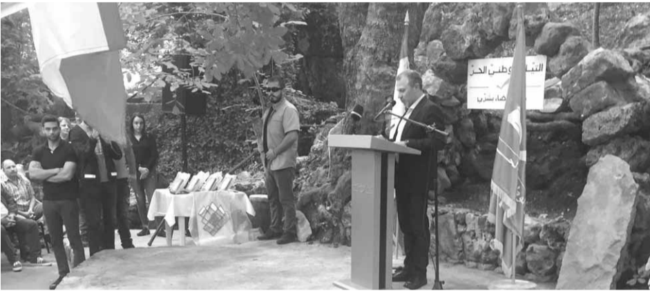
باسيل يتحدث من بلدة قنات

خارطة السياحة ونربطها بطريق القديسين وطريق القداسة من حردين القريبة وصولا الى كل مشاريع السياحة الدينية التي نقوم بها»، وأشار الى أننا بدأنا الاهتمام بالطريق لربط قضاء البترون بقضاء بشري من الجهة العليا ووضعنا ضمن قرض البنك الدولي وايضا من جهة بساتين العصي ومزرعة بني صعب وبني عساف وقنات وهذه طريق تعرفون اهميتها وهي تغيير كل حياتنا واقتصادنا وتطلق دورة اقتصادية حقيقية وغدا ثرون اننا سنفرد فرقا بهذا الموضوع».