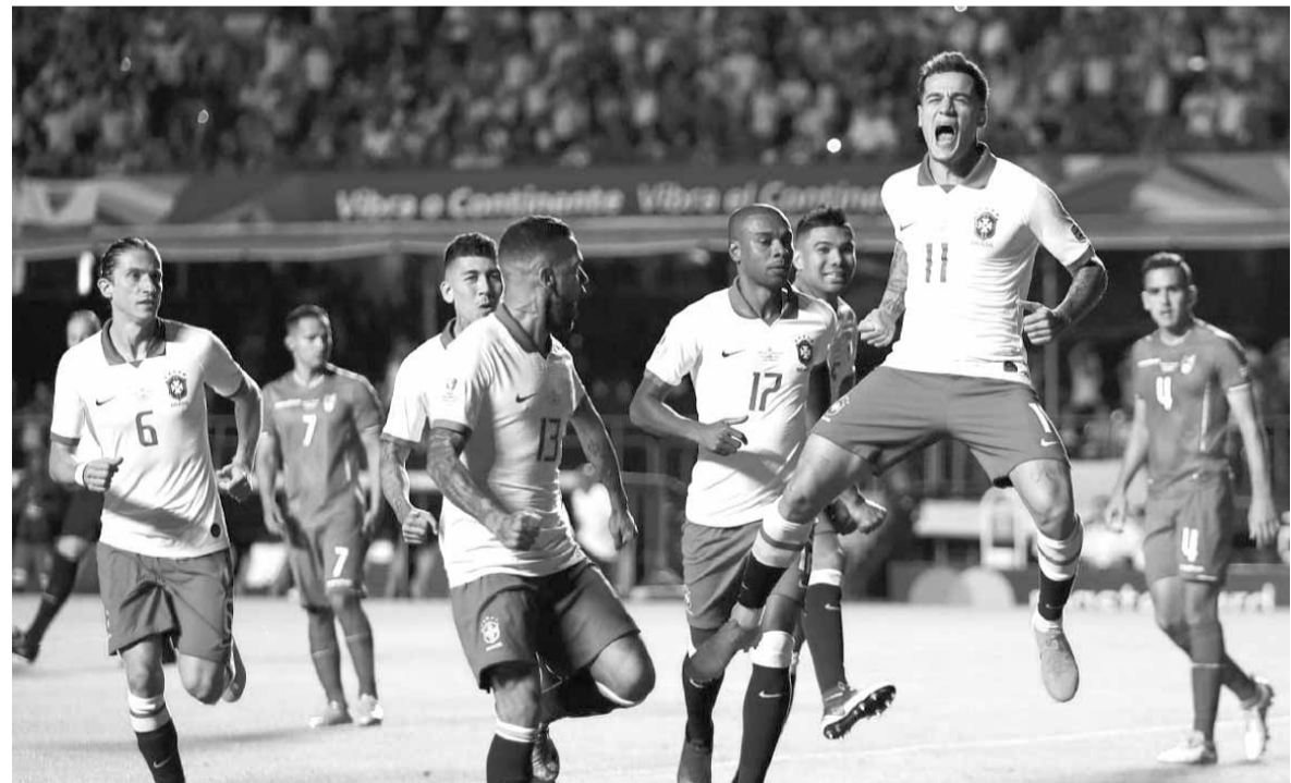
كوتينيو يحتفل بهدفه الاول في مرمى بوليفيا

واعتاد (سيليساو) رفع كأس كوبا أميركا في كل مرة تقام فيها البطولة على الأراضي البرازيلية.