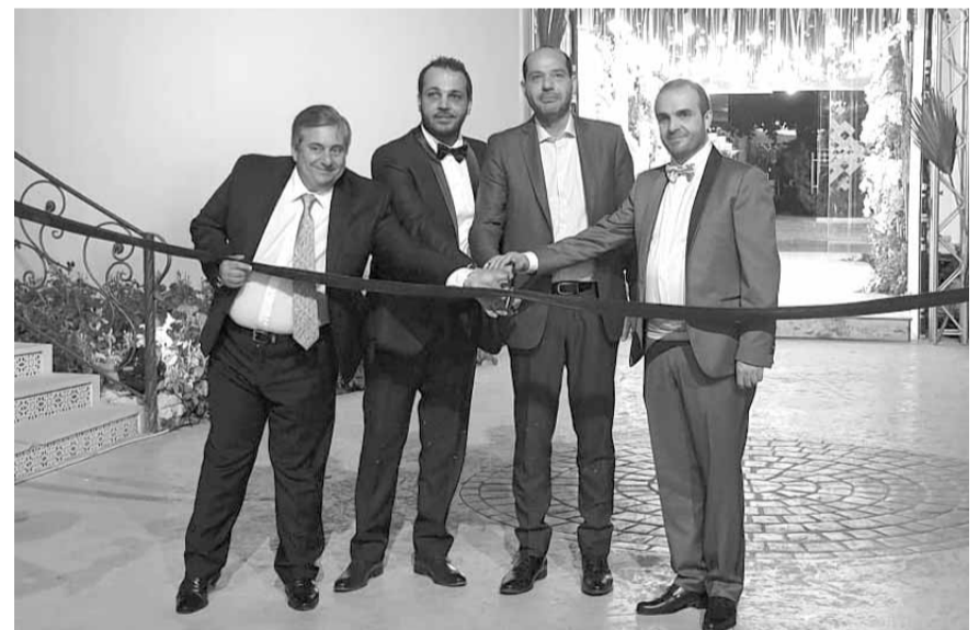
مراد خلال الافتتاح

تم افتتاح مجمع سياحي في تعنايل بالبِقاع الأوسط، برعاية وزير الدولة لشؤون التجارة الخارجية الوزير حسن مراد وحضور نواب ووزراء سابقين وحاليين، شخصيات سياسية وحزبية واقتصادية واجتماعية، قائمقامين ورؤساء اتحادات وبلديات وحشد من الاصدقاء والاهالي. بعد قص شريط الافتتاح من قبل الوزير مراد وصاحب المشروع دوري وداني صالح، الشيد الوطني، تاله كلمة للوزير مراد قال فيها: «مهما قدمنا للبِقاع من مشاريع بنقى مقصرين في حقه لذلك علينا أن نقدم أكثر وأكثر، ولذلك نحن مدتنا اليد وبحضور وزير الاقتصاد إلى المنطقة ومشاركة أكثر من ٤٠٠ إقتصادي وصاحب مؤسسة لتعمل سويا من أجل البِقاع.» وإذ أشاد الوزير مراد بوزير السياحة المهتم للمنطقة ومؤسساتها، جدد تعهده «بدعم مطالب واحتياجات أصحاب المؤسسات الاقتصادية والسياحية في البِقاع»، وأضعا