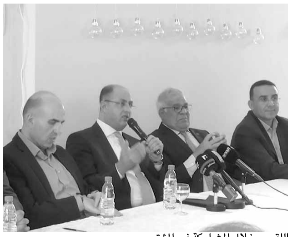
اللقيس خلال المشاركة في المؤتمر