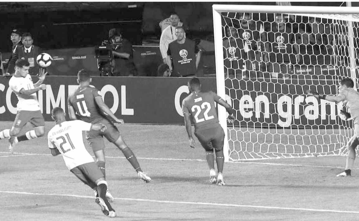
.. ويسجل الهدف الثاني من كرة رأسية

وقع أغنيات المطربة الكولومبية كارول جي، والبرازيلي ليو سانتانا. استغرق الحفل ١٥ دقيقة، وتوالت فقراته على الأرضية العشبية للملعب مورومي قبيل مباراة الافتتاح بين منتخبى البرازيل صاحب الأرض، وبوليفيا، وحضره الرئيس البرازيلي جاير بولسونارو.