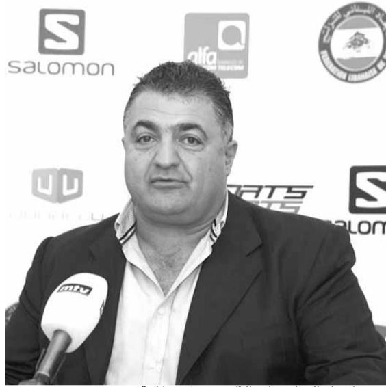
رئيس اتحاد التزلج على الثلج شربل سلامة