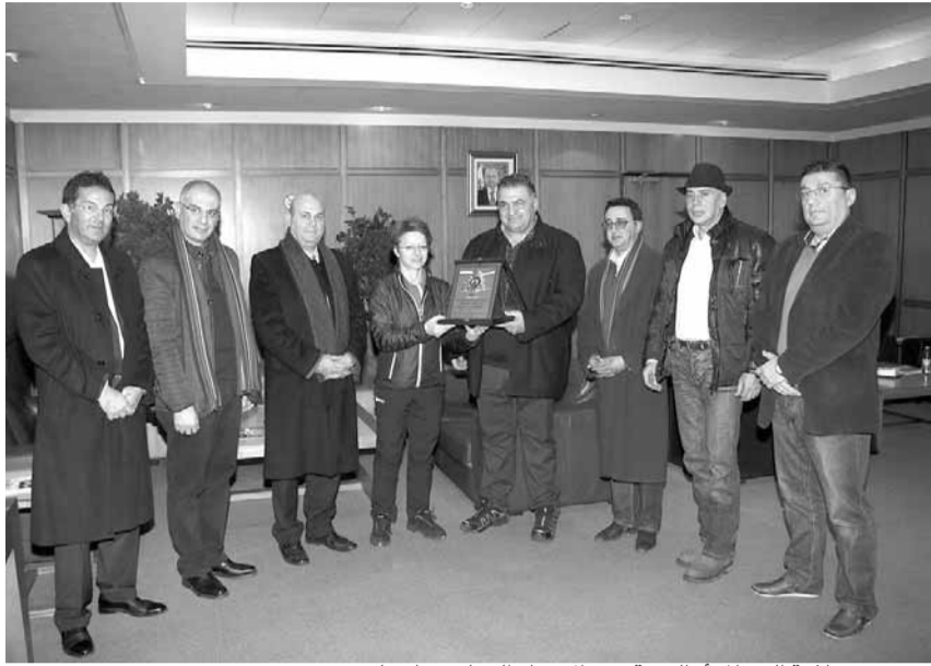
درد من سلامة إلى «المرأة القوية» في الاتحاد الدولي سارة لوييس