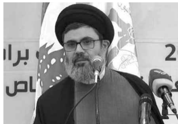
صفي الدين يتحدث من بنت جبيل

فنحن في الوقت الذي نحرص فيه على معالجة الأزمة المالية وتخفيض العجز وتحسين موارد الدولة المالية، لدينا أولويات لا يمكن أن نعيد عنها، وأولها حماية الفئات الشعبية وذوي الدخل المحدود، وعدم فرض ضرائب جديدة تضيف أعباء جديدة على المواطنين».