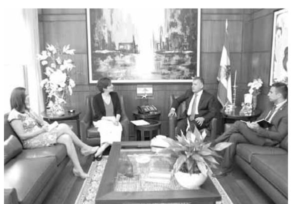
اللواء ابراهيم مجتمعاً مع سفيرة كندا