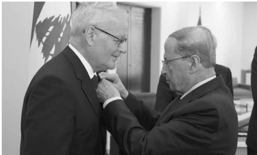
عون يمنح لوفيل وسام الارز الوطني (الدايتي ونهرا)

وكان الرئيس عون قد منح، في حضور الوزيرين جريصاتي وسرحان والقاضي فهد، الرئيس الأول لمحكمة التمييز الفرنسية رئيس مجلس القضاء الأعلى الفرنسي القاضي برتران لوفيل «Bertrand Louvel»، وسام الأرز الوطني من رتبة ضابط تقديراً لعهاداته على الصعيد القضائي والتعاون القائم بين محكمة التمييز اللبنانية ونظيرتها الفرنسية، وعربون شكر لمشاركته في مئوية محكمة التمييز اللبنانية.