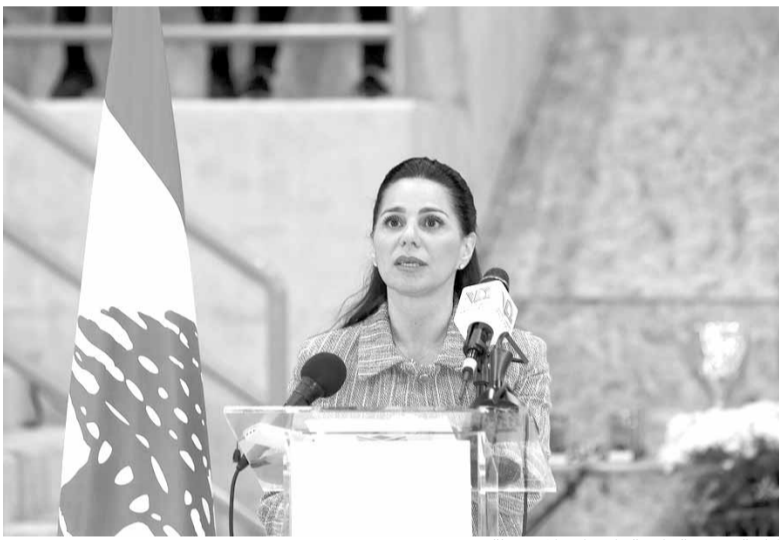
كلمة رئيسة بلدية بكفيا - المحيطة

وتقدير باسم عائلة كرة السلة. ثم جرت المباراة النهائية لتحت الـ ١٨ سنة واسفرت عن فوز نادي أينييرج (ذوق مكاييل) على نادي هوب (٦٨-٦٢) في مباراة حماسية وامام جمهور غفير. وبعدها تقدم فريق هويس سريعاً (٢٠-٢) استعاد لاعبو نادي أينييرجي روحهم ونجحوا في تقليص الفارق رويداً رويداً حتى حسموا المباراة لمصلحتهم بفارق ٦ نقاط (٦٨-٦٢). قاد المباراة الحكم الدولي بول سقيم والحكم المرشح دولي