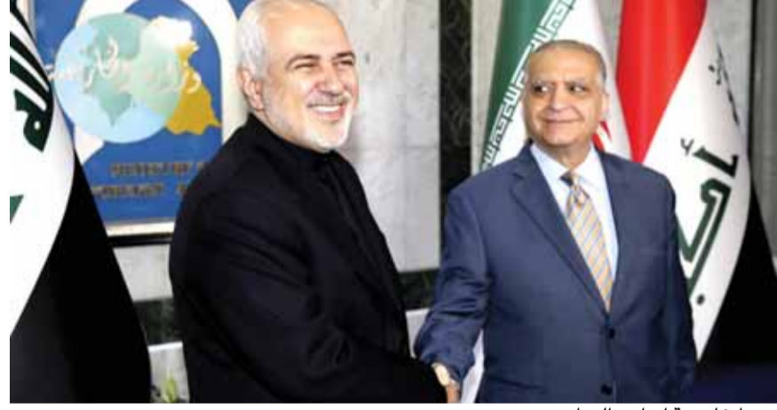
وزيرا خارجية إيران والعراق

قال وزير الخارجية العراقي محمد الحكيم، إن بلاده تقف مع إيران ضد ما وصفها بـ«الإجراءات الأحاديّة» للولايات المتحدة الأميركية ضد طهران. جاء ذلك خلال استقبال الحكيم لنظيره الإيراني، جواد ظريف، في العاصمة العراقية، بغداد، حيث قال في مؤتمر صحافي: «نحن نقولها بوضوح وبصدق،