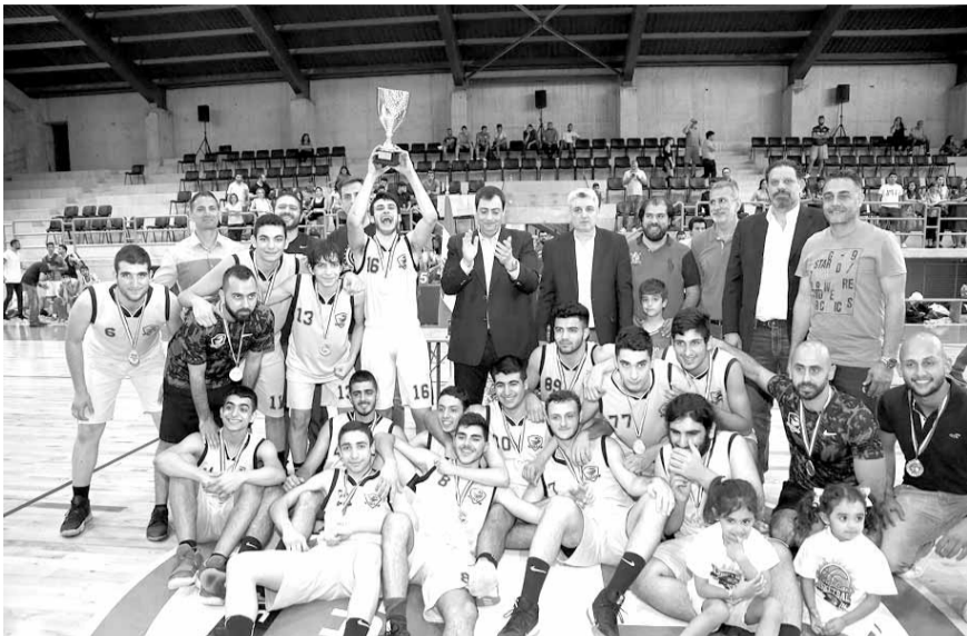
تتويج فريق أينييرجي البطل