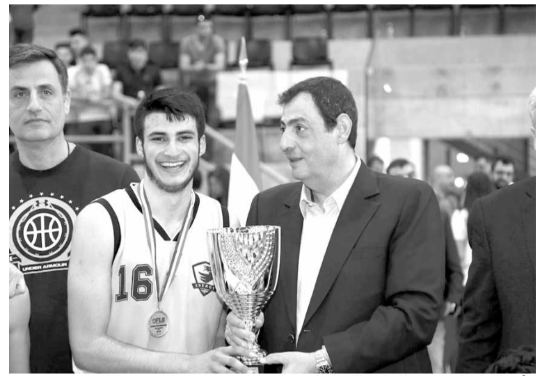
كأس المركز الاول من الحلبي الى دنيا