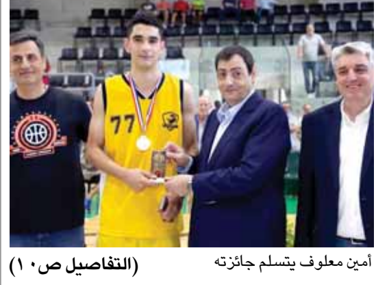
أمين معلوف يتسلم جائزته (التفاصيل ص ١٠)