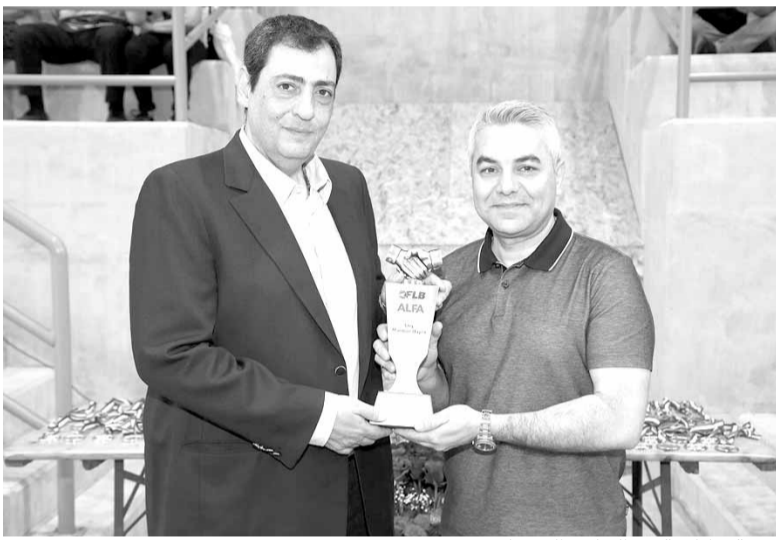
هدية تذكارية من الحلبي الى حايك