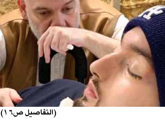
(التفاصيل ص ١٦)

تعرف الى عمليّة الإخلاء الجوي الأكثر إذهالاً في تاريخ «إسرائيل» احتجاجات في «إسرائيل» ضد منح نتيياهو الحصانة شاهدان يكسران صمتها حول وفاة الأميرة ديانا: ليس مجرد حادث مروري ص ١١ و ١٦