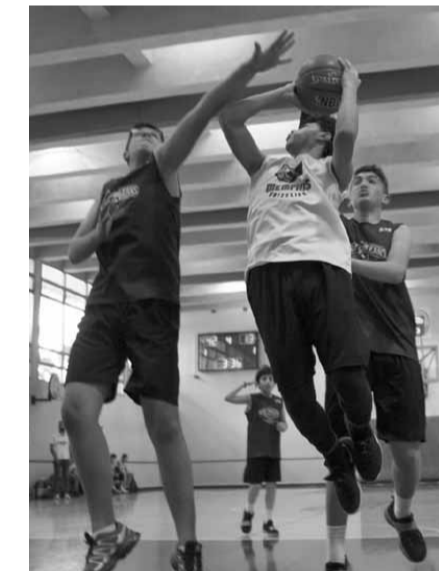
من إحدى مباريات الجولة الثالثة

روكتس (المؤسسة الوطنية الانجيلية-صيدا) (٨٢-٥) و دالاس مافريكس (راهبات الوردية-المتزه) على سان انطونيو سبيرز (الليسيه-فردان) (٥١-١) ونيويورك نيكس (سيدة اللويزة-ذوق مصبح) على تورنتو رابترز (القلبين الأقدسين-كفرحباب) (٣٩-٣٣) وعلى بوسطن سلتكس (العائلة المقدسة جونبة) (٤٤-٢٧) وميلووكي باكس (الشانفليل ديك المحدي) على انديانا بايسرز (الانجيلية بيروت) (٥٣-١٨) وديترويت بيستونز (انترناسيونال كولج-عين عمار) على