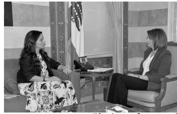
الحسن مجتمعة مع ميريام سكاف

اجتمعت وزيرة الداخلية والبلديات ريا الحسن مع رئيسة «الكتلة الشعبية» في زحلة ميريام سكاف، وتم تداول التطورات اللبنانية وأمور تتعلق بمدينة زحلة ومنطقتها على المستوى الخدماتي. وفي بيان لـ«الكتلة الشعبية»، أعلن أن الحسن وسكاف قد ناقشتا خلال اللقاء «أمورا خدمتية تهم زحلة والبقاع. ووعدت الحسن بدراسة وتلبية القضايا الملحة