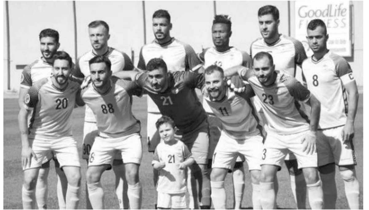
فريق العهد حامل اللقب