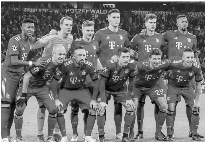
فريق بايرن ميونخ

ومن المتوقع أن يقم ١٨ ألف مشجع ٢٤٠ كيلومترا من بيرغامو في مباراة قد تكون تاريخية لفريق لم يسبق له اللعب في كأس أوروبا.