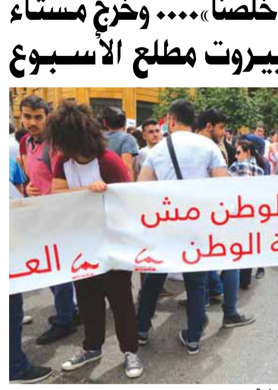
اعتصام اساتذة وطلاب الجامعة اللبنانية

كتب محمد بلوط انتهى مجلس الوزراء «عملية» درس الموازنة لكنه تريت في «اعلان مراسم انهاءها رسميا الى جلسة اخيرة تعقد في عجبنا برئاسة رئيس الجمهورية لهذه الغاية تمهيدا لإحالتها الى المجلس النيابي لمناقشتها واقرارها بعد درستها بالتفصيل في لجنة المال الموازنة. ووفقا للمعلومات المتوافرة فإن النقاش خلال الجلسة دار حول عدد من الافكار (التتمة ص ١٦)