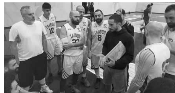
من تدريبات التعاضد