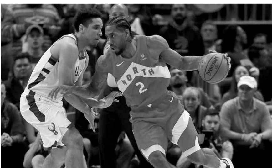
مباراة ميلووكي وتورونتو

على الجانب الآخر، يتمتع لايبزيغ بحصانة دفاعية، إذ