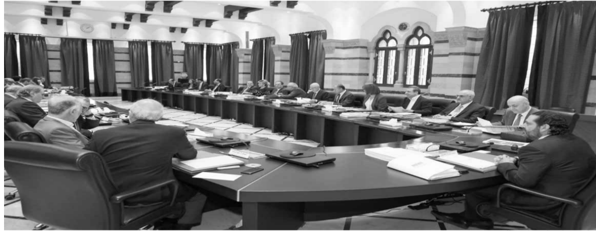
خلال جلسة مجلس الوزراء

نسبة عجز ٦٨٪، اقترحت الوزيرة ربا الحسن موضوع اللوحات العمومية، فتم تخفيض العجز إلى ٧٠٪، وبالتالي هناك اقتراحات خفضت العجز وأخرى رفعت الوردات، حتى وصلنا إلى هذه النتيجة من مجمل الاقتراحات التي وردت في جلسات مجلس الوزراء.