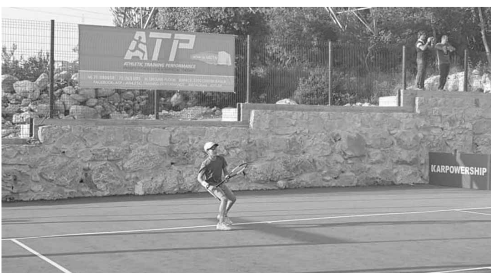
أحد اللاعبين خلال إحدى المباريات