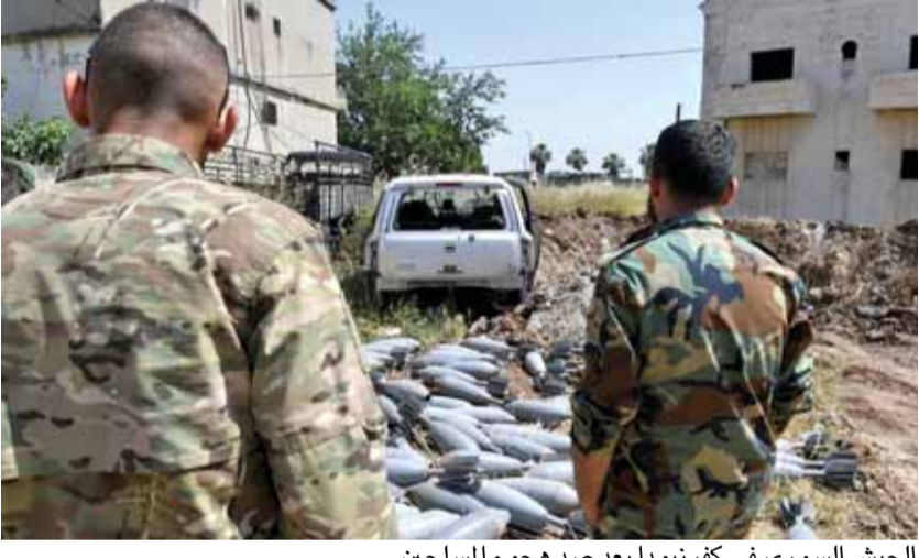
الجيش السوري في كفر تيبودا بعد صد هجوم المسلحين

لأول مرة حزب اردوغان يعلن لا مانع من اجتماعات بين المخابرات التركية والمخابرات السورية رغم ان انقرة تدعم جماعات مقاتلة ضد الرئيس بشار الأسد نظراً للخلافات المستحكمة منذ سنوات بين الرئيس التركي اردوغان ونظيره الروسي بشار الأسد في آخر اتصالات بين القيادة الروسية والقيادة السورية توافق الطرفان على وجوب انتهاء الإرهاب في محافظة ادلب وبالتحديد جبهة النصرة الإرهابية والرئيس بوتين والجيش الروسي لم يكونا على حماس لاقتحام ادلب الا ان قصف الصواريخ من ادلب على القاعدة الجوية الروسية في حميميم كل يوم منذ اسبوع جعلت الرئيس الروسي بوتين يتحرك كي تتوافق الأطراف الاربعة التي اجتمعت في إسطنبول لاقتحام ادلب من الجيش السوري (تنمة الخبر السوري ص ٢)