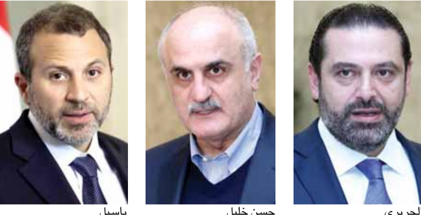
باسيل حسن خليل الحريري

صراع أرقام؟ الصراع القائم حالياً هو حول تخفيض عجز الموازنة إلى أقل من ٧٪ أو الإحتفاء بعجز ٧,٣٪. استطاع مجلس الوزراء تحقيقه حتى الساعة. وتتص المعايير العالمية أن الإنتظام المالي للدولة لا يمكن أن يتم إلا بالمحافظة على عجز في الموازنة أقل من ٣٪ من الناتج المحلي الإجمالي إضافة إلى دين عام أقل من ٦٠٪ من الناتج المحلي الإجمالي. لقد تعهد لبنان خلال مؤتمر سيدر، بخفض عجز موازنته إلى أقل من ٥٪ خلال خمس سنوات ابتداءً من العام ٢٠١٨.