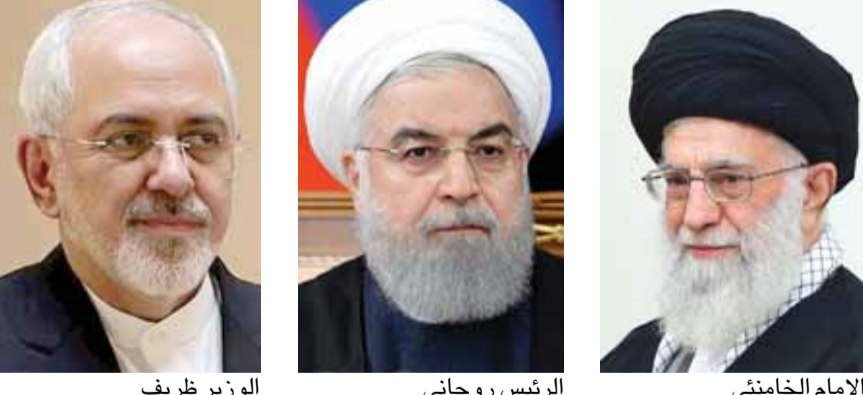
الوزير ظريف الرئيس روحاني الامام الخامنئي

بينما تتصاعد التوترات مع الولايات المتحدة، نأى المرشد الإيراني الأعلى علي خامنئي بنفسه عن اتفاق نووي تاريخي أبرم عام ٢٠١٥، مع القوى العالمية، قائلاً إن رئيس البلاد ووزير الخارجية لم يتصرفا كما كان يرغب بالنسبة لتطبيق الاتفاق. وأضاف خامنئي، في تعليقات نشرها موقعه الرسمي على الإنترنت «إلى حد ما، لم أقتنع بالطريقة التي طبق بها الاتفاق النووي. في كثير من الأحيان، ذكرت الرئيس ووزير الخارجية» بذلك. وتابع «لائق كثيراً في الوسيلة التي دخل بها (الاتفاق) (تنمة الخبر الإيراني ص ١٦)