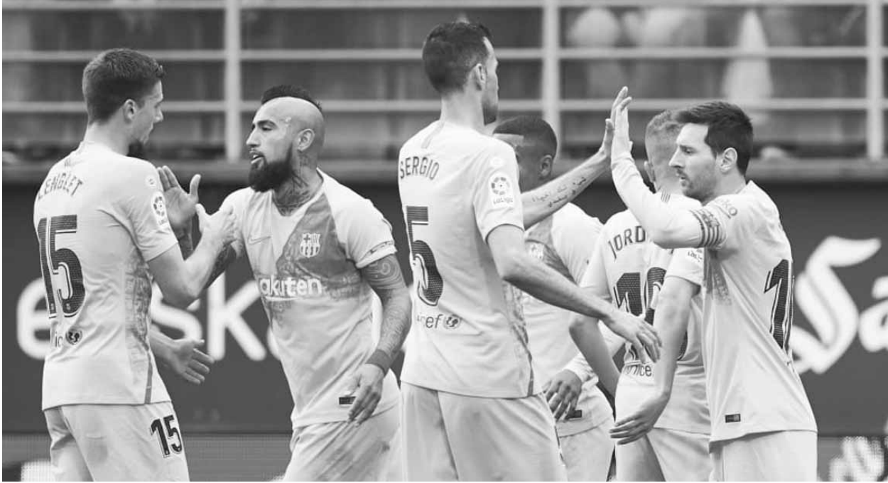
فرحة ليونيل ميسي مع زملائه

أسدل ريال مدريد الستار على موسمه المخيب بسقوط على أرضه أمام ريال بيتيس صفر-٢ أمس الأحد في المرحلة الفامنة والثلاثين الأخيرة من الدوري الإسباني لكرة القدم، محققاً بذلك أسوأ موسم له منذ ١٩٩٨-١٩٩٩.