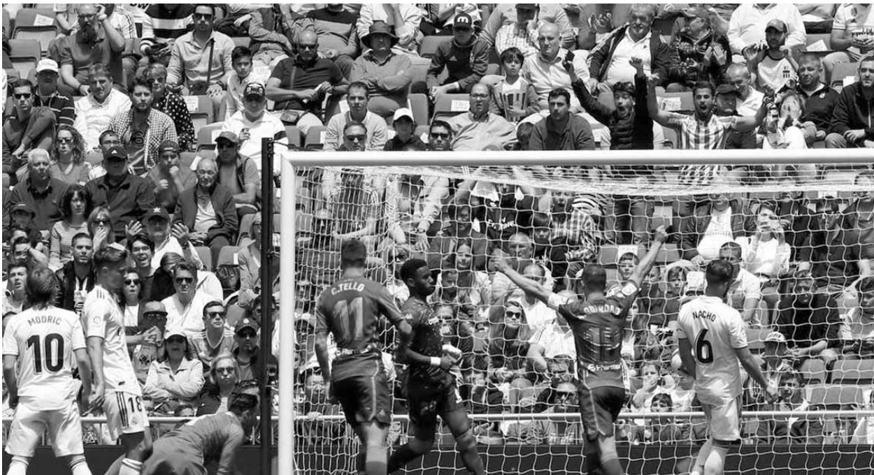
الهدف الثاني لريال بيتيس في مرمى ريال مدريد

والخسارة في المرحلة الختامية أمام الضيف الأندلسي، تعكس تماماً الموسم المخيب الذي عاشه ريال مع ثلاثة مدربين مختلفين. ويعد أن بدأ الموسم مع مدرب المنتخب الإسباني السابق جون لوبيتيفي الذي خاض ١٠ مباريات فقط في الدوري، ففاز في ٤ وتعادل في ٢ وخسر أربع، تعاقب ريال مع لاعبه السابق الأرجنتيني سانتياغو سولاري الذي حقق بداية واعدة معه ما ضمن له الحصول على عقد نهائي بعد أن استلم المنصب بشكل مؤقت في بادئ الأمر، لكن سرعان ما تراجعت النتائج، فترك منصبه بعد ١٧ مرحلة في شلا ليغاشا وفي رصيده ١٢ فوزاً مع تعادل ٤ وهزائم.