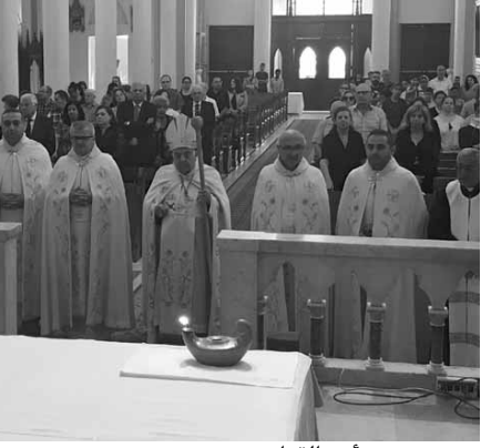
بو جوده يترأس القداس

الاقيم في كنيسة مار مارون في طرابلس، قداس وجناز لراحة نفس المثلث الرحمة المطران رولان أبو جوده، ترأسه رئيس اساقفة ابرشية طرابلس المارونية المطران جورج بو جوده، حيث القى عظة قال فيها: «تربي المطران ابو جوده، على يد والدته وخاله المحامي اللامع، الذي كان يحتل مركزاً مرموقاً في المجتمع والعائلة، فابعد في دراسته، من خلال تخصصه بالحقوق، وتدريبه على الخدمة في الحركة الكشفية، وبعدها مارس المحاماة لفترة من الزمن، سماع صوت الرب يقول له اتبعني وتبعه مكرسا حياته للخدمة في سر الكهنوت، فامضى حياته الكهنوتية والاسقفية كلها في الخدمة، ولم يسع للحصول على المراكز المرموقة...» اضاف «عاش الطاعة والخدمة طال حياته، بروح تواضع مميزة، ترك دروسه واختصاصاته في اميركا، عندما استدعاه راعي الابريشية المطران الياس فرح، ليؤسس