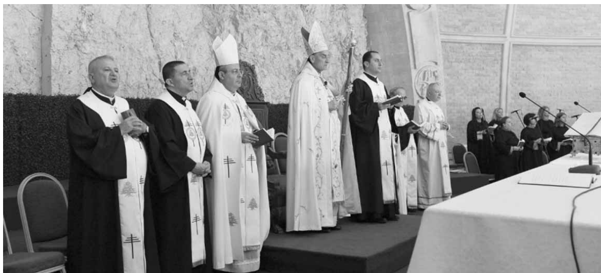
الراعي يتأرس القداس

وتابع «السؤال الذي وجهه الرب يسوع إلى سمعان - بطرس للتأكد من حبه المميز له، هو إياه وجهه على التوالي إلى المثلثي الرحمة. وجهه إلى الشاب نصرالله في ريفون،