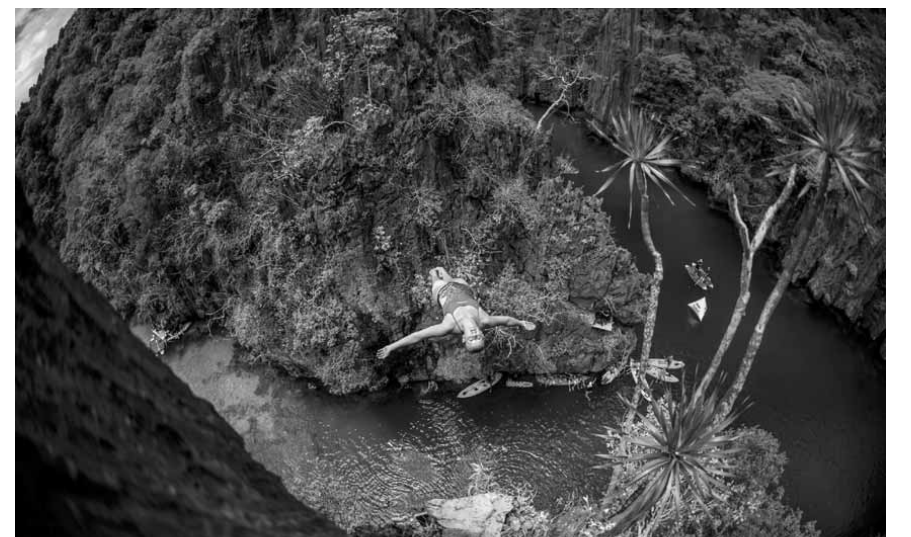
لقطة من إحدى مسابقات القفز في المياه

بطولة «ريد بل للقفز في المياه» (الشك) من على صخرة الروشة الشهيرة في العاصمة بيروت في ١٣ و ١٤ تموز المقبل، وسيشارك في المسابقة ١٠ رجال و ١٤ سيدة ومنهم أبطال عالم وابطال اولمبيون من ١٨ جنسية.