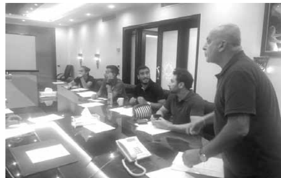
خلال عملية سحب القرعة

سحبت قرعة بطولة دوري الناشئات (دون ١٧ عاماً) في مقر الاتحاد اللبناني لكرة القدم في فدان التسعة المشاركة في البطولة.