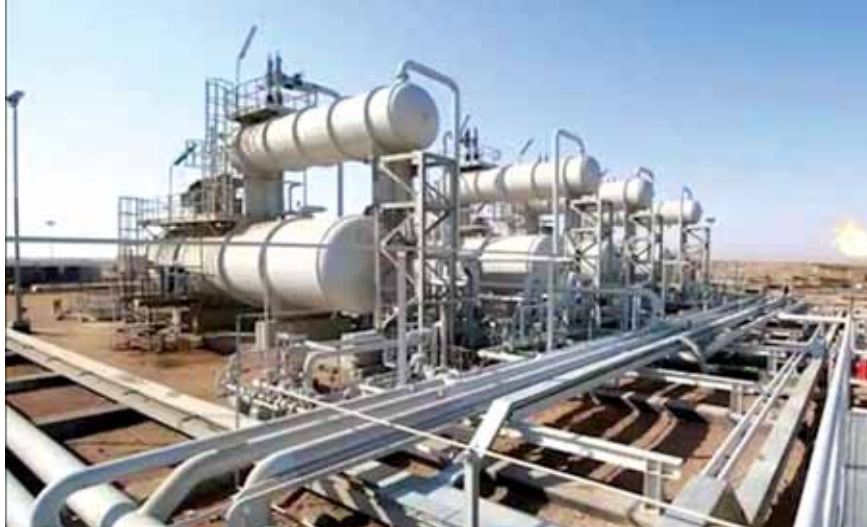
شركة النفط الأميركية في العراق

أعلنت شركة نفط أميركية عملاقة، امس، بدء إجلاء موظفيها من العراق ونقلهم إلى دبي. ذكرت «رويترز» ان شركة النفط الأميركية «إكسون موبيل» بدأت إجلاء موظفيها من حقل «القرنة» النفطي في البصرة جنوبي العراق، مشيرة إلى أنه يجري نقلهم إلى دبي. وذكرت ثلاثة مصادر لـ«رويترز» ان الشركة الأميركية أجلت جميع موظفيها الأجانب من حقل (غرب القرنة ١) النفطي في العراق، بينما قال مسؤولون عراقيون إن الإنتاج في الحقل لم يتأثر بالإجلاء. وأضافوا: «العمل يسير بوتيرة طبيعية ويتولى مسؤوليته مهندسون عراقيون».