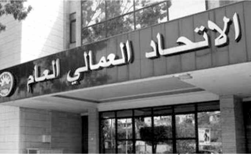
مصير التحركات بات مجهولاً