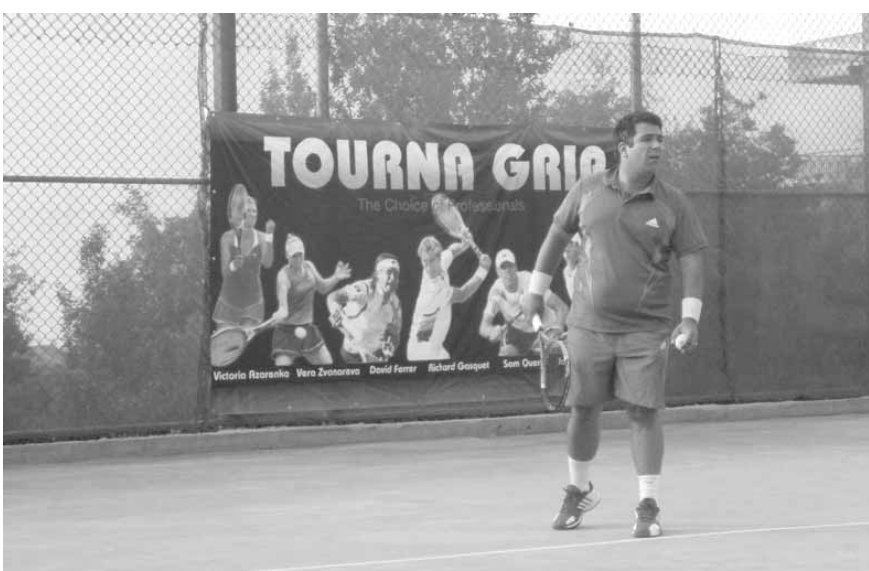
احداللاعبين خلال إحدى المباريات

اليوم التاسع على التوالي، تواصلت دورة اللاعب الراحل رالف أبي كرم بالتنس التي ينظمها نادي الكهرباء زوق مكايل على ملاعب أكاديمية ألف أبي كرم بمشاركة ١٨٢ لاعباً ولعبة، وبإشراف الاتحاد اللبناني للعبة، وبرعاية «دونلوب» و«أي تي بي» و«تعايل».