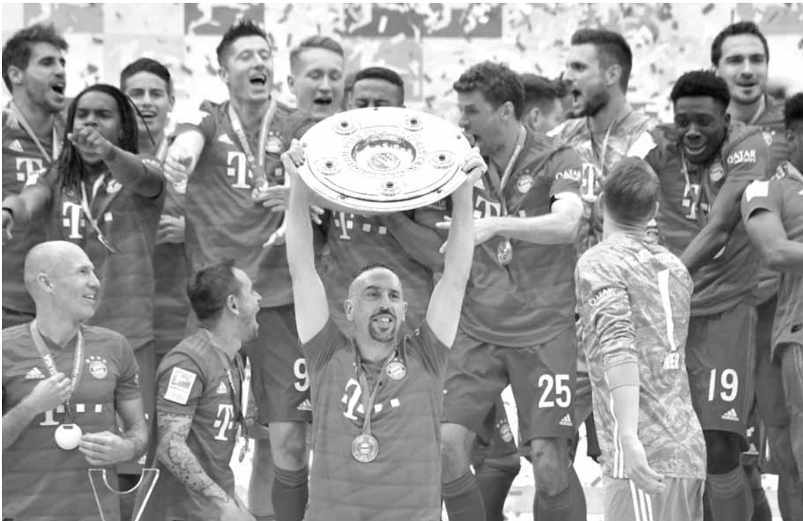
دردع الدوري الألماني مع لاعبي بايرن ميونخ

توج بايرن ميونخ بلقب بطل الدوري الألماني للمرة السابعة تواليًا بفوزه على ضيفه إينتراخت فرانكفورت ٥-١ أمس السبت في المرحلة الرابعة والثلاثين الأخيرة. وسجل الفرنسي كينغسلي كومان (٤) والنمساوي دافيد ألبا (٥٣) والبرتغالي ريناتو سانتشيز (٥٨) والفرنسي فرانك ريبيري (٧٢) والهولندي أرين روبن (٧٨) أهداف بايرن ميونخ الذي توج باللقب على أرضه وأمام جماهيره للمرة الأولى منذ عام ٢٠٠٠، فيما سجل الفرنسي سيباستيان هاليه (٥٠) الهدف الوحيد لفرانكفورت.