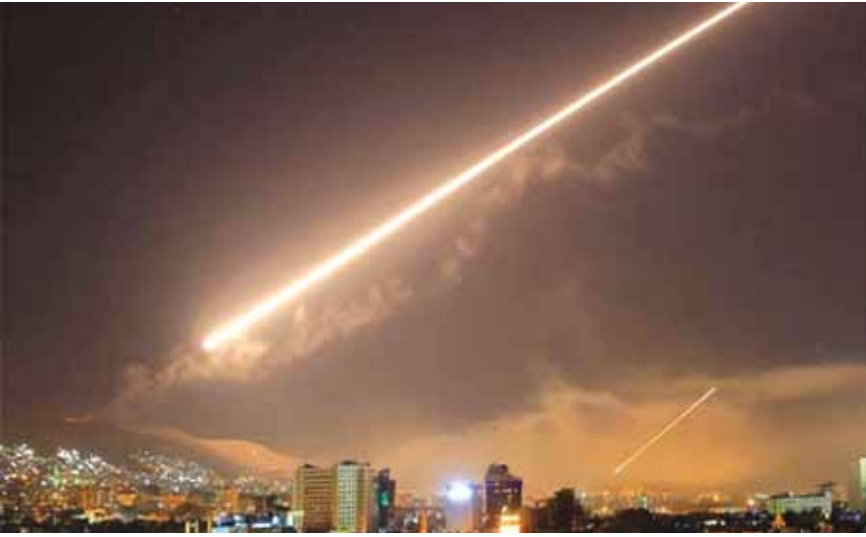
القصف على محيط دمشق ليلا

دوي «انفجار» سُمع في محيط دمشق مساء الجمعة. وفي ١٣ نيسان، تصدت الدفاعات الجوية السورية لقصف جوي إسرائيلي استهدف منطقة مصياف في محافظة حماة بوسط سوريا وأسقطت صواريخ عدة، بحسب ما أفادت سانا التي تحدثت عن جرح ثلاثة مقاتلين. من جهته قال المرصد السوري وقتذاك إن ذلك القصف أدى إلى سقوط «قتلى من المقاتلين الإيرانيين».