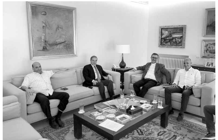
خلال اجتماع نادي الراسينغ والسلام زغربا

وبعد الاجتماع أصدر نادي الراسينغ بيروت والسلام زغربا البيان التالي: