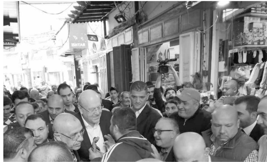
ميقاتي خلال جولة في السوق العريش في طرابلس

جدد الرئيس نجيب ميقاتي تأكيد «التوافق مع جميع نواب طرابلس على وضع السياسة جانباً وإعداد لائحة بأولويّات مشاريع المدينة وعرضها على الحكومة لتنفيذها»، لافتاً إلى أنه بحث هذه المطالب مع رئيس الحكومة سعد الحريري «الذي أبدى الاستعداد التام للتعاون». وقال خلال رعايته حفل افتتاح السوق العريش في طرابلس بعد انجاز تاهيله وترميمه من «جمعية العزم والسعادة الاجتماعية»: «الأساس لدينا هو طرابلس ككل،