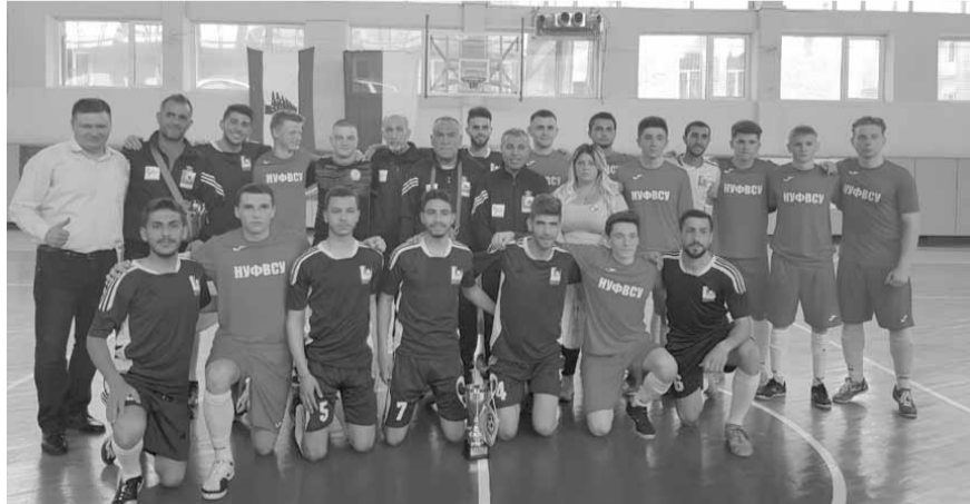
بعثة الجامعة اللبنانية وفريق جامعة كيبيف للعلوم الرياضية

دشنت بعثة فريق «الميني فوتبول» في الجامعة اللبنانية درب تعاون رياضي مع جامعات أوكرانية مرسية دعائم تبادل دوري للزيارات، كانت استهلته الشهر الماضي بتوجهها الى كيبيف بدعوة من جامعة العاصمة الأوكرانية للعلوم الرياضية، حيث خاضت ثلاث مباريات ودية.