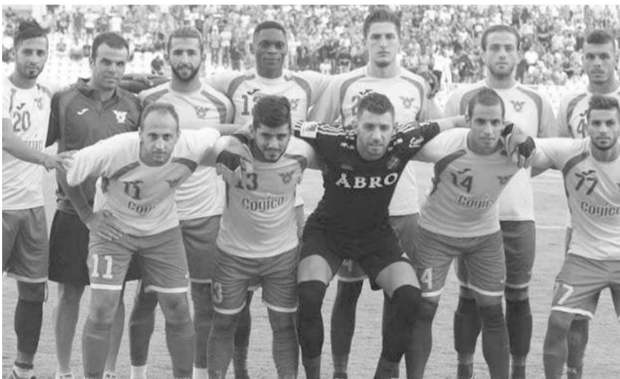
هل ينجو فريق الصفاء من السقوط الى الدرجة الثانية اليوم؟