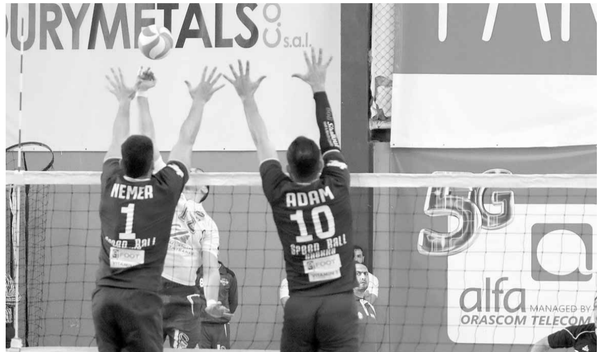
لقطة من المباراة النهائية الأولى