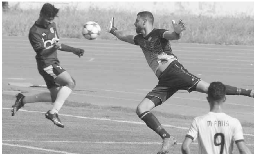
من إحدى مباريات النجمة والعهد