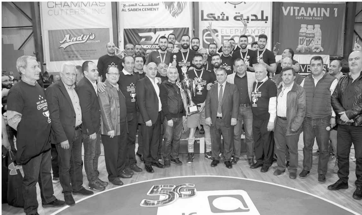
تتويج فريق سبيدبول شكا البطل