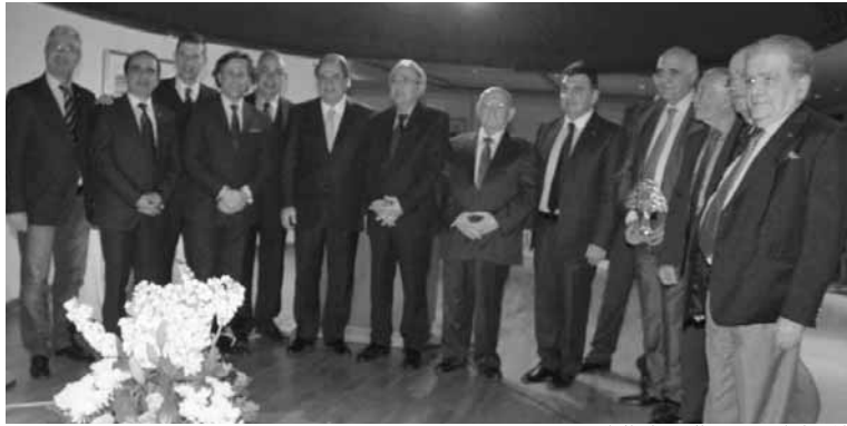
المشاركون في العشاء التكريمي

وقال: «إن الصحافيين ليسوا سلطة خارجية على الدولة والقضاء الذي نريد فاعلا ونزيها، متمنين أن