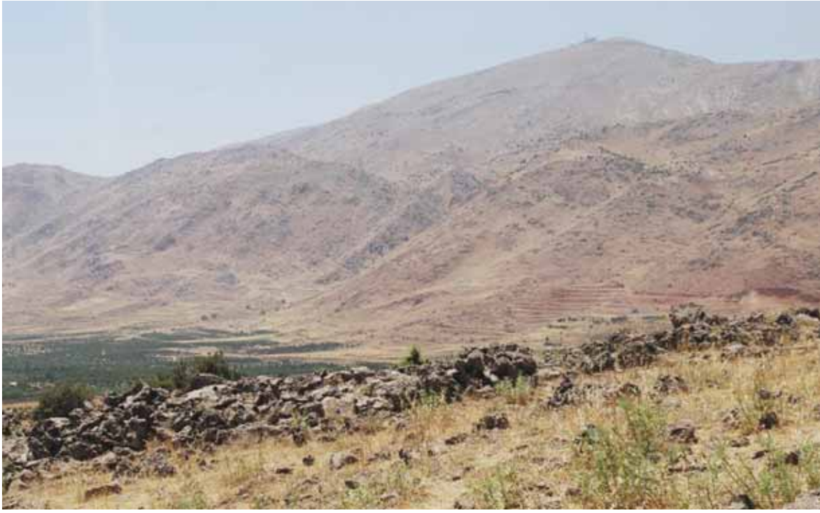
هضبة الجولان السوري المحتل