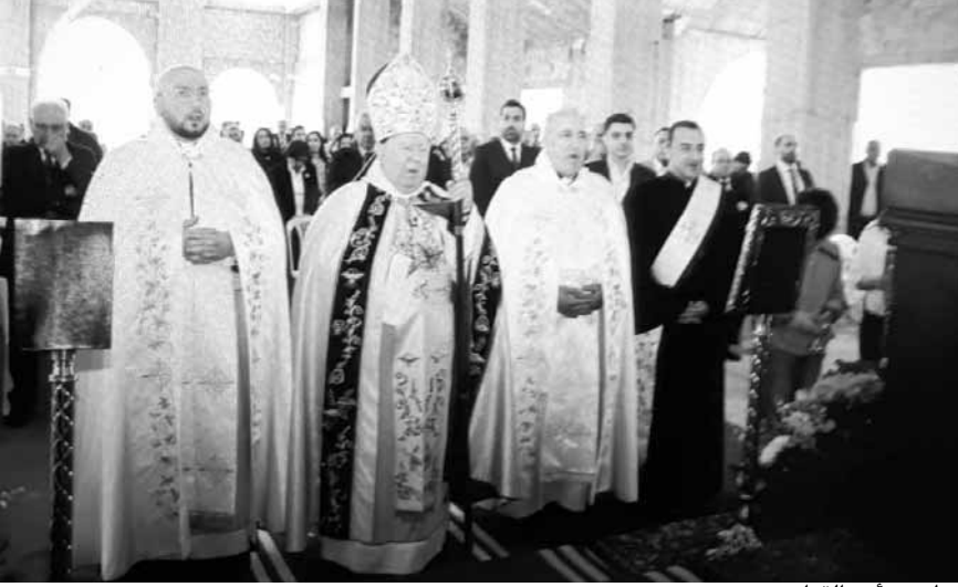
مطر يتراس القديس

أنكروا ماذا جرى في أبو ظبي، عندما وقع البابا فرنسيس على أرض الجزيرة العربية مع شيخ الأزهر هذه الوثيقة الكبرى الحبلية، تقول نحن إخوة في الإنسانية، كنا نقول نحن نظراء نحني نخبه بعضنا اليوم، تقول نحن إخوة في الإنسانية، ويجب أن نستعيد هذه الأخوة في ما بيننا لبناني للعالم مستقبلاً جديداً. الدعوة لنا جميعاً أن نلتقي في بيت الأب الذي خلقنا من طينة واحدة، هذا هو معنى التاريخ ولهذا لبنان وطن ثمين لأننا نعيش فيه هذا التقارب بين الأديان، يوماً بيوم على الرغم من كل الصعوبات، ولكن كل هذه الصعوبات تمحوها المحبة والغفران والفرصة الجديدة».