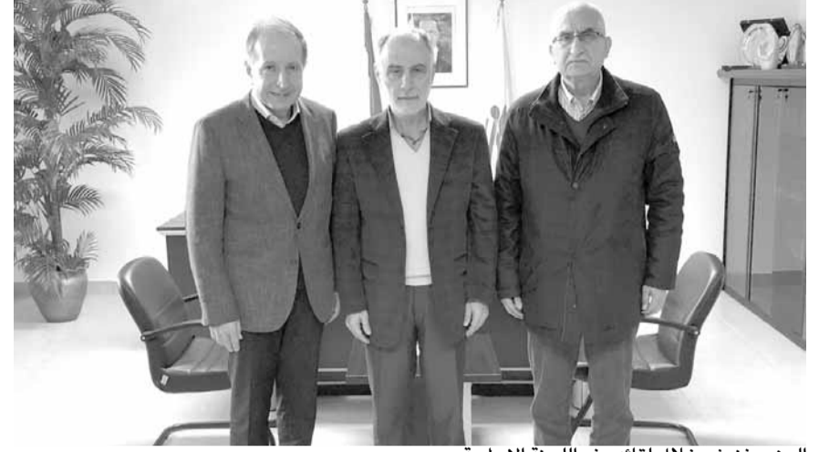
الوزير فنيش خلال لقائه وفد اللجنة الأولمبية

قام رئيس اللجنة الأولمبية اللبنانية جان همام والأمين العام للجنة العميد المتقاعد حسان رستم بزيارة وزير الشباب والرياضة محمد فنيش في مكتبه بالوزارة حيث كانت مناسبة للتهنئة بإعادة تكليف الوزير فنيش بمهام هذه الوزارة وهو ما اعتبره همام دليلاً ثقتاً بالأداء خلال الولاية السابقة والتي شهدت إحداث نقلة متقدمة في ماهية المعالجة للتحديات القائمة على الساحة الرياضية المحلية والسياسات التي تم اعتمادها والقرارات التي اتخذت على غير صعيد. وكانت الزيارة مناسبة لجولة أفق من النقاشات التي هدفت إلى كيفية إستنهاض الواقع الرياضي في لبنان وعلى ضوء المداولات طلب الوزير فنيش من اللجنة الأولمبية إعداد دراسة عن واقع الرياضة في لبنان والتحديات التي تواجهها والأليات التي يمكن إستخدامها لتحقيق النهوض بالواقع. كذلك تم التوافق على إعداد دراسة حول