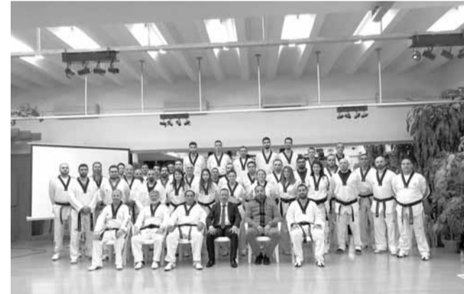
حضر الدورة رئيس ظريفية وكبار الحضور مع المنخرطين في الدورة

الاطراف من داخل الإتحاد وخارجه وهو أساس النجاح كما دعا كل من أهل اللعبة والمدربين والأهل والأندية إلى تقدير لجان الإتحاد وأفراده الذين يسعون جاهدين للعمل على المستوى الإداري والفني واللوجستي من أجل إتحاد أفضل. وتمنى ظريفية على كل شخص المشاركة والمساعدة لإنجاح الإتحاد والدفع به للمضي قدماً إذ يمكن للجميع المساهمة بشتى الطرق حتى بدون الإضمام إلى اللجان العاملة في الإتحاد. وطالب ظريفية أهل اللعبة والحضور نقل ما سبق وذكر لكل من لم يتمكن من التواجد في التوري من أهل ولاعبين. كما دعا عائلة التايكواندو اللبنانية إلى الترفع عن أفكار المجتمع وذاكرته القصيرة حيث الكلام بفوق العمل وهذا ليس الهدف المطلوب «إذ أن هدفاً العمل المتميز». ونوه ظريفية مرة أخرى بالمجهود الكبير الذي تبذله لجان الإتحاد كما أكد ترحيبه الشخصي وترحيب الإتحاد لأي ملاحظة بناءة من قبل أهل اللعبة والمدربين متمنياً إرفاق أي ملاحظة مكتوبة أو شفوية موجهة لأي عضو من لجان الإتحاد بكلمة «بعلطيك ألف عافية إذا فينا نعمل...» مما يظهر رفي التعامل والتقدير المرعى إليه بالعلاقات بين جميع الأطراف المعنية.