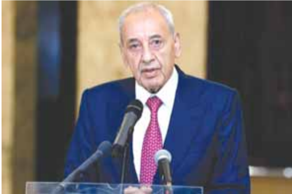
الرئيس بري (التفاصيل ص ٤)