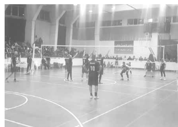
من مباراة القلمون وكفرحاتا