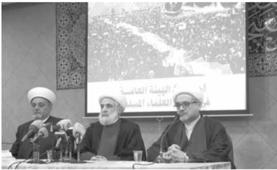
قاسم يلقي كلمته خلال الندوة

والجيش دافع حيث يمكنه ذلك من دون أن يشكل غطاء للمستكبرين، والشعب تحمل وحض ودعم وقدم الشباب والتضحيات من اجل أن نتصير في المعركة». وتابع «نحن في حزب الله ننظر الى الحكومة الجديدة على أنها محل خدمة للناس وإدارة صحيحة على المستوى السياسي في البلد، وهي ليست للمكاسب الشخصية ولا للمكاسب الطائفية ولا للمكاسب الحزبية، الحكومة محل عطاء وتضحية وهذا ما نرعي اليه، وزراء حزب الله سيعطون النموذج في الأداء الحكومي كما أعطوه سابقاً، أي أن لديهم ثقافة الكف والاهتمام بخدمة الناس وتصويب معالم الحكومة بما يتناسب مع مصالح الناس، وإبداء وجهة النظر الصحيحة للرأي العام. اليوم بدانا بتجربة ولم يمر علينا أسبوع، وإذا بوزير الصحة يحقق مجموعة من الانجازات دفعة واحدة خلال هذه الفترة القصيرة. كان هناك ١٠٥ أطباء متقاعدين مع وزارة الصحة مهمتهم التفتيش في المستشفيات من أجل إعطاء البدلات لمعاينة المرضى أو معالجة المرضى كي يصار الى