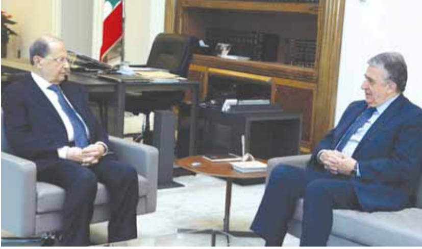
الرئيس عون مستقبلاً ناجي البستاني

استقبل رئيس الجمهورية العماد ميشال عون في قصر بعبدا، الوزير السابق ناجي البستاني وأجرى معه جولة أفق تناولت التطورات المحلية الراهنة إضافة إلى حاجات منطقة الشوف.