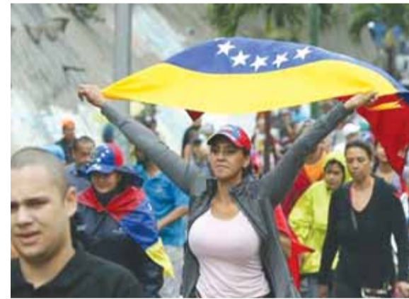
تظاهرات معارضة لـ «مادورو»

أعلن الرئيس الأميركي دونالد ترامب، أن أيام الاشتراكية في فنزويلا وغيرها من دول المنطقة مثل كوبا ونيكاراغوا باتت معدودة.