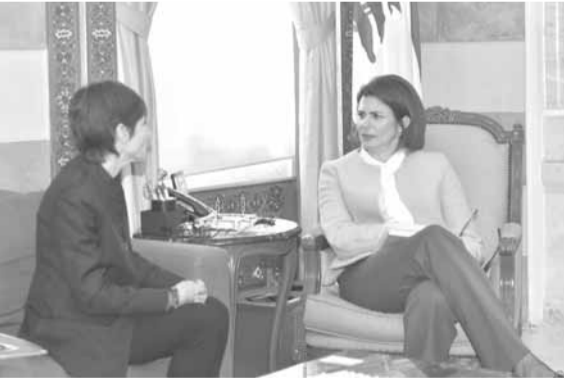
جيرار تزور الحسن

أصدرت وزيرة الداخلية والبلديات ريا الحسن قراراً امس، طلبت فيه من جميع المحافظات والقائمقاميات التابعة لها وضع صندوق للشكاوى لتلقي مراجعات المواطنين وشكواهم، على ان يتم الاعلان عنه في الاعلام، وان يصار الى ابداعها، جدولاً شهرياً يعدد الشكاوى المقدمة والعدد المعالج منها وفقاً لجدول ارفق بالقرار. من جهة ثانية، عرضت الحسن الاوضاع اللبنانية – المصرية مع سفير جمهورية مصر العربية نزيه النجاري. وكانت مناسبة تم فيها عرض العلاقات بين البلدين وشؤون ذات اهتمام مشترك. بعد اللقاء، صرح النجاري: «اطلعت من الحسن على ما تفكر ان تقوم به في المرحلة المقبلة»، مؤكداً ان «هناك امكاناً كبيراً للتعاون وتقديم الدعم لوزارة الداخلية»، مضيفاً «لن ندخر أي جهد في تقديم الدعم، كما هو الحال في مختلف المجالات، لدينا قدرات يمكنها ان تكون مفيدة جداً بالنسبة الى وزارة الداخلية، وهناك مساعدات تقنية من مختلف الانواع في مسائل تتعلق بالتدريب وبأمور مختلفة، والوزارة تدرس الآن مجمل القضايا المطروحة في الوزارة، ونحن جاهزون لتقديم اي دعم من