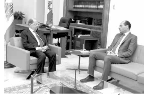
عون مجتمعاً مع مراد

الديبلوماسية في لبنان. ونوه رئيس الجمهورية بالجهود التي بذلها ارورا خلال وجوده في بيروت لتعزيز العلاقات اللبنانية-الهندية.