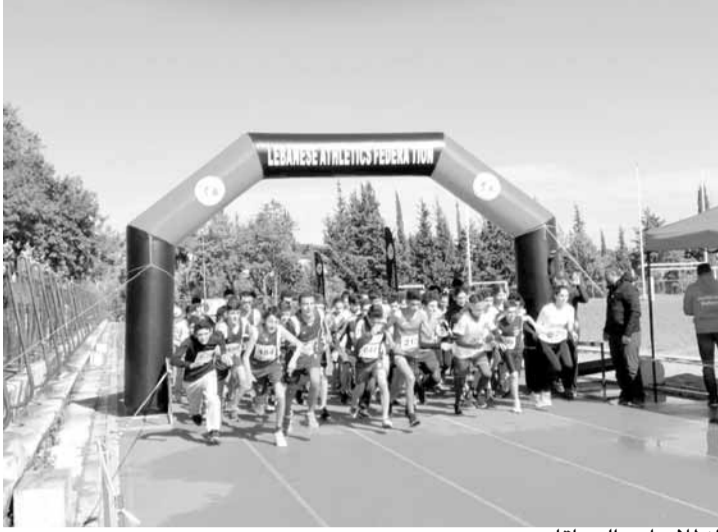
انطلاق أحد السباقات