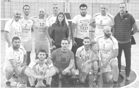
فريق نادي السفارة الأميركية

تاهل فريق نادي السفارة الأميركية الرياضي الى الدور نصف النهائي من بطولة لبنان لكرة الطائرة للدرجة الثانية بعدما تغلب في ١٤ مباراة من أصل ١٦ خاضها في الدور الأول، وذلك على فرق بيت منذر والشباب البترون والأندلس العقبية وكفرحاتا ومون لاسال عين سعادة والرياضي ١٨٧٥ (نهابا وإيابا)، وعلى الفيديار وفينيقيا جيبيل (فوز وخسارة). وتنتقل مباريات المربع الذهبي يوم الإثنين المقبل ١٨ شباط الجاري بمباراة فريقي السفارة الأميركية وحالات عند الثامنة والنصف مساءً على ملعب عشميت، على أن يلتقا مجدداً مساء الجمعة على ملعب حالات، ويلتقي الفائز منهما الفريق الذي سيحسم سلسلة الدور نصف النهائي الثاني الذي يجمع بين فريقي القلمون وكفرحاتا. ويتأهل الى النهائي الفريق الذي يسبق منافسه بالفوز في مباراتين من أصل ثلاث.