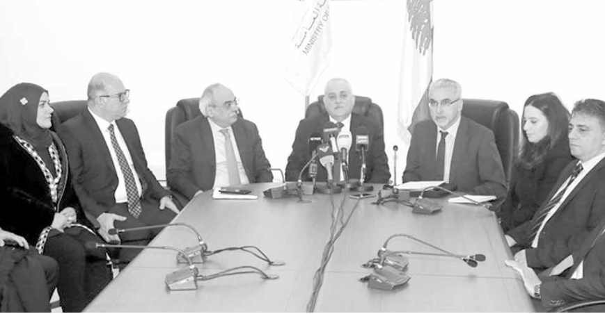
جبق خلال اجتماعه مع المسؤول الدولي

البرنامج الوطني في لبنان في مجال استخدام المواد الإشعاعية والكيميائية، والتوصل إلى توصيات ومقترحات يمكن للحكومة اللبنانية والأجهزة التابعة لها استخدامها لتحسين هذا البرنامج»، مؤكداً «كيفية تطوير العمل المشترك في المستقبل، خصوصاً وأن ثمة خبرة طويلة من العمل المشترك بين لبنان والوكالة الدولية للطاقة الذرية بهدف تحسين قدرات لبنان في مجال تعزيز الأمن والأمان في استخدام المواد المشعة، ما يؤمن الفوائد الكبيرة»، مبدياً «الإستعداد للاتفاق على مشاريع إضافية من شأنها تحسين التعاون في المستقبل».