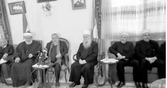
الغريب مستقبلاً قماطي والوفد المرافق

الخارجية الإيرانية، قال بالحرف الواحد عندما سئل عن الهبات التي تزيد ايران ان تقدمها الى لبنان: لبنان يستطيع ان يقبل الهبات ويستطيع ان يرفضها. اما نحن فإننا مع الهبات الإيرانية ومع السلاح والدواء والكهرباء وكل شيء.» هذا الزمن يجب ان يكون قد ولى ويجب ان تكون قد اصبحنا حرايا بعد كل هذه الانتصارات في لبنان وفي محور المقاومة وفي سوريا والعراق واليمن. انتهت ايام الهزائم ونحن منتصرون اليوم..