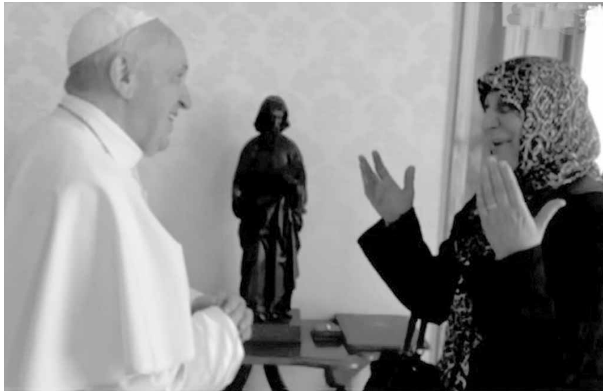
قداسة البابا مستقبلاً رباب الصدر

البابا : عملكم الجيّد ترجمة لأقوالكم ولحبكم للمحتاجين