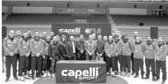
صورة تذكارية لكبار الحضور مع منتخب لبنان