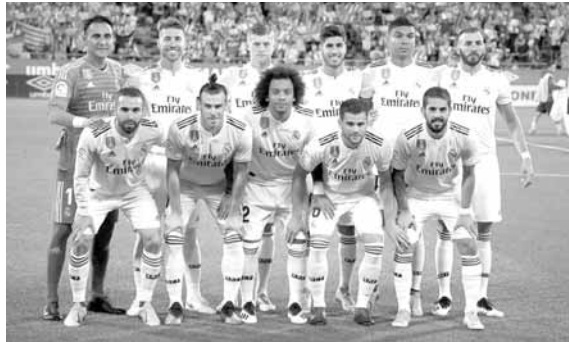
فريق ريال مدريد

تصدر ريال مدريد الإسباني قائمة أكبر أندية العالم، التي نشرتها مجلة «فرانس فوتبول» الفرنسية، ليتفوق على غريمه برشلونة، ومانشستر يونايتد الإنكليزي.