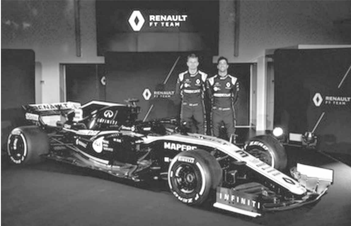
سيارة رينو الجديدة

وكان مارتن براوند التعاون في الفورمولا واحد قد أشار إلى أن ويليامز علقت ضمن «الفراغ» الذي خلّفته تحالفات فرق الوسط مع الفرق المصنّعية، لكن ويليامز ترى أنه «تجب حماية استقلالية الفرق» بدلاً من البحث عن نوعية