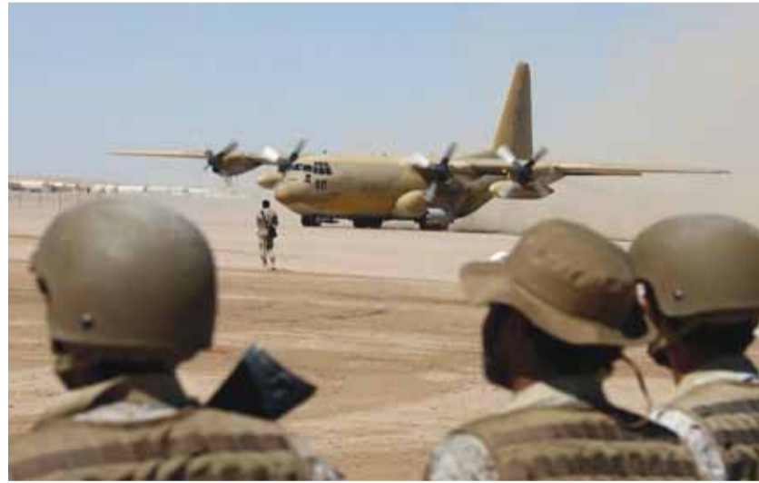
طائرات التحالف الدولي

هددت إدارة الرئيس الأميركي دونالد ترامب باستخدام حق النقض (الفيتو) ضد محاولة في الكونغرس لإنهاء الدعم العسكري الأميركي للتحالف بقيادة السعودية في حرب اليمن، ليستمر في مواجهة مع المشرعين بشأن السياسة تجاه المملكة. وأعاد مشرعون ديمقراطيون وجمهوريون قبل نحو أسبوعين طرح قرار بشأن سلطات الحرب كسبيل (التتمة ص ٢٠)