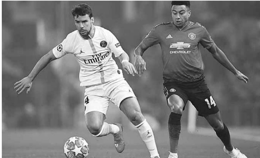
من مباراة مانشستر يونايتد وباريس سان جرمان

روما الإيطالي على بورتو البرتغالي (٢-٠) سجل لروما نيكولو زانيولو (٢) في الدقيقة ٧٠ و٧٧، ولبورتو أدريان لوبيز في الدقيقة ٧٩. ويلتقي اليوم الأربعاء عند الساعة العاشرة ليلاً بتوقيت بيروت أياكس أمستردام الهولندي مع ريال مدريد الإسباني، وتوتنهام الإنكليزي مع بوروسيا دورتموند الألماني.