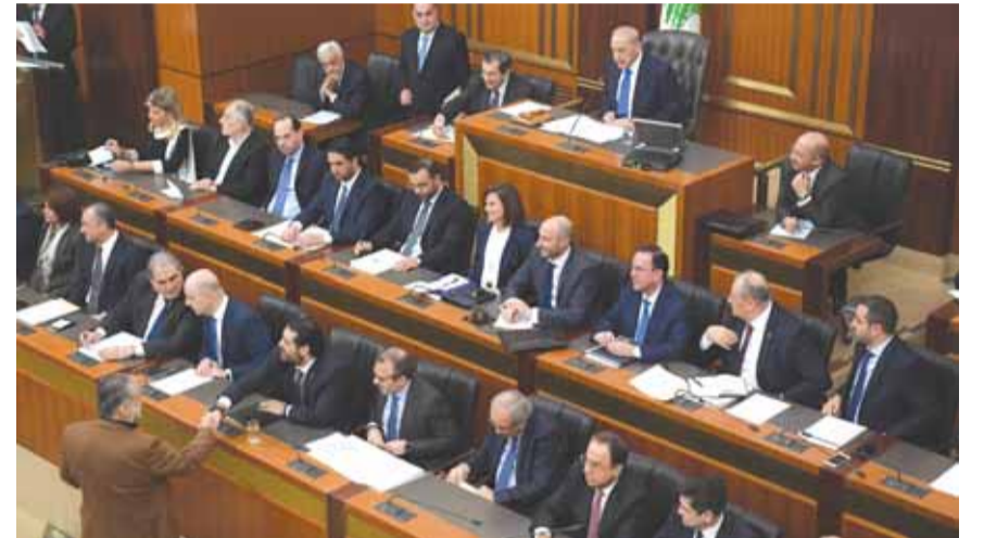
الرئيس بري مترئسا الجلسة ويبدو الرئيس الحريري و اعضاء الحكومة

ويذكر ان حوادث كانت قد حصلت في الشويفات ووقع علاء ابي فرج قتيلا كذلك حادثه الجاهلية عندما قامت قوة كبيرة من شعبية المعلومات بمحاولة محاصرة منزل الوزير السابق ونام وهاب وكادت ان تحصل اشتباكات كبرى بين عناصر شعبية المعلومات ومؤيدي الوزير السابق ونام وهاب لكن مرافق الوزير السابق وهاب وشبيهه اصيب (تتمة المانشيت ص ٢٠)