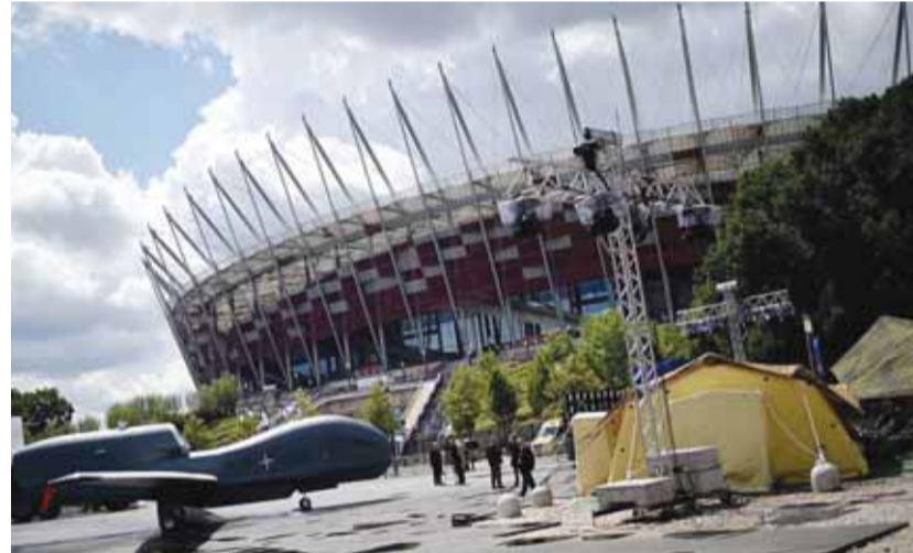
مكان انعقاد المؤتمر في وارسو

الذي يحتفل هذا الاسبوع بمرور ٤٠ عاما على اطيحة الاسلاميين المتشددين بالشاه المقرب من الغرب محمد رضا بهلوي واقامة الجمهورية الاسلامية. لكن مع تآكد حضور عدد محدود فقط من الشخصيات البارزة، خففت الولايات المتحدة وبولندا جدول الاعمال فاشارتا الى ان المؤتمر لن يركز على ايران أو يؤسس تحالفا ضدها لكنه سيهتم أكثر بالنظر بشكل اوسع الى الشرق الأوسط. وسيلقي نائب الرئيس الأميركي مايك بنس خطابا أمام المؤتمر الذي يشارك بومبيو في استضافته. (تتمة خبر واشنطن ص ٢٠)