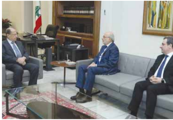
الرئيس عون مستقبلا شهاب و ابو فاعور