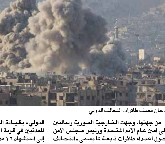
دخان قصف طائرات التحالف الدولي

ذكرت الوكالة السورية الرسمية للأخبار «سانا»، أن ٧٠ مدنيا على الأقل قتلوا وأصيبوا في قصف جديد لقوات التحالف الدولي في ريف دير الزور الشرقي بسوريا. ونقلت وكالة «سانا» السورية عن مصادر محلية قولها: «استشهد جرح ٧٠ مدنيا على الأقل في مجزرة جديدة لطيران التحالف الأميركي على مخيم للمدنيين في بلدة الباغوز بريف دير الزور الشرقي». وقد أعلن الناطق باسم التحالف الدولي، الذي تقوده واشنطن، أن القيادة تتحقق من انباء مقتل مدنيين في قصف على مواقع «داعش» في سوريا. وقال الناطق، لوكالة «سبوتنيك»، «نحن على دراية بتقارير عن احتمال سقوط ضحايا مدنيين. نحن نأخذ جميع الافتراضات حول الضحايا المدنيين على محمل الجد، لكننا نعلم أيضا أن هناك الكثير من المعلومات غير الصحيحة». وتابع «من المهم أيضا أن نشير إلى أن هناك العديد من القوى في هذا الإقليم التي تشن ضربات، لذلك نحن نتحقق من هذا».