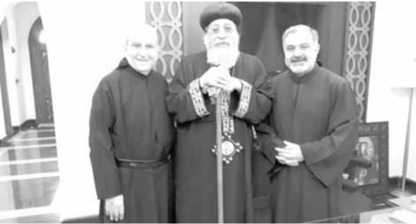
الابا تواضروس يتوسط مونس وضومط

عقد في مصر اجتماع مجلس كنائس مصر نوقشت فيه قضايا الكنائس والمواضيع الهامة في الكنيسة وعموم مؤمنيا. وفي هذا السياق، زار البروفسور الأب يوسف مونس والأب فريد ضومط (رئيس دير مار انطونيوس الكبير – بيروت) بابا الإسكندرية وبطريك الكرازة المرقسية البابا تواضروس في كنيسة الكرازة المرقسية في الإسكندرية. ورحب البابا بالأبوين وعرض معهما أهمية اجتماع كنائس مصر خاصة لبناء علاقات المحبة تطبيقاً لوصية المسيح القائلة «أحبوا بعضكم بعضاً»، وتعبيراً للصوت المسيحي في مصر والتعاون في كافة المجالات الإنسانية وقضايا الشباب والأطفال والمرأة وفي المجالات الاجتماعية، مشيراً الى أن «هذا الاجتماع هو لكسر حاجز البعد ويخلق مجالات التقاهم والتعارف».