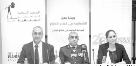
خلال ورشة العمل