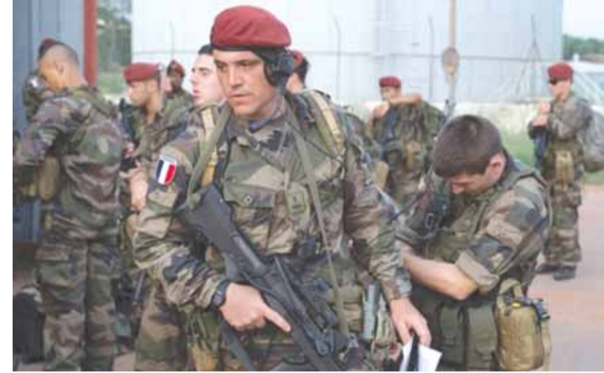
القوات الفرنسية في الرقة

قتل مراسل «سبوتنيك» في مدينة الرقة السورية أن انفجارا ضرب مقر المخابرات الفرنسية على اطراف الشمالية لمدينة الرقة مساء الاثنين ١١ شباط، لم تعرف حصيلته حتى الساعة. وأكد المراسل أن الانفجار الذي حصل قرب الساعة السابعة مساء أمس، استهدف مقرا للمخابرات الفرنسية التي تستولي على أحد مباني «معمل (التتمة ص ٢٠)