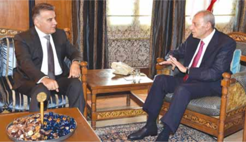
الرئيس بري مستقبلا اللواء ابراهيم

الفلسطينية العامة وتطورات المصالحة الفلسطينية. وظهر، عرض اللواء ابراهيم مع النائب عثمان علم الدين الاوضاع العامة في لبنان. وسئل ابراهيم بعد اللقاء عن مبادرة تشكيل الحكومة وما اذا كانت قد ماتت، فاجاب: «الان نحن نتكلم عن غير الحكومة».