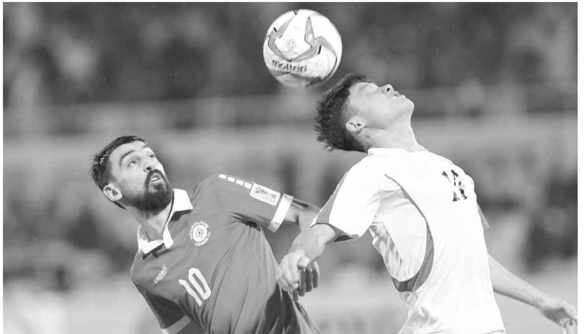
صراع على الكرة خلال مباراة لبنان وكوريا الشمالية

جمعه نقطتين فقط، بالتعادل سلبياً أمام سوريا والأردن في المجموعة الثانية. وتأهل من المركز الثالث كل من البحرين (٤ نقاط) وقبرغيزستان (٣ نقاط) وعمان (٣ نقاط).