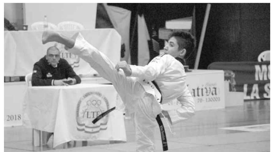
لقطة من المسابقة