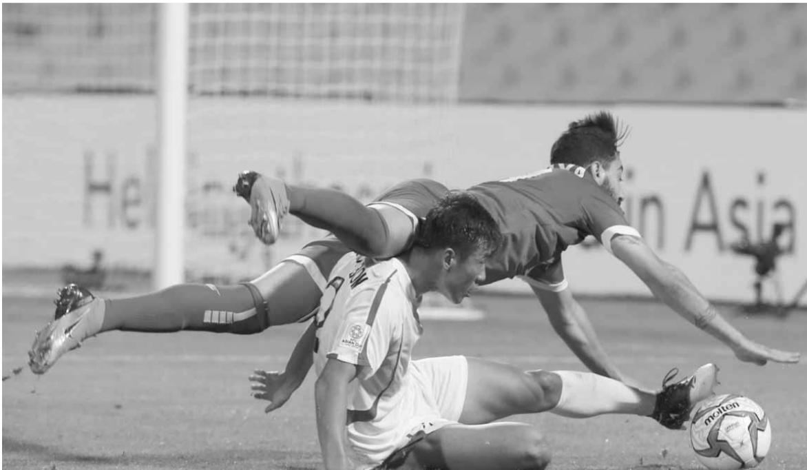
من لقاء لبنان وكوريا الشمالية