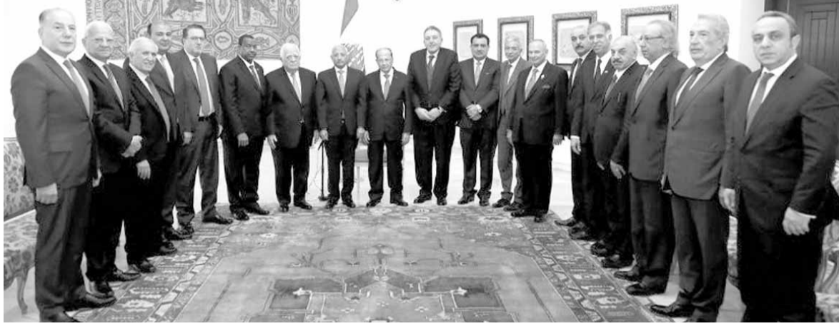
عون مع وفد اتحاد الغرف العربية

أكد رئيس الجمهورية العماد ميشال عون، ان «عالمنا العربي يعاني اليوم من صعوبات كبرى أبعدت المسافات بين الدول العربية، وهذه المرحلة لم تنته بعد»، آملاً ان «يحافظ القطاع الخاص العربي على الوعي الذي لديه ويعيد لم شمل الجميع»، مشيراً الى «ان دولنا العربية كافة بحاجة الى مثل هذا الحضور الجماعي الموحد لكي نتكاتف ونساهم في تذليل الصعوبات كافة».