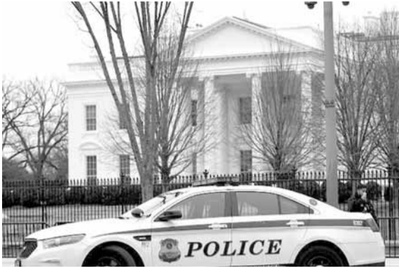
البيت الأبيض في واشنطن

أعلنت النيابة الأمريكية عن اعتقال شاب من ولاية جورجيا يبلغ ٢١ عاما بتهمة التخطيط لاستهداف البيت الأبيض بقذيفة مضادة للدبابات ثم اقتحامه بالأسلحة والقنابل.