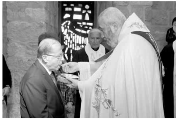
عون يتناول القربان المقدس (اللاتي ونهرا)

وكانت الجامعة العربية قد أوقفت عضوية سوريا في تشرين الثاني العام ٢٠١١، نتيجة لضغوط عدة مارستها دول عربية، ولاسيما الدول الخليجية، على خلفية الموقف من الصراع الدائر في هذا البلد، بعدما حملت حكومة الرئيس بشار الأسد المسؤولية عن مقتل مدنيين.