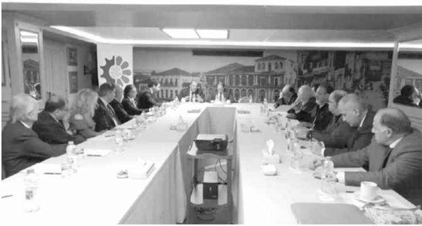
الجميل مع التجمع

بحث رئيس حزب الكتائب النائب سامي الجميل مع تجمع رجال الأعمال اللبنانيين المهوم الاقتصادية والاجتماعية التي يعاني منها لبنان، في ظل الأزمات التي يمر بها والتي تضع القطاع الخاص تحت وطأة تحديات