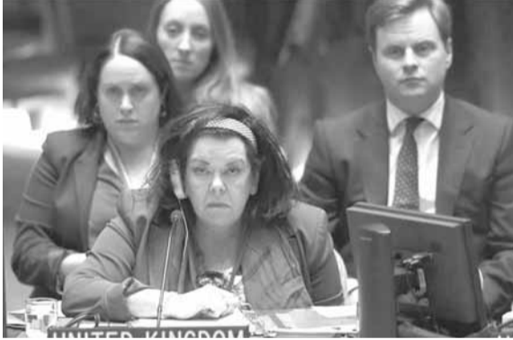
أعضاء مجلس الأمن يناقشون أوضاع الروهنغيا في ميانمار

اعلنت مندوبية بريطانيا الدائمة لدى الأمم المتحدة السفيرة «كارين بيرس» في وقت متأخر مساء الأربعاء إن مجلس الأمن الدولي قلق للغاية إزاء أوضاع الروهنغيا في ميانمار.