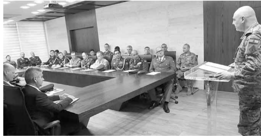
قائد الجيش يلتقي كلمته

أكد قائد الجيش العماد جوزاف عون، خلال استقباله وفدا من «رابطة المحققين العسكريين العرب والأجانب المعتمدين في لبنان» إلى ممثلي هيئة مراقبة الهدنة ومساعديهم، أن «العام المنصرم شهد استمراراً للأزمات السياسية على المستوى الإقليمي، ولا يزال العديد من بلدان المنطقة يعاني من الصروب الدموية، وسط سعي مستمر من الإرهاب إلى تنفيذ مخططاته