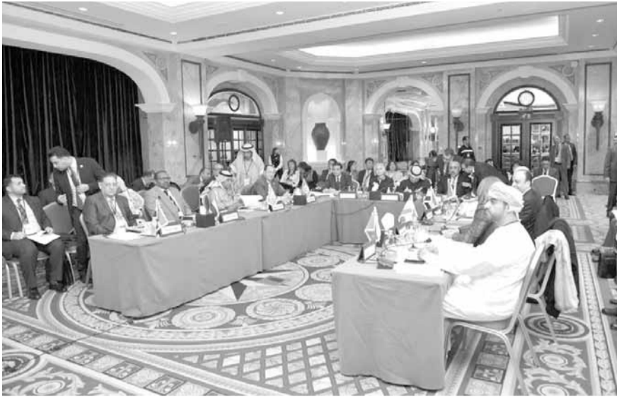
خلال اجتماعات الجلسة الأولى