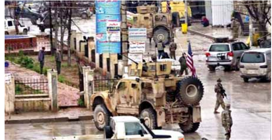
حواجز للقوات الاميركية في منبج

وأعلنت الخارجية الاميركية مستوى خطر السفر الى تركيا عند المستوى الثالث، بينما يبلغ مستوى خطر السفر الى المناطق الحدودية لسوريا والعراق المستوى الرابع وهو الأعلى. وحذر البيان المواطنين من السفر الى المناطق التركية القريبة من الحدود العراقية والسورية بسبب المخاطر